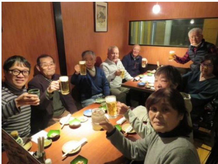
※第 93 回わいわい会（2024 年 3 月、秋葉原での反省会）

お酒を飲むのは、好きです！みんなとおしゃべりしすぎた後に、少し疲れてしまった時に呑むお酒はもっと好きでした！