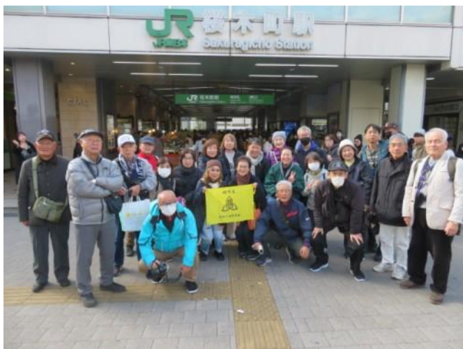
※第 100 回わいわい会結団式 (2025 年 12 月、JR 桜木町駅)

ご連絡、ありがとうございます。駅入口での、みなさん楽しそうなスナップ写真も拝見しました。「第 100 回記念わいわい会」当日は、「先約有り」とお伝えしましたが今、自分の行く未来世を考え、幾つかの健康検査を受診していて、変更が出来ない状態なのです。ご寛恕ください。「わいわい会」の皆様の、ご健康な日々を願っています。