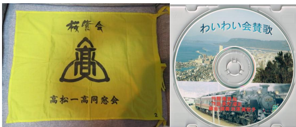
※わいわい会シンボル旗、わいわい会賛歌 CD