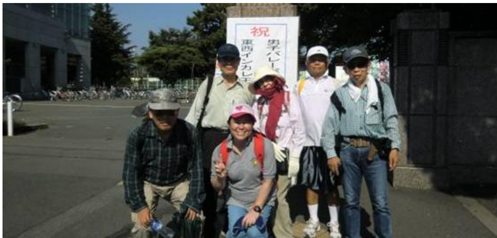
※第 39 回わいわい会 (2010 年 7 月)