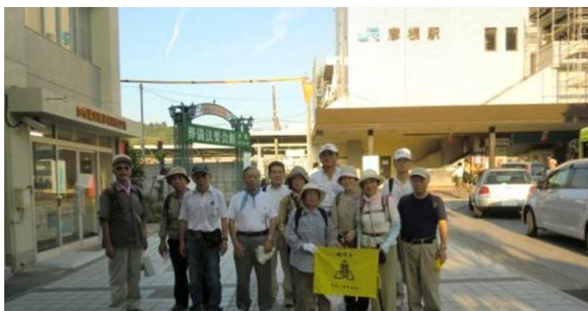
※第 43 回わいわい会（2011 年 7 月）

ワイワイ会の 100 回満了まことに、おめでとうございます。まさに、生きた証を実証できたのでは。このワイワイ会に初めて参加させてもらったのは、彦根城へ行った時からですが、その後毎年 7 月下旬の宿泊付きワイワイ会に参加させてもらうことが夏の楽しみの一つでありました。歩いたあとの大宴会が特に楽しみでした。長い間 本当にありがとうございました。