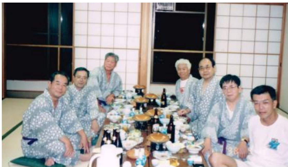
※箱根ひめしやら合宿（1998年9月12日（土））