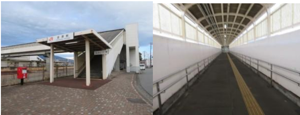
※JR 吉原駅の通路を横切る