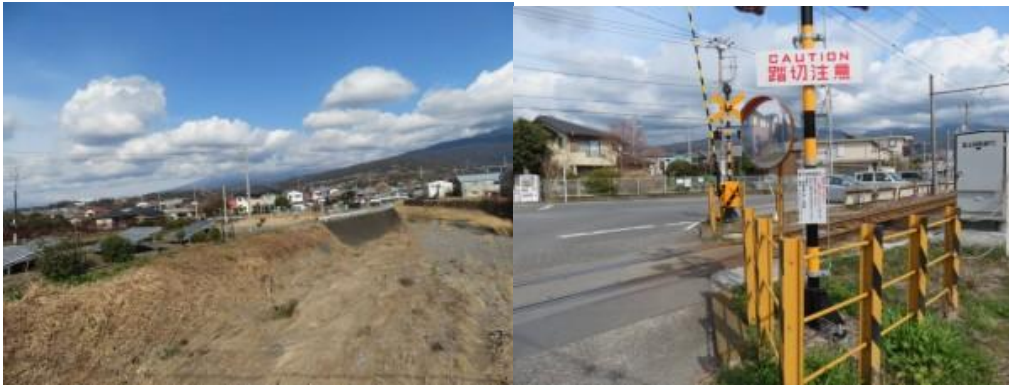
※岳南富士岡駅への路