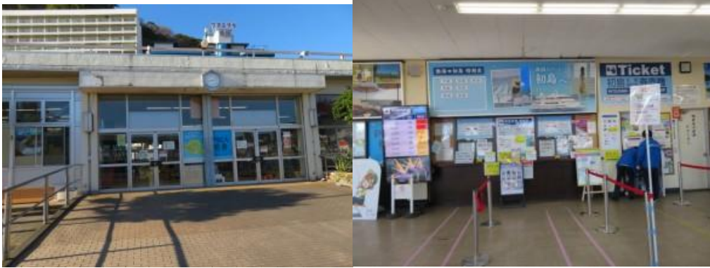
※高速船乗り場待合室