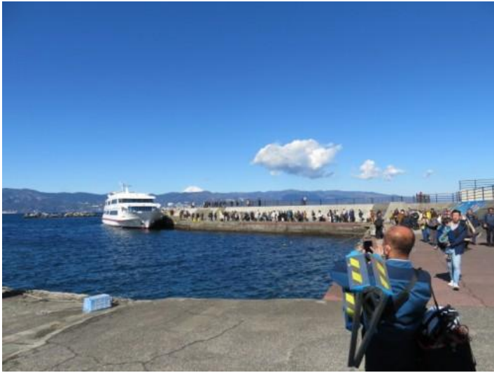
※初島から雪化粧がある富士山をゲットする