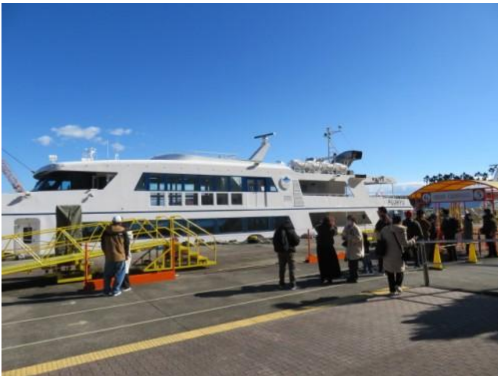
※イルドバカンス3世号