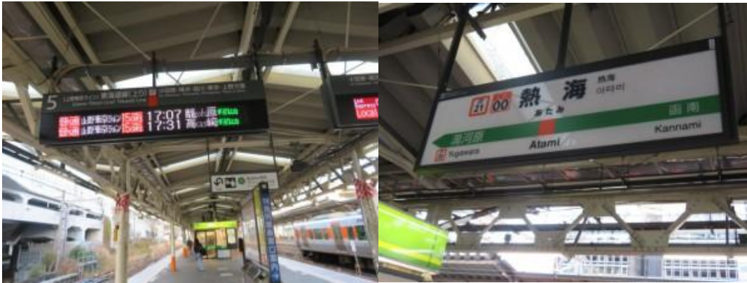
※熱海駅から帰宅の途