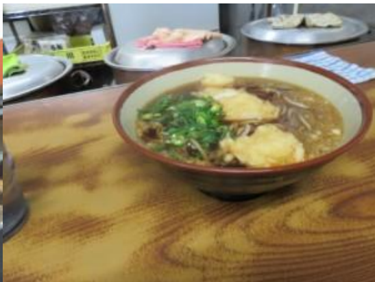
※めん太郎でランチ休憩