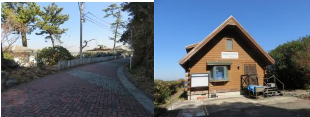
※初島港への路、初島海洋資料館