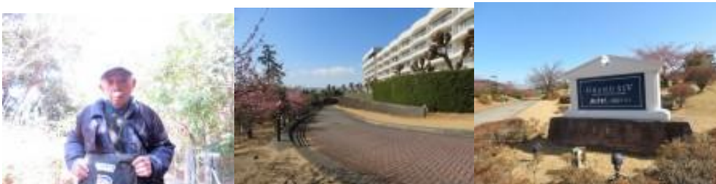
※初島 1 周への路