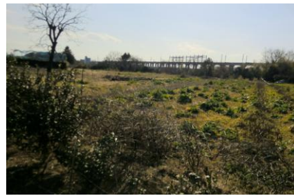
丸山駅 沼南駅への路