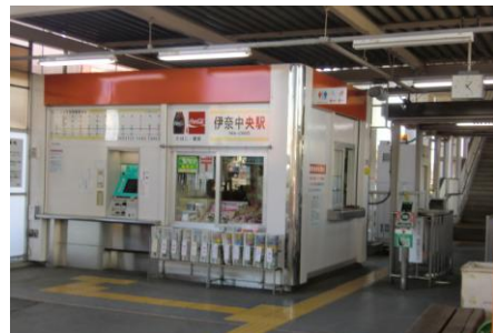
羽貫駅、伊那中央駅