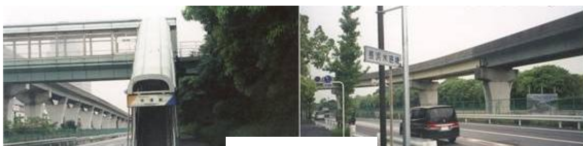
幸浦駅 長浜水路橋

富岡川先に並木中央駅（9時21分）があった。9時30分、幸浦（さちうら）二丁目の交差点に達する。この辺りから左手側が町並みとなる。357号線を歩く。ここでも金沢緑地が大通りを挟んで続く。9時26分、幸浦駅に到着。暫く行った先で、金沢緑地からシーサイドラインが大きく左にカーブする。近くに長浜水路橋（9時45分）があった。横浜金沢ハイテクセンターもあった。