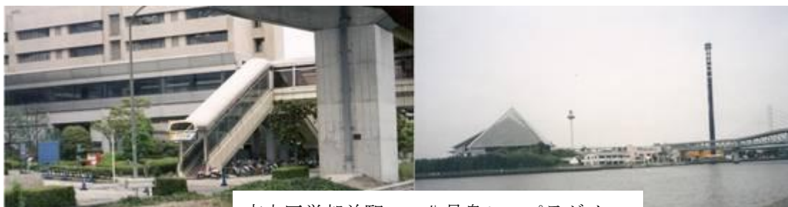
市大医学部前駅 八景島シーパラダイス

9時52分、産業振興センター駅に到着。この駅を過ぎるとシーサイドラインはまた大きくカーブを切る。10時2分、福浦駅に到着。その先につつじが見頃な電機団地前を通る。その先に市大医学部前駅（10時15分）があった。