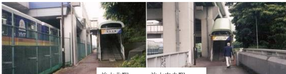
並木北駅 並木中央駅

9時11分、並木北駅に到着するや否や上り車両と対面する。本日は上り下りを入れると2～3分間隔でモノレールと対面したり追い越されたりする。また、新杉田駅から金沢八景の区間10.6Kmに両駅を含め14の駅があり、駅舎の写真撮影に神経を費やす。しかし、モノレールのため駅舎は簡単に識別できた。小雨はいつの間にか上がっていた。