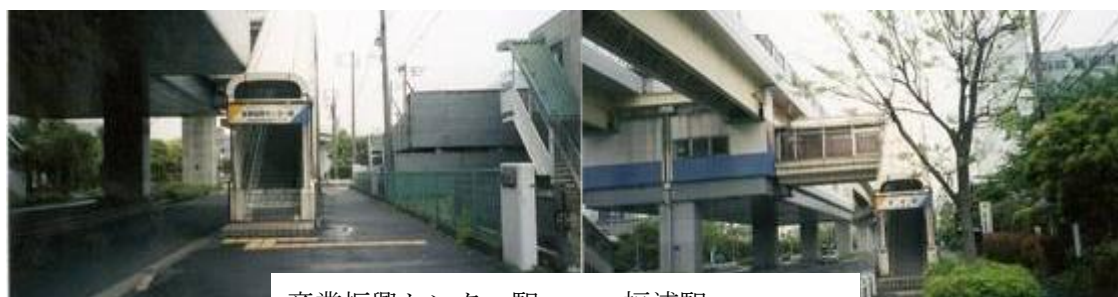
産業振興センター駅 福浦駅

富岡川先に並木中央駅（9時21分）があった。9時30分、幸浦（さちうら）二丁目の交差点に達する。この辺りから左手側が町並みとなる。357号線を歩く。ここでも金沢緑地が大通りを挟んで続く。9時26分、幸浦駅に到着。暫く行った先で、金沢緑地からシーサイドラインが大きく左にカーブする。近くに長浜水路橋（9時45分）があった。横浜金沢ハイテクセンターもあった。