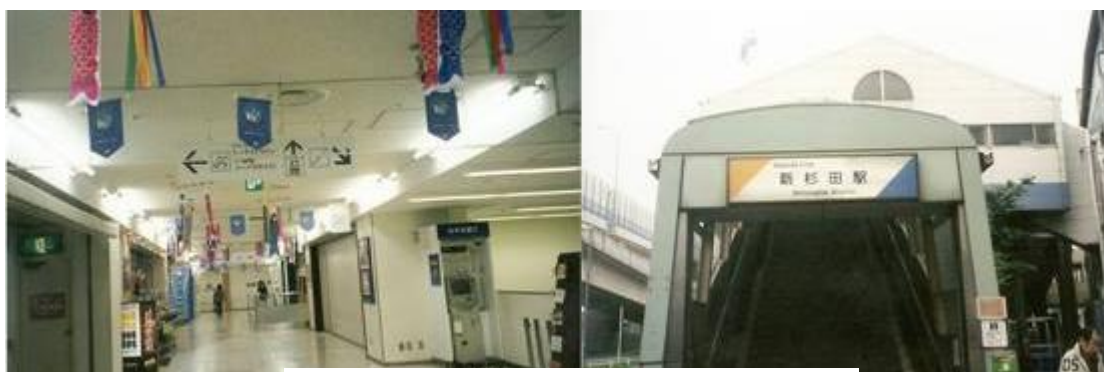
鯉のぼりのある通路 新杉田駅

第256回目のウォーキングは、平成21年5月5日(火)こどもの日に実施。本日は5連続休暇のうち、4日目である。昨日に比べ、本日は曇りのち雨の予報であったが、ウォーキングを実施する。新聞を余り見ておらず、本日晴れと少なくとも昨日までは思っていた。5時過ぎに起床し、自分が想定しない天気予報なので驚く。しかし、運良く午前中位は曇り空模様とのことで、どこか近場で歩くことにする。それで、急遽千葉方面のウォーキングを取りやめ、シーサイドライン(新杉田=金沢八景:10.6Km)にコース変更する。昨日は次男の車も出してもらい、好天の中長男家族と一緒に江ノ島水族館に出向く。連休のため2時位江ノ島水族館に行くのに要すが、孫との楽しい思い出がまたひとつできた。水族館内の魚の泳ぎに孫は見入っていた。また、14時15分から始まるは4人の女性によるミュージックつきイルカショーはとてもとかった。イルカが大きく水面から飛び上がったり、輪の中を潜ったり、正面のステージに現れ、我々を感動させてくれた。夕方は、地元の和風レストランとんでんで懇談会をする。