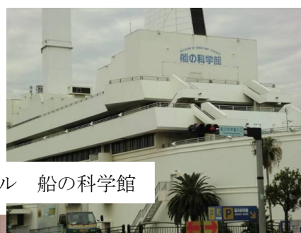
テレコムセンター駅前ビル 船の科学館