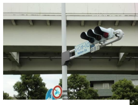
レインボー入口交差点からお台場海浜公園駅への位置