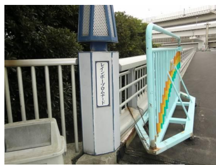
レインボープロムナード

レインボー入口（10時25分）にはガードマンの方がおられた。ゆりかもめに対し北と南の遊歩道があった。私は、北の進路を選択する。東京タワーや東京スカイツリーが見える方向と判断したからだ。選択大成功。北側の進路には多数の歩行者と対面する。東京湾の風景を見ながら進む。途中、中継的なビルが数箇所あった。