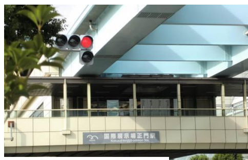
国際展示場正門駅

年金数理人会実務研修で何回か訪れたことのある国際展示場正門駅には8時56分到着。この駅の近くには東京湾が広がっており、潮の匂いを感じる。近くには有明客船ターミナルがあった。海岸に沿って、水の広場公園が広がっていた。9時8分、205歩ある「あけみ橋」を通過。大観覧車が直ぐ近くにある青海駅（あおみ）には9時16分到着。