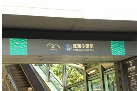
レインボープロムナード出口 芝浦ふ頭駅