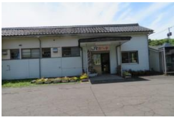
No44. 加斗駅 20210528 (金) 10:53