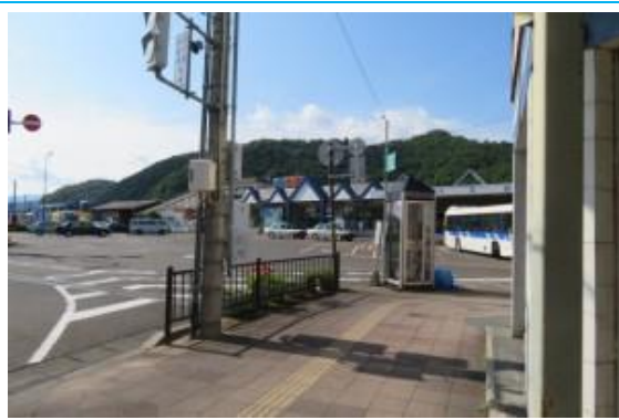
No46. 小浜駅 (おばま)