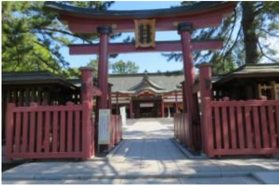
氣比神社 20210531 (月)