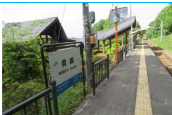
No39. 青郷駅 (あおのごう) 20210528 (金) 16:11