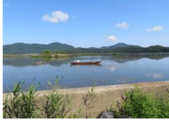
三方湖 20210530 (日)