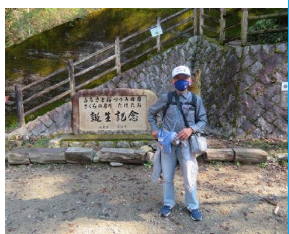
福知山線（旧線跡）歩き 20211115（月）