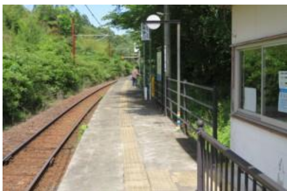
No45. 勢浜駅 20210528 (金) 9:43