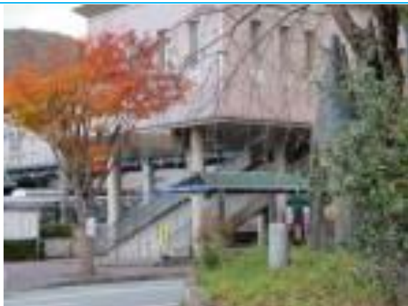
No10. 篠山口駅 (ささやまぐち)