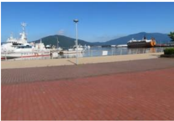
敦賀港 20210531 (月)