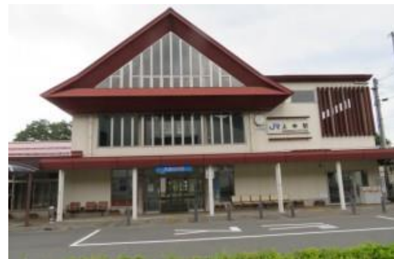
No49. 上中駅 20210429 (土) 11:45