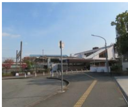
No28. 猪名寺駅 (いなでら) 20211116 (火) 12:33