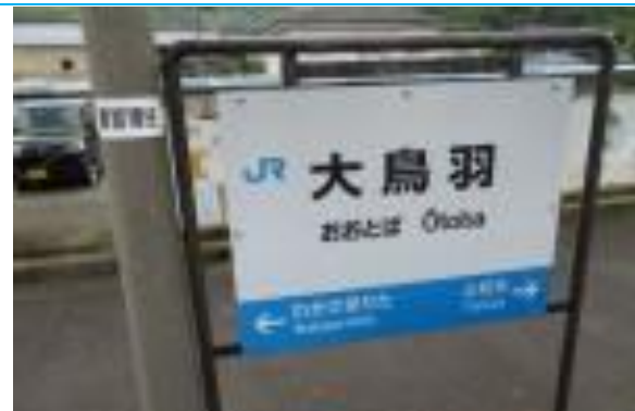
No51. 大鳥羽駅 20210429 (土) 13:37