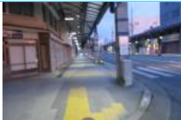
No37. 東舞鶴駅 (再掲) 20210528 (金) 19:17