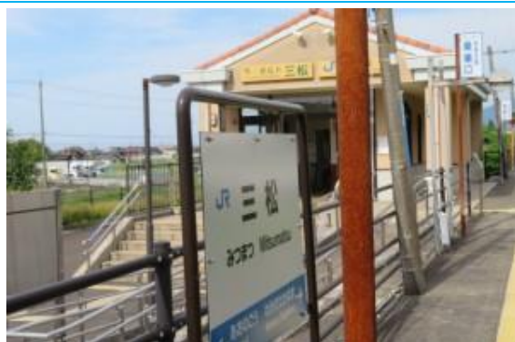
No40. 三松駅 (みつまつ) 20210528 (金) 15:36