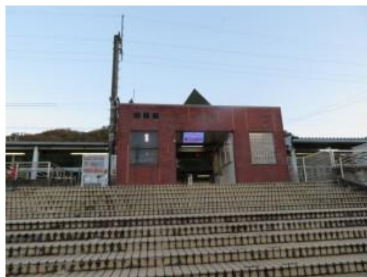
No19. 道場駅 (どうじょう)