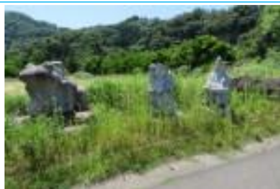
No57. 東美浜駅 20210530(日)13:45