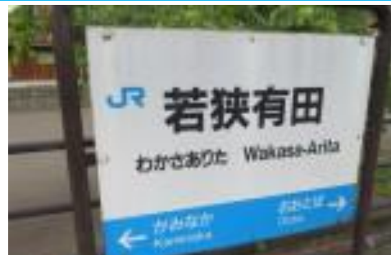
No50. 若狭有田駅 20210429 (土) 13:00