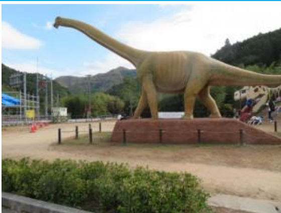
恐竜丹波竜化石発見地前 20211114 (日)