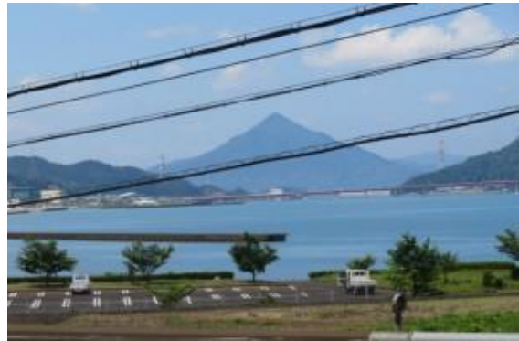
青葉山 (若狭本郷駅への路)