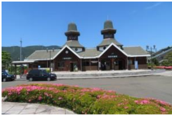
No43. 若狭本郷駅 20210528 (金) 12:28