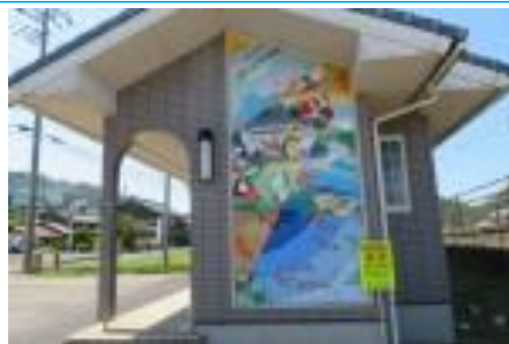
No55. 気山駅 20210530(日)10:05