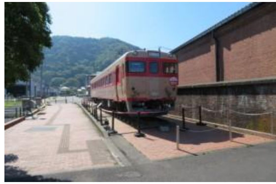
赤レンガ 20210531 (月)