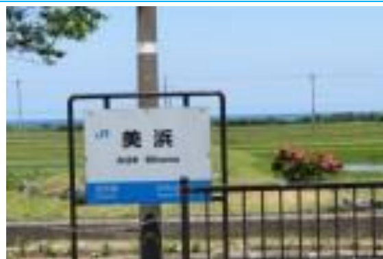
No56. 美浜駅 20210530(日)11:22