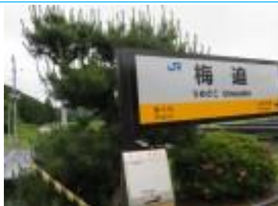
No33. 梅迫駅 (うめざこ)