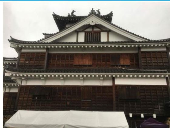
福知山城鑑賞 20210321 (日)