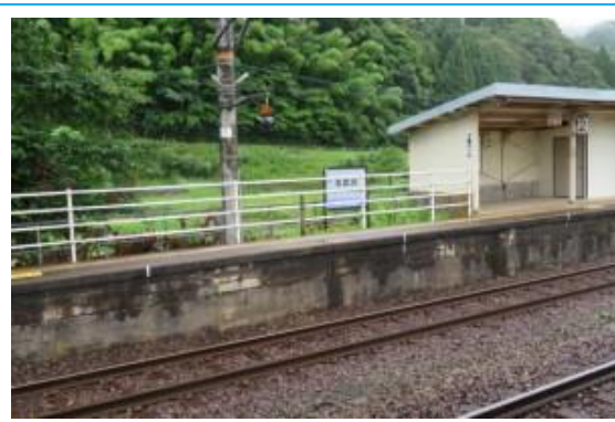
No40. 玄武洞駅 20210705 (月) 14:23