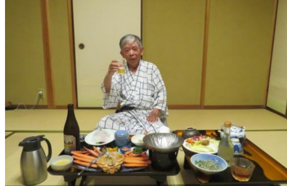
城崎温泉（しのめ荘）