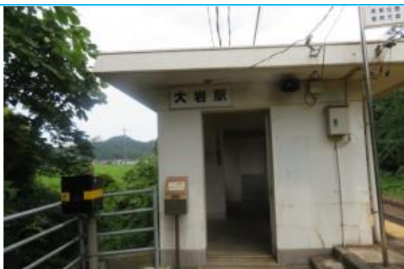
No54. 大岩駅 20210703 (土) 13:48