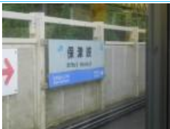
No9. 保津峡駅 20160925（日）9:09 車窓より