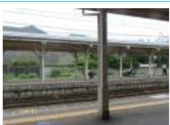
No36. 八鹿駅 (ようか)