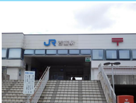
No15. 吉富駅 20150927 (日) 9:43