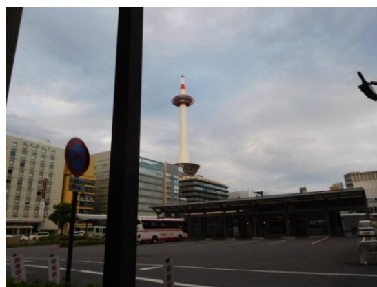
遠くに京都タワー