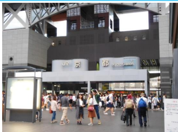
No1. 京都駅 20160925 (日) 17:06