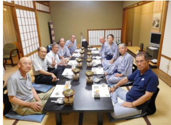
第7回 立命館大学工学部数物同窓会（1973年卒）