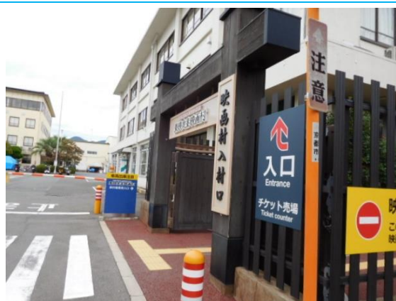
映画村入村口前 (花園駅への路)