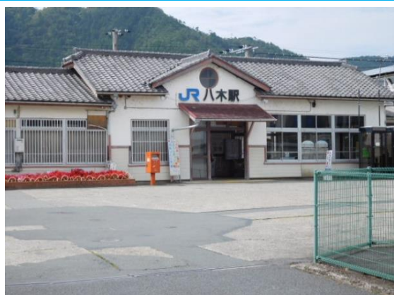
No14. 八木駅 20150927 (日) 10:47