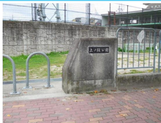
上ノ段公園（大学時代下宿していた界限）