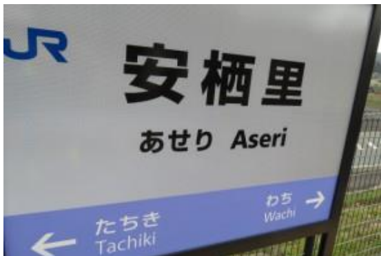
No23. 安栖里駅 (あせり)