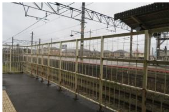
No28. 石原駅 (いさ) 2021321 (日) 13:43