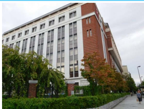
立命館朱雀キャンパス (二条駅界限)