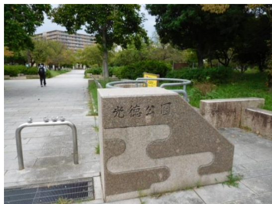
光徳公園 (丹波口駅への路) 16:28