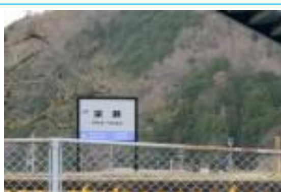
No33. 梁瀬駅 (やなせ) 20210320(土) 11:43