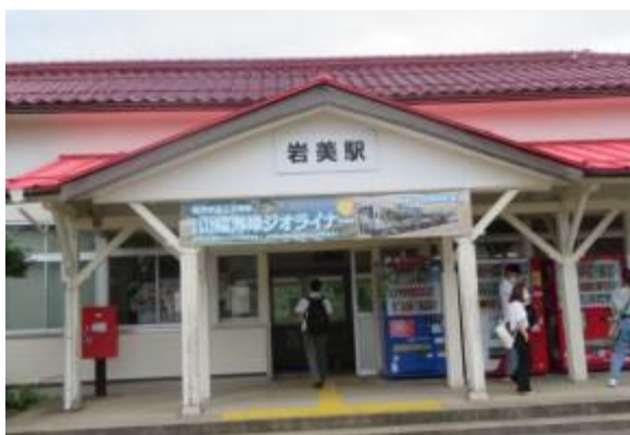
No53. 岩美駅 20210703 (土) 12:16