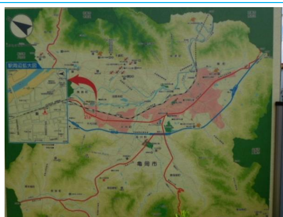
保津峡駅界限の地図 （道路なしのため立ち寄り不可能）