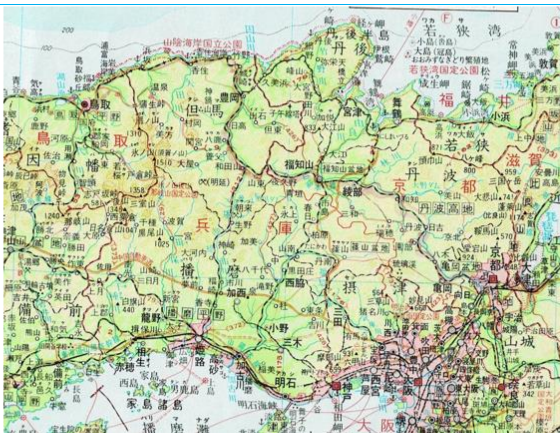
山陰本線（京都～鳥取）