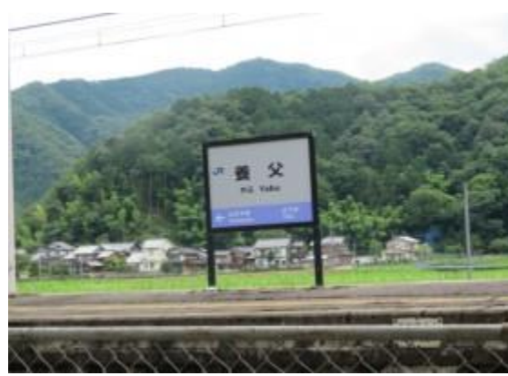
No35. 養父駅 (やぶ)