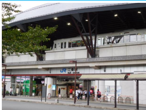
No4. 二条駅 20160925 (日) 15:59