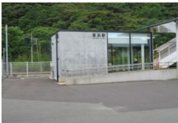
No52. 東浜駅 20210703 (土) 10:53