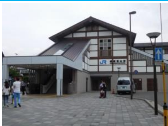
No8. 嵯峨嵐山駅 20160925（日）13:50