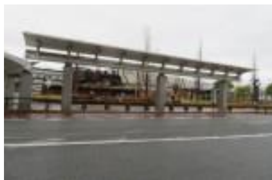
No29. 福知山駅 2021321 (日) 11:28