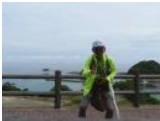
七坂八峠古道 (東浜駅への路)