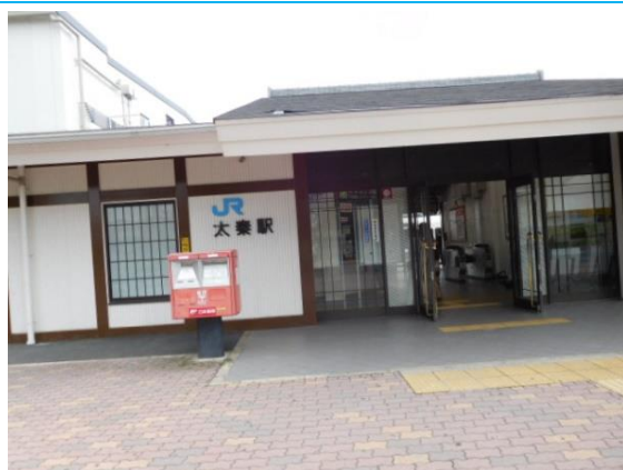
No7. 太秦駅（うずまさ） 20160925（日）14:31