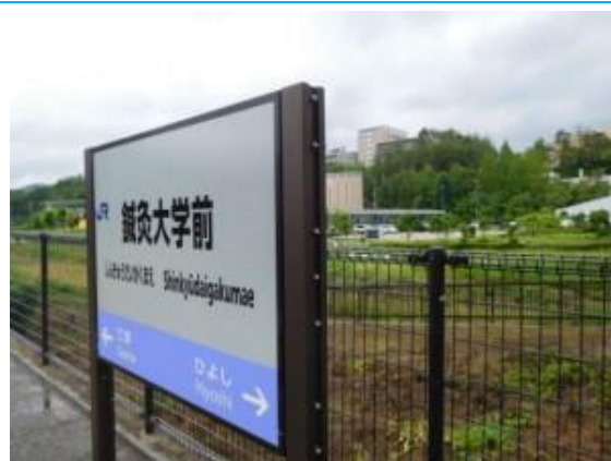
No19. 鍼灸大学前駅（しんきゅう） 20190630（日）14:18