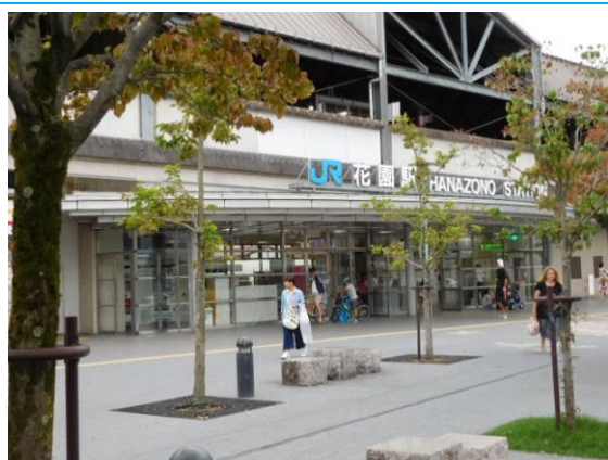
No6. 花園駅 20160925 (日) 15:06