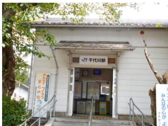
No13. 千代川駅 20150927 (日) 11:37