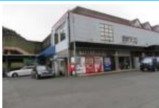
No31. 下夜久野駅 (しもさくの) 20210320(土) 15:33