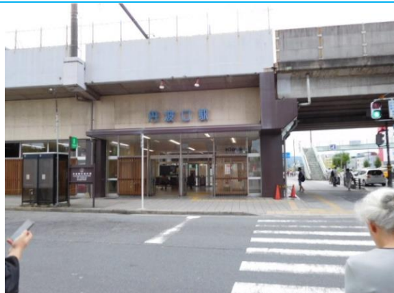
No3. 丹波口駅 20160925 (日) 16:32