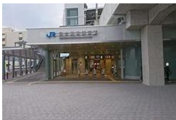
No2. 梅小路京都西駅 2019年3月16日開業駅