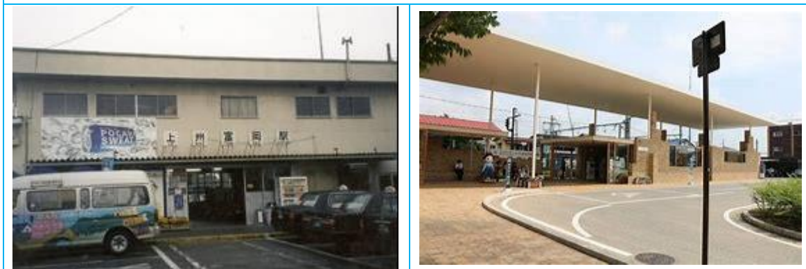
No74. 上州富岡駅 20080505 (月) 14:40