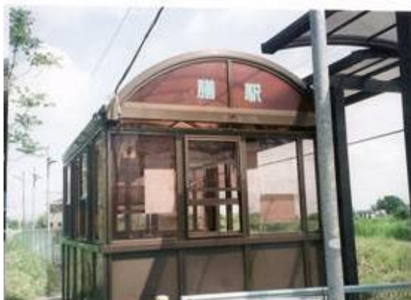
No47. 膳駅 20080504 (日) 14:05