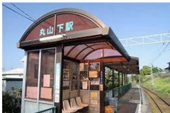
No39. 丸山下駅 20080504 (日)