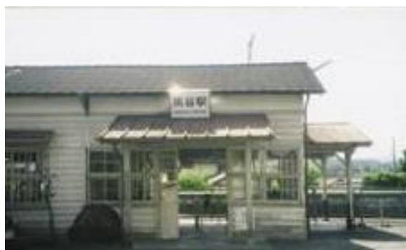
No27. 皆野駅 20050521 (土) 13:405