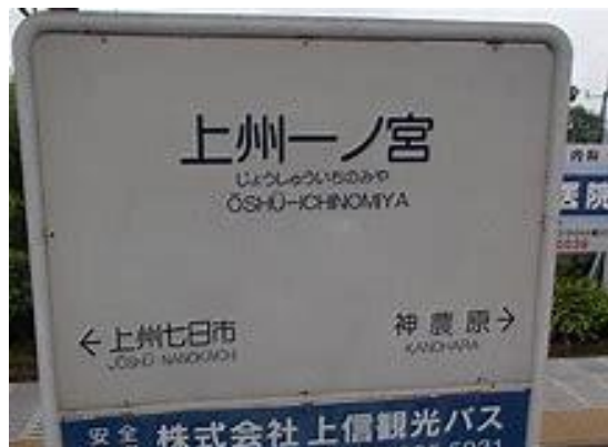
No77. 上州一ノ宮駅 20080505 (月) 13:32