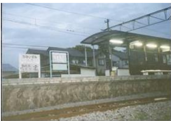
No56. 上泉駅 20080504 (日) 18:45