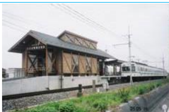
No12. ひろせ野鳥の森駅 20050514 (土) 14:04