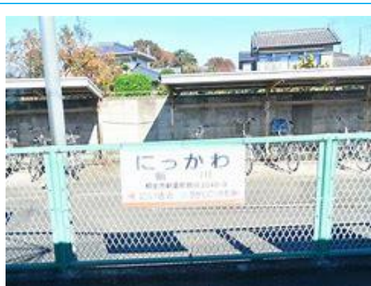
No45. 新川駅(にっかわ) 20080504 (日) 13:04