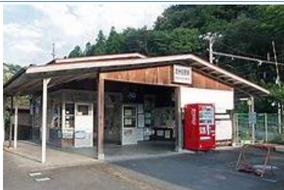
No35. 武州日野駅 20050604 (土) 12:15