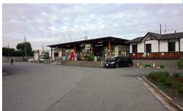
No5. 東行田駅 20050514 (土) 10:32