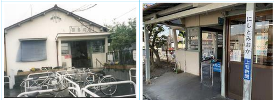
No75. 西富岡駅 20080505 (月) 14:20