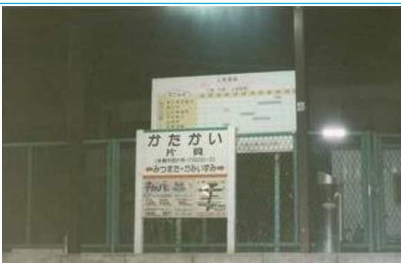
No57. 片貝駅 20080504 (日) 19:02