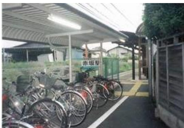
No55. 赤坂駅 20080504 (日) 18:15