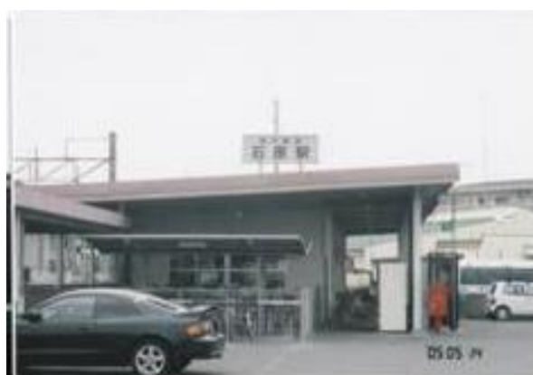
No11. 石原駅 20050514 (土) 13:33