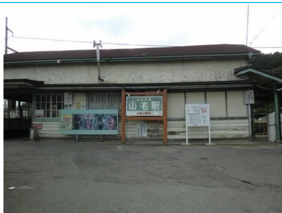
No66. 山名駅 20110827 (土) 16:03