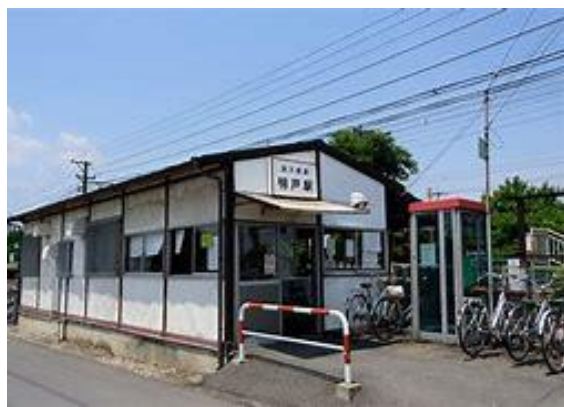
No14. 明戸駅 (あけと) 20050514 (土) 15:25