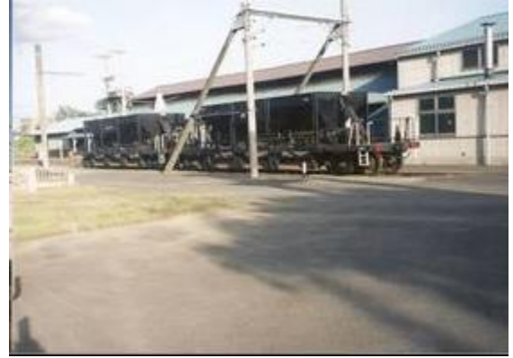
No52. 大胡駅 20080504 (日) 16:46