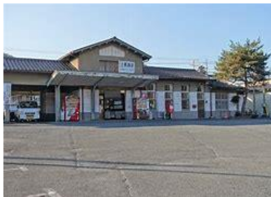
No25. 上長瀨駅 20050521 (土) 未踏破