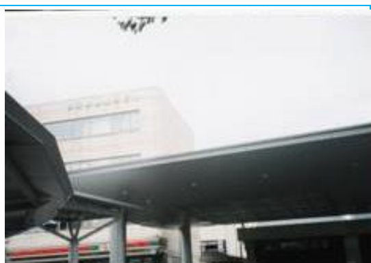
Np9. 熊谷駅 20050514 (土) 13:00