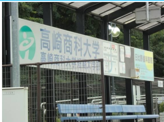
No65. 高崎商科大学前駅 20110827 (土) 16:36