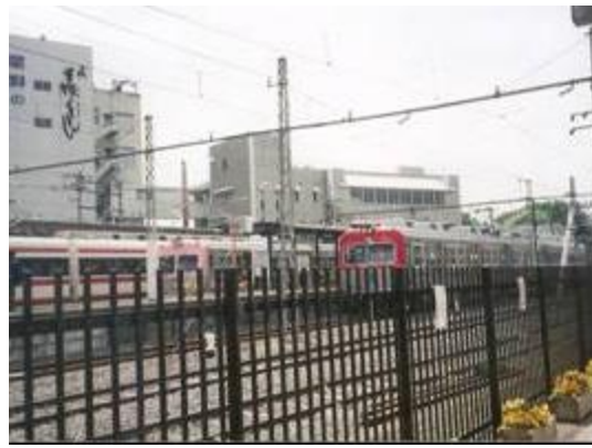
No43. 赤城駅 20080504 (日) 11:58