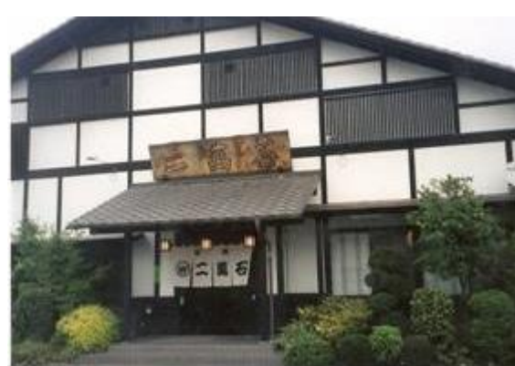
No78. 神農原駅 (かのほら) 20080505 (月) 12:47