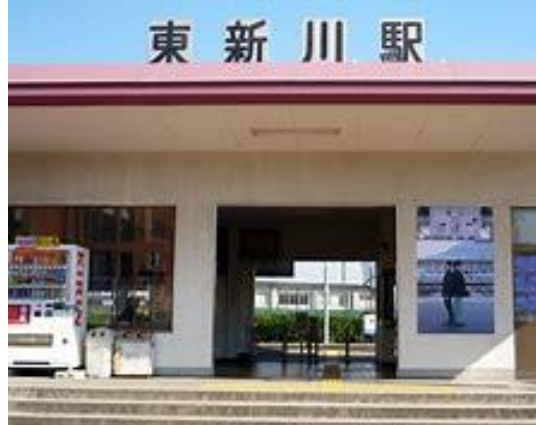
No44. 東新川駅 20080504 (日) 12:33