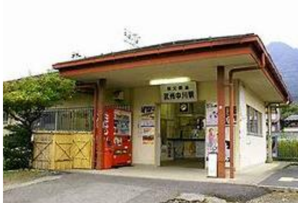
No34. 武州中川駅 20050604 (土) 13:05