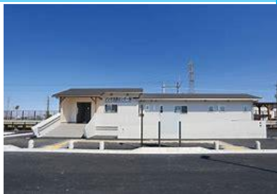
No8. ソシオ流通センター駅 20050514 (土) 新設駅