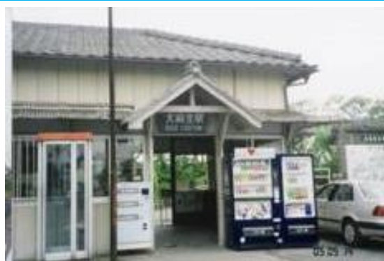
No13. 大森生駅 20050514 (土) 14:35