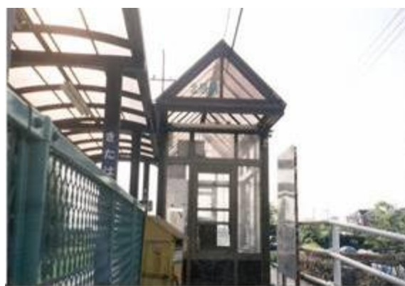
No50. 北原駅 20080504 (日) 15:42