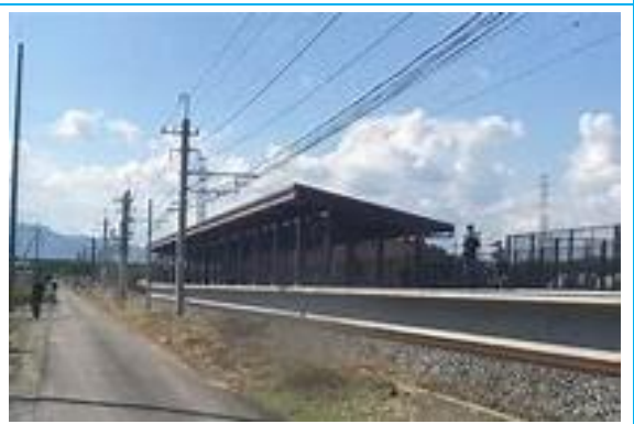
No17. ふかせ花園駅 20050514 (土) 新設駅 ネットより