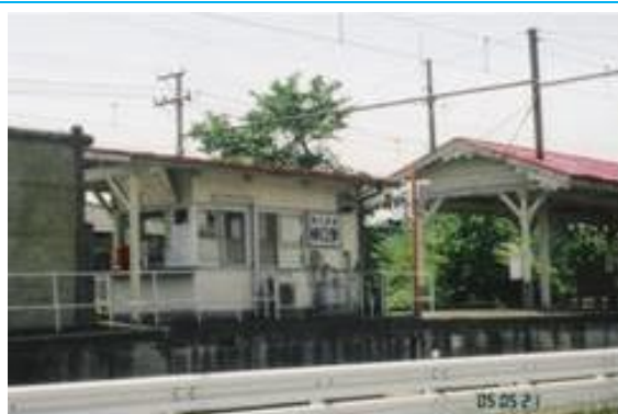
No22. 樋口駅 20050521 (土) 10:32