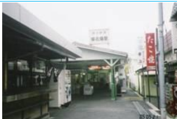
No31. 御花畑駅 20050521 (土) 16:50 20050604 (土) 立ち寄らず