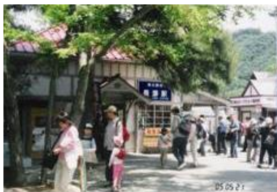
No24. 長瀨駅 (ながとろ) 20050521 (土) 11:50