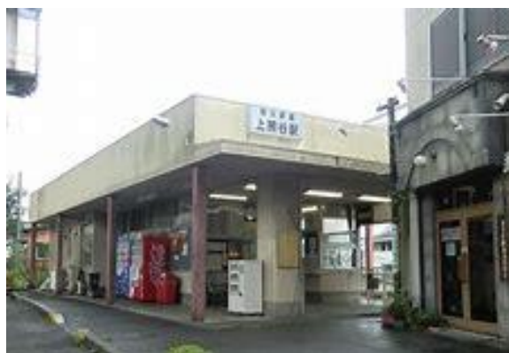
No10. 上熊谷駅 20050514 (土) 13:15