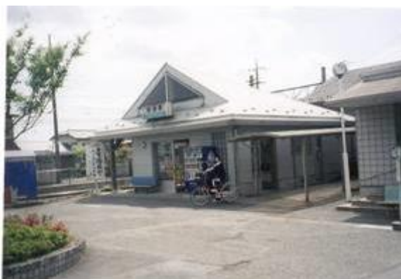
No46. 新里駅 20080504 (日) 13:36