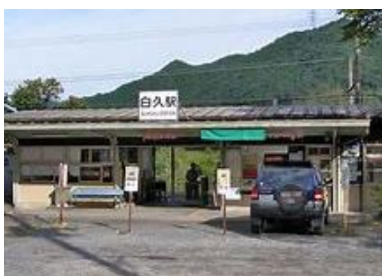
No36. 白久駅 20050604 (土) 11:25