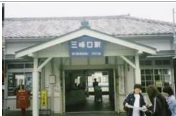
No37. 三峰口駅 20050604 (土) 10:52