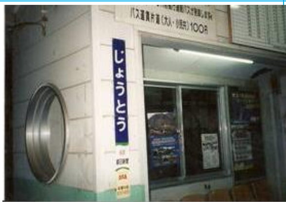
No59. 城東駅 20080504 (日) 19:31