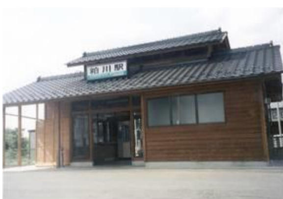
No48. 粕川駅 20080504 (日) 14:23