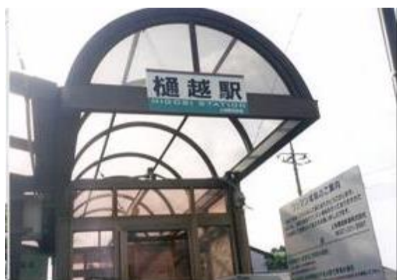
No51. 樋越駅 20080504 (日) 16:03