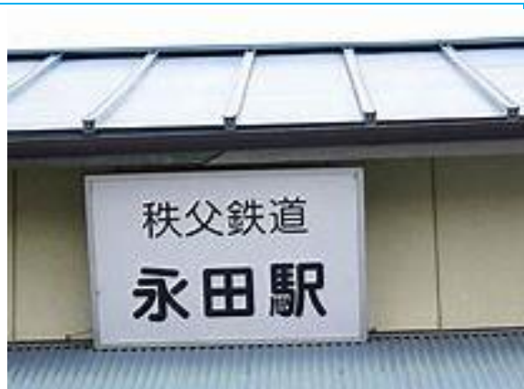
No16. 永田駅 20050514 (土) 16:37