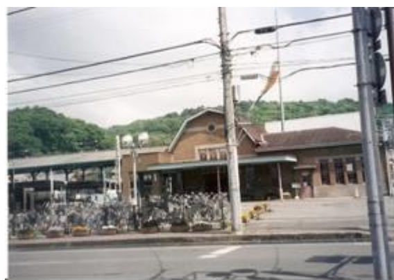
No38. 西桐生駅 20080504 (日) 9:30