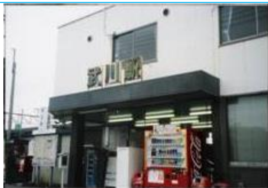
No15. 武川駅 20050514 (土) 15:58