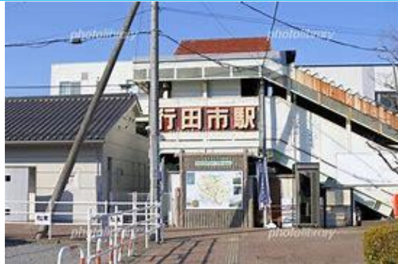
No6. 行田市駅 20050514 (土) 10:55