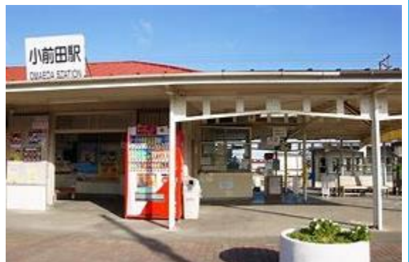
No18. 小前田駅 (おまえだ) 20050514 (土) 17:37