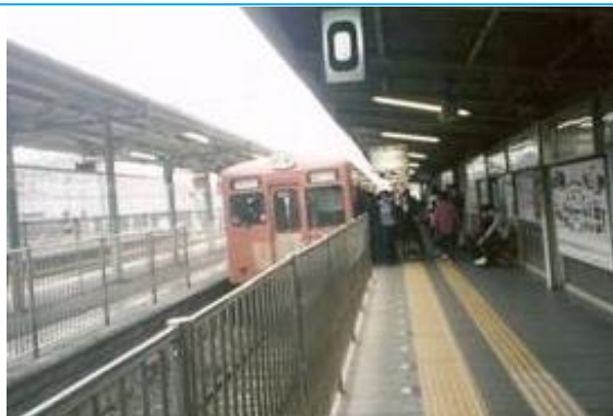
No61. 高崎駅 20110827 (土) 18:57