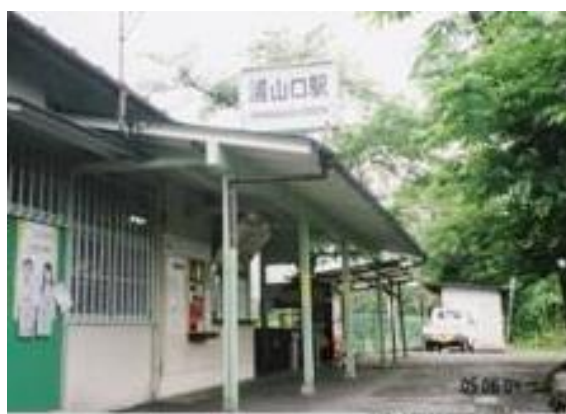
No33. 浦山口駅 20050604 (土) 13:45