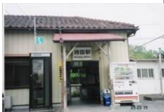
No7. 持田駅 20050514 (土) 11:25