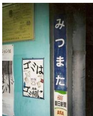
No58. 三俣駅 20080504 (日) 19:18