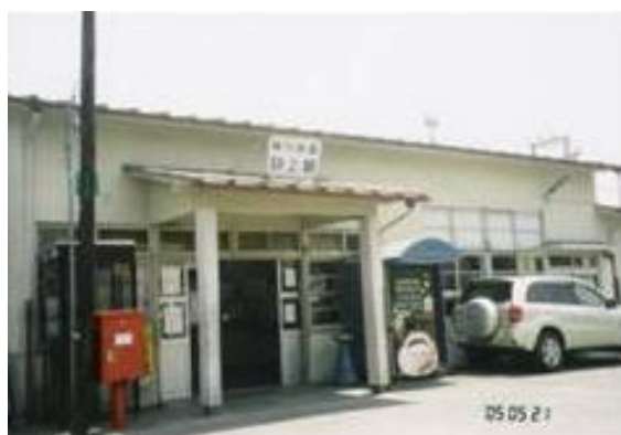
No23. 野上駅 20050521 (土) 11:15