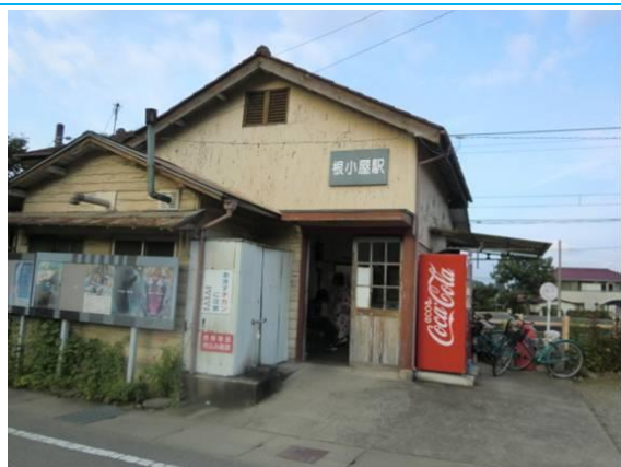
No64. 根小屋駅 20110827 (土) 17:00