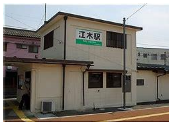
No53. 江木駅 20080504 (日) 17:32