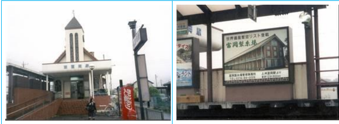
No73. 東富岡駅 20080505 (月) 15:02