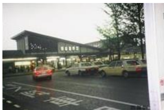
豪雨のため、御花畑駅には立ち寄らず 西武秩父駅で代用 14:55