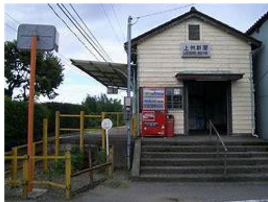
No71. 上州新屋駅 (にいや)