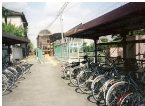
No49. 新屋駅 20080504 (日) 15:08