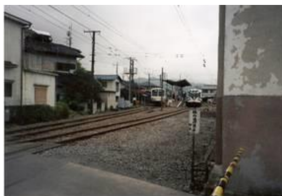
No79. 南蛇井駅 20080505 (月) 11:22