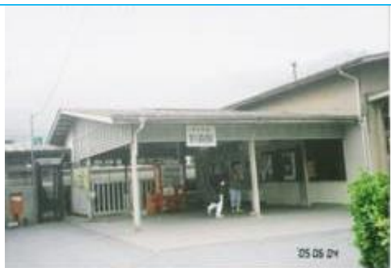
No32. 影森駅 20050604 (土) 14:20