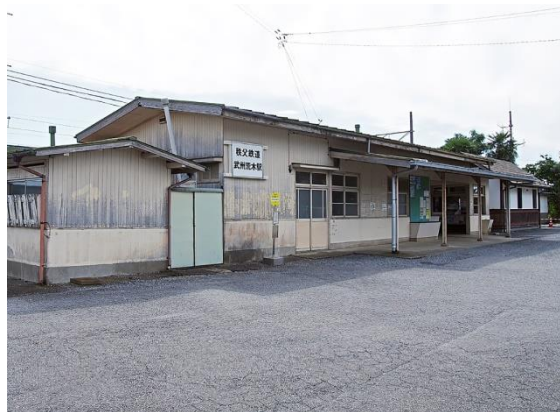
No4. 武州荒木駅 20050514 (土) 9:40