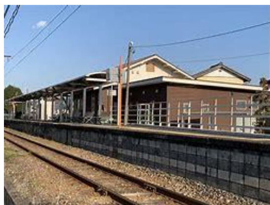
No76. 上州七日市駅 20080505 (月) 13:57