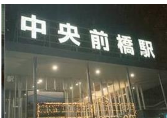
No60. 中央前橋駅 20080504 (日) 20:05