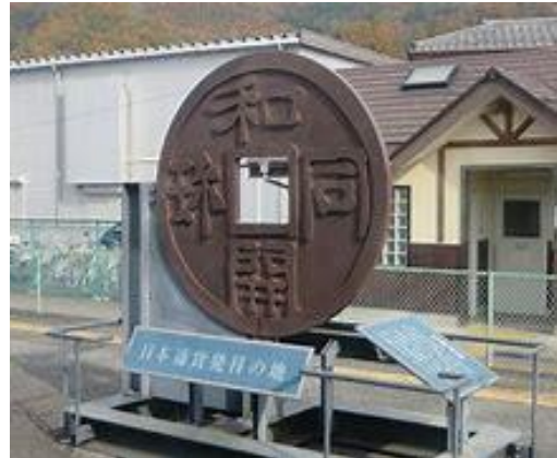
No28. 和銅黒谷駅(黒谷駅から変更?)