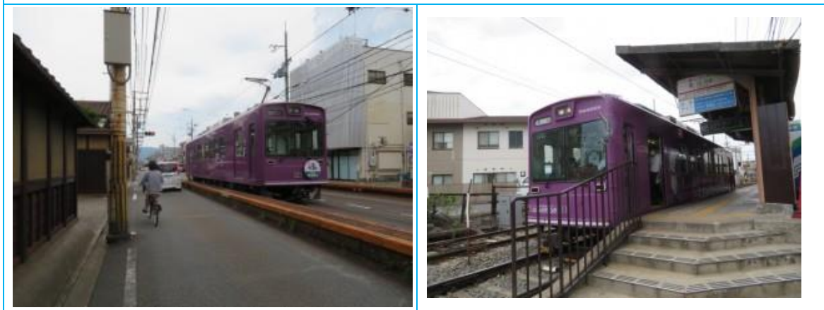
No57. 山ノ内駅 20220625（土）14:16 & 14:42