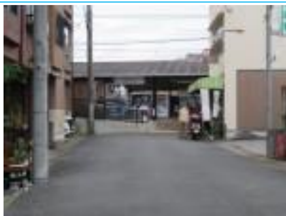
No69. 鳴滝駅 20220625 (土) 11:16