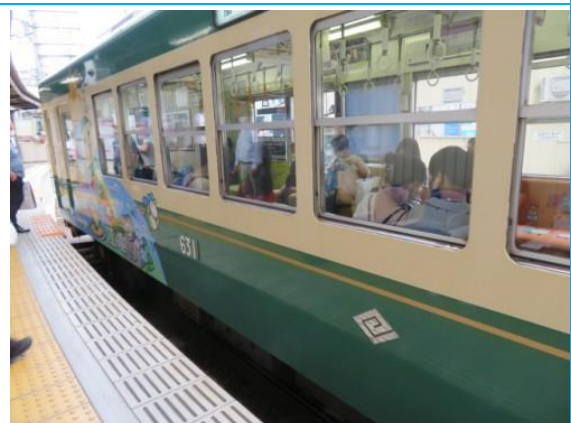
1973年頃の嵐電イメージ