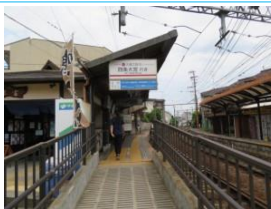
No60. 太秦広隆寺駅 (うずまさ) 20220625 (土) 13:41