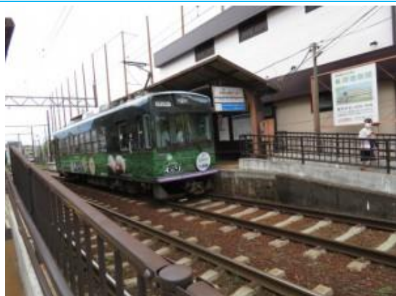
No68. 常盤駅 20220625 (土) 11:07