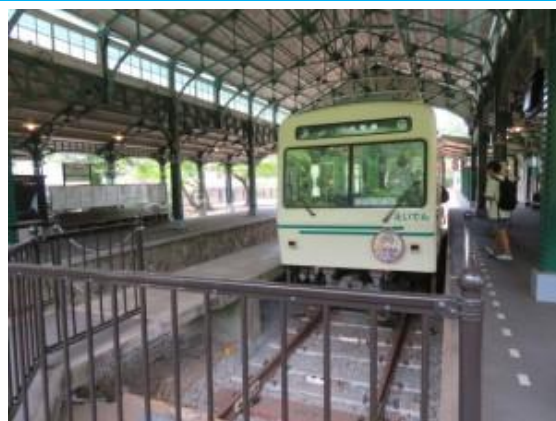
No83. 八瀬比叡山山口駅