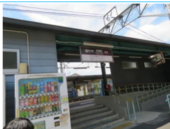
No86. 岩倉駅 20220626 (日) 10:33