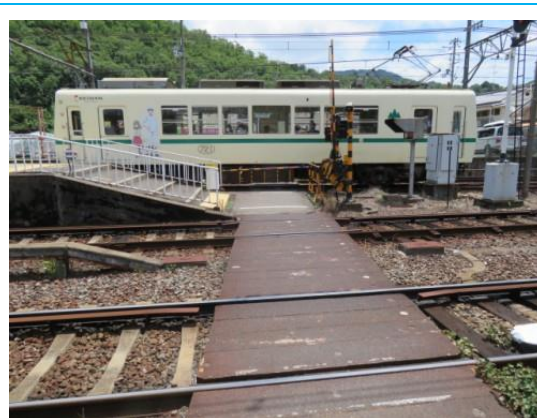
No84. 宝ヶ池駅 (再掲) 20220626 (日) 11:16