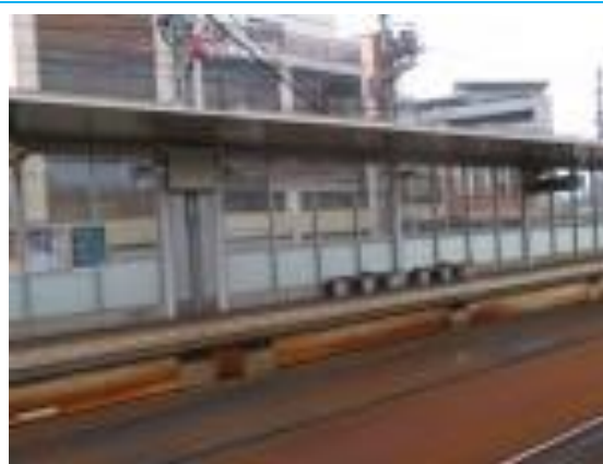
No58. 嵐電天神川駅 20220625 (土) 13:59