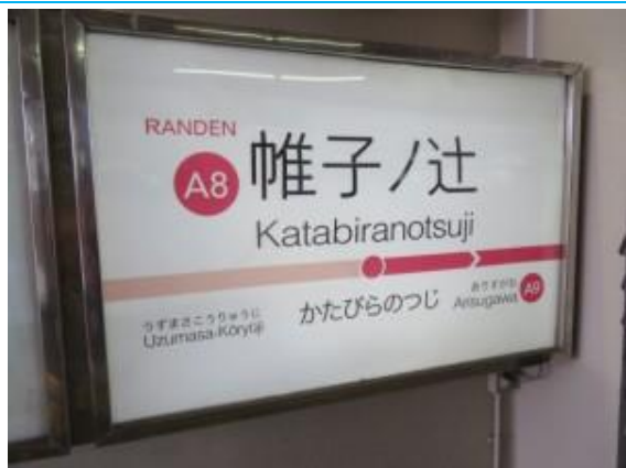
No67. 帷子ノ辻駅 (再掲) 20220625 (土) 10:46