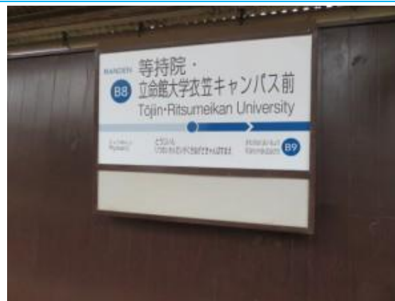
No74. 等持院・立命館大学衣笠キャンパス駅