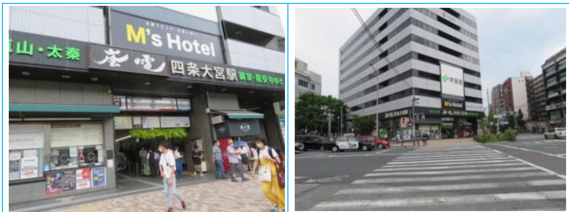
No55. 四条大宮駅 20220625（土）15:32