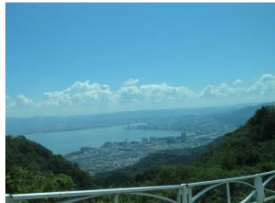
比叡山からの琵琶湖