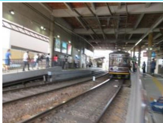
No61. 帷子ノ辻駅 (かたびら) 20220625 (土) 10:46 & 13:26