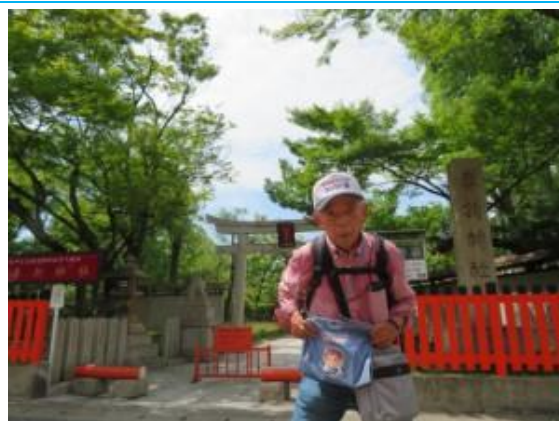
No63. 車折神社駅 (くるまごき) 20220625 (土) 10:10