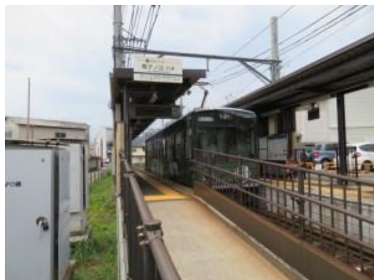
No67B. 撮影所前 20220625 (土) 10:53