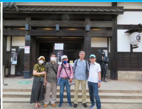
からくり忍者屋敷前