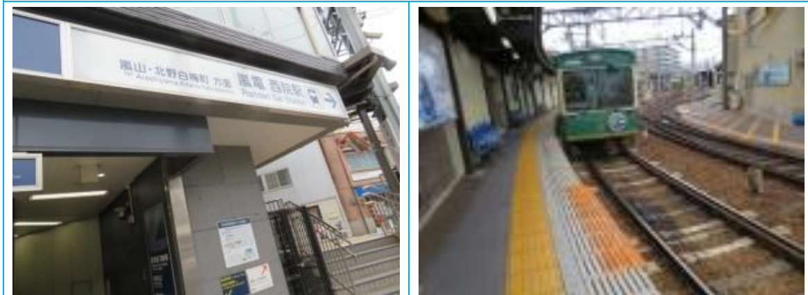
No56. 西院駅（さいいん） 20220625（土）15:08