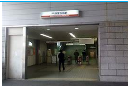
No6. 岸里玉出駅 20120511 (金) 18:33