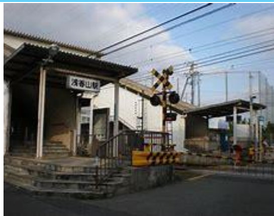
No11. 浅香山駅 20120511 (金) 未踏破