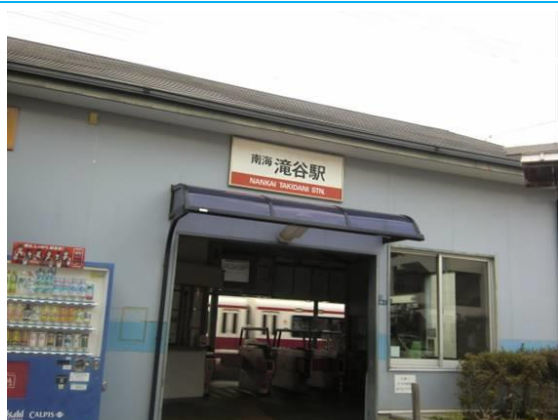
No23. 滝谷駅 20110912 (月) 15:28