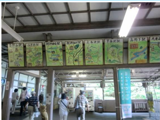
No42. 極楽橋駅 (乗り鉄)