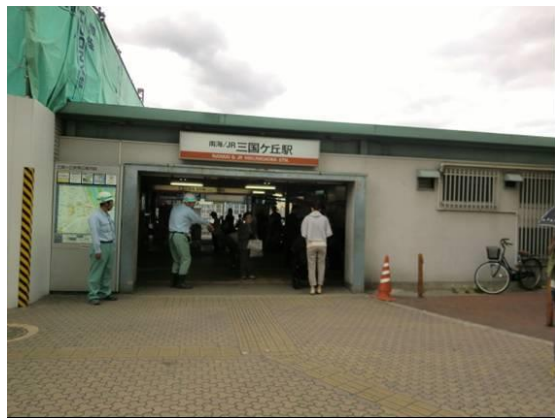
No13. 三国ヶ丘駅 20120511 (金) 13:27