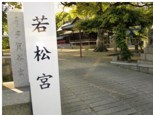
若宮宮 (沢ノ町駅の路)