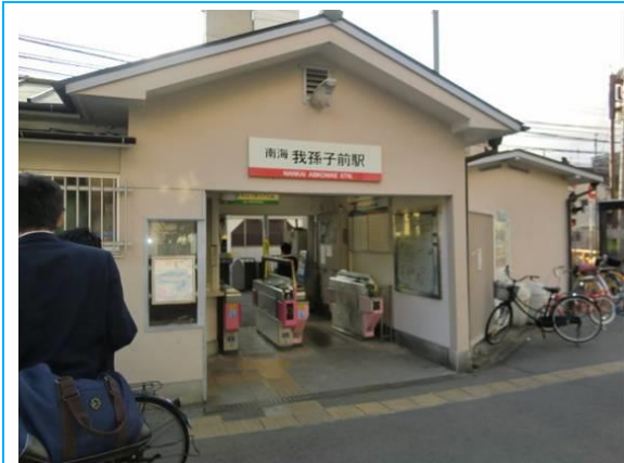
No10. 我孫子前駅 20120511 (金) 17:17