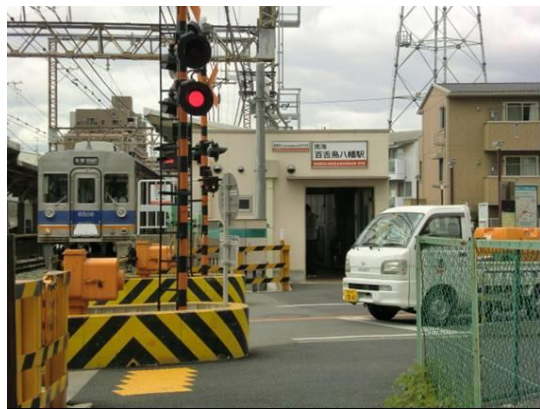
No14. 百舌鳥八幡駅 20120511 (金) 13:08