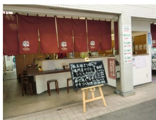
No17. 初芝駅 20120511 (金) 11:44