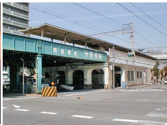
No2. 今宮戎駅(いまみやえびす)