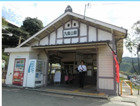
No36. 九度山駅 20110911 (日) 14:39