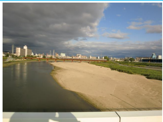
我孫子前駅への路