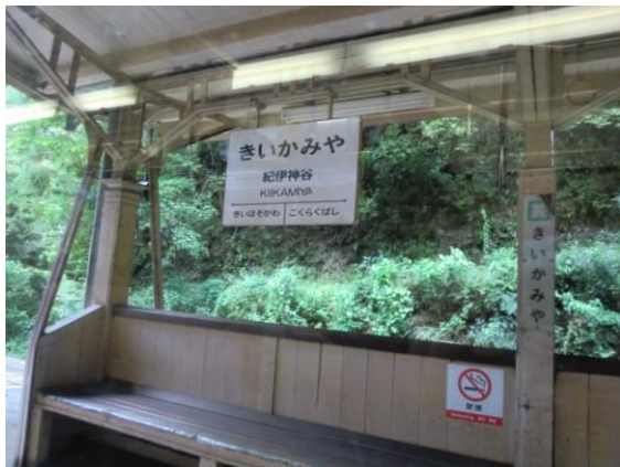
No41. 紀伊神谷駅 (乗り鉄) 車窓より