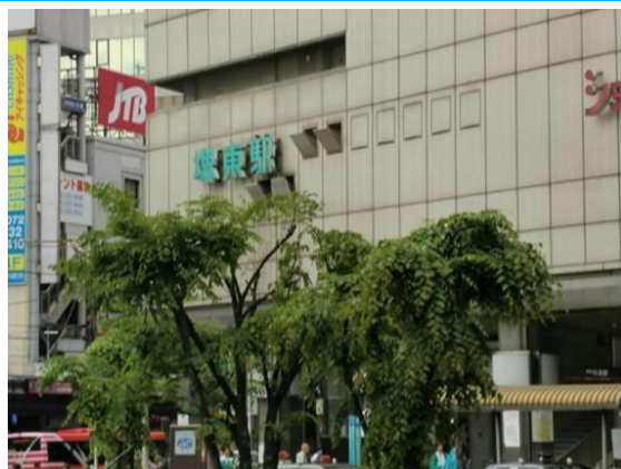
No12. 堺東駅 20120511 (金) 13:58