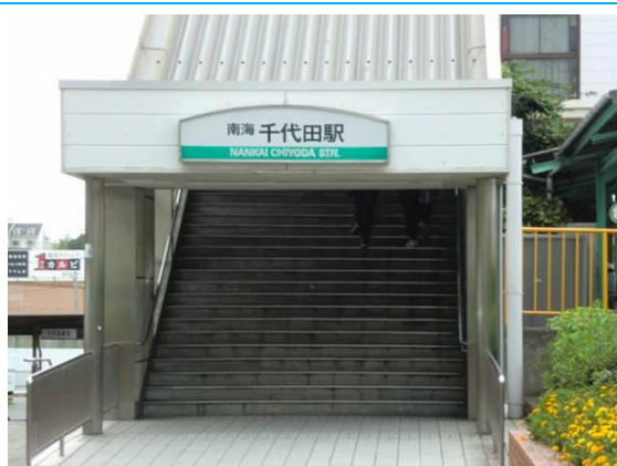
No24. 千代田駅 20110912 (月) 15:02