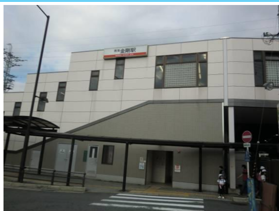
No22. 金剛駅 20110912 (月) 16:01