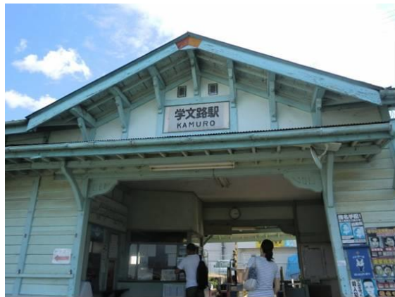
No35. 学文路駅 (かむろ) 20110911 (日) 15:14