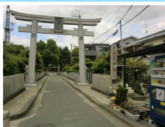
No18. 萩原天神駅 20120511 (金) 11:18