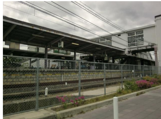
No16. 白鷺駅 20120511 (金) 12:35