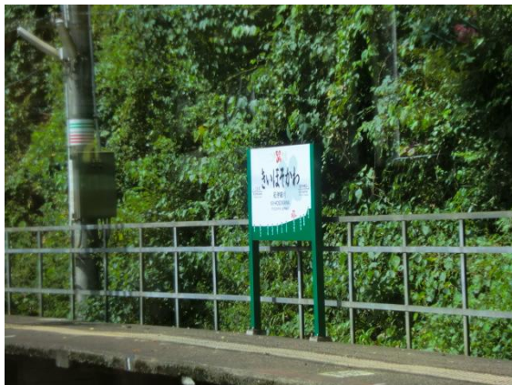
No40. 紀伊細川駅 (乗り鉄) 車窓より