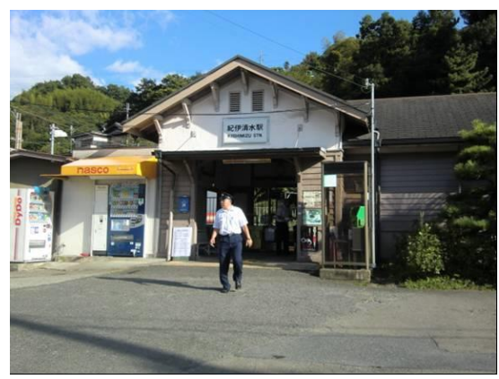
No34. 紀伊清水駅 20110911 (日) 15:57