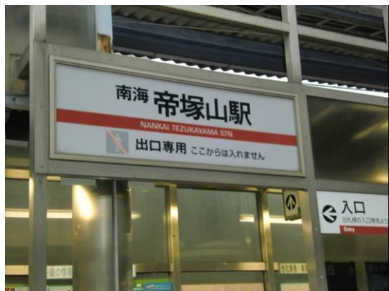
No7. 帝塚山駅 20120511 (金) 18:11