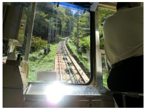
高野山駅～極楽寺駅の風景