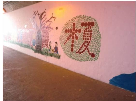
榎元町通路(三国ヶ丘駅界限)