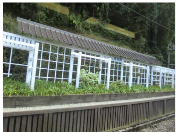
高野山駅～極楽寺駅の風景