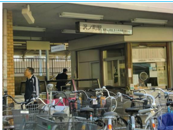
Np9. 沢ノ町駅 20120511 (金) 17:30