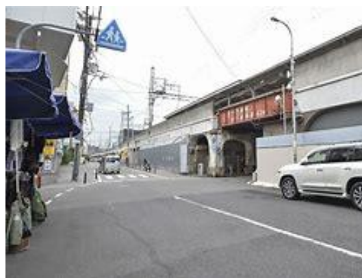
No4. 萩ノ茶屋駅 ネットより 20120511 (金)