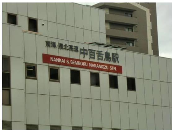
No15. 中百舌鳥駅 20120511 (金) 12:50