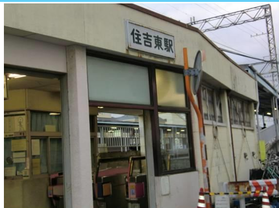
No8. 住吉東駅 20120511 (金) 17:51