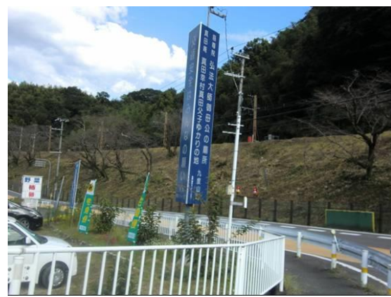
学文路駅への路 九度山=真田幸村・真田父子ゆかりの地 14:50