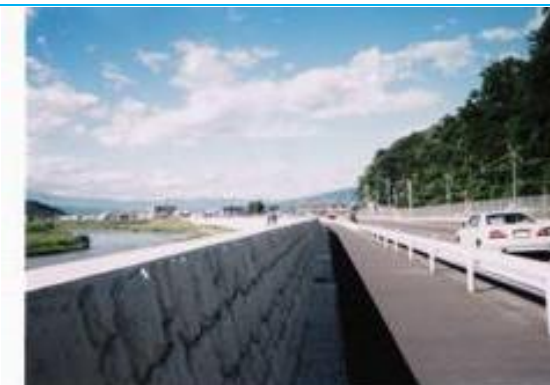
遠くに雲がかかった富士山 (伊豆長岡駅への路)