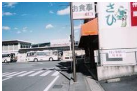
No30. 伊豆長岡駅 20061007 (土) 14:40