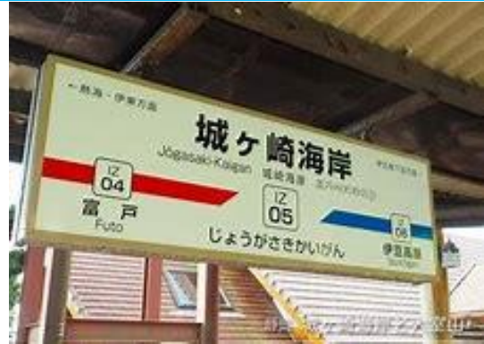
No10. 城ヶ崎海岸駅 20060211 (土) ネットより