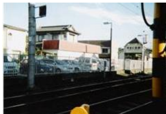
No27. 伊豆仁田駅 20061007 (土) 16:00