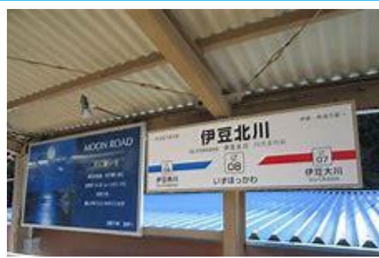
No13. 伊豆北川駅 20060211 (土) ネットより