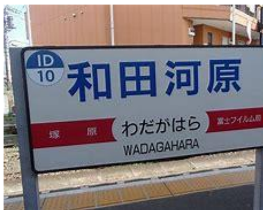
No44. 和田河原駅 20060909 (土)