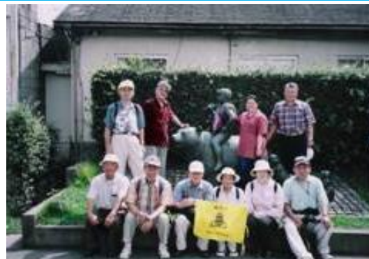
No46. 大雄山駅 20060909 (土) 10:30 第 23 回わいわい会 (大雄山～小田原)