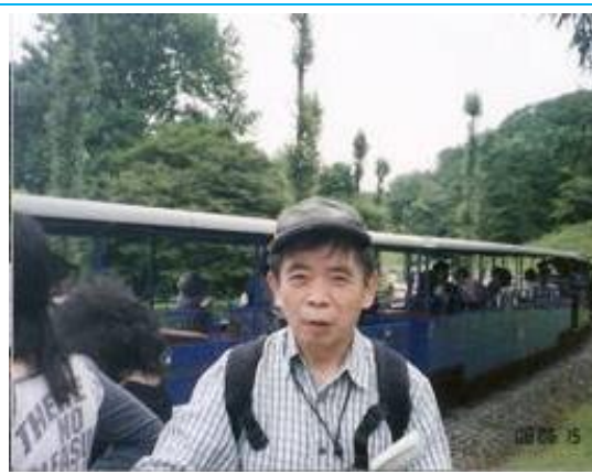
虹の郷 ロムニー鉄道前