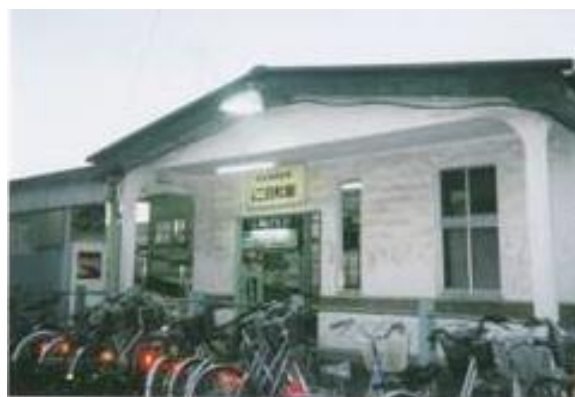
No25. 三島二日町駅 20061007 (土) 17:15