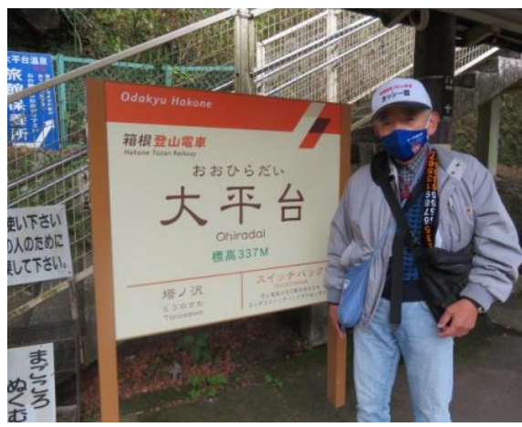
20220110 (月) 11:00