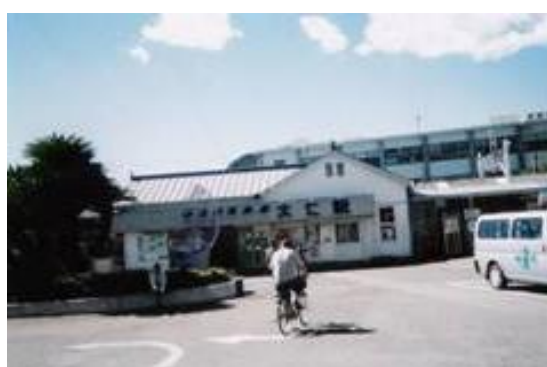
No32. 大仁駅 20061007 (土) 12:50