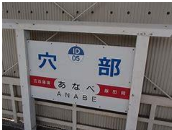
No39. 穴部駅 20060909 (土) 15:00 ネットより