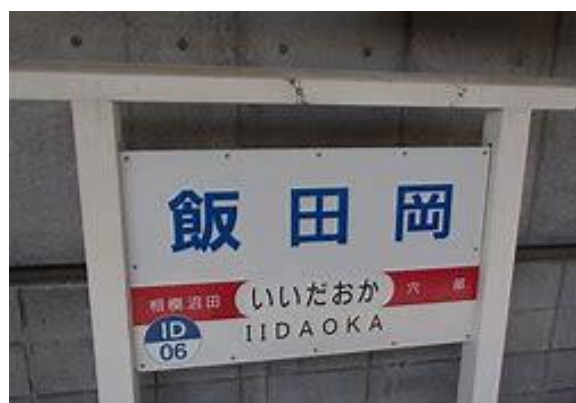
No40. 飯田岡駅 20060909 (土)