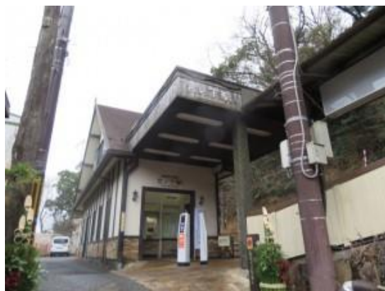
No54. 宮ノ下駅 20020921 (土) 20220110 (月) 10:20