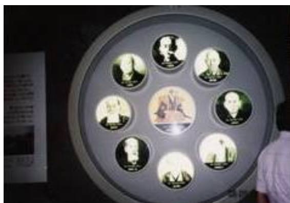
二宮 尊徳館 20060909 (土) 12:00