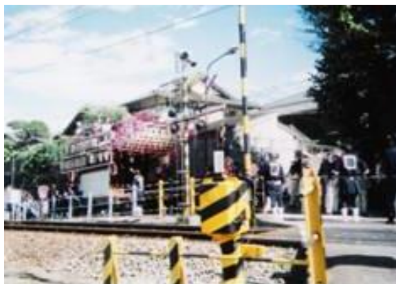
礼大祭 (田京駅への路) 13:15