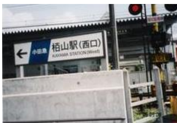
小田急栢山駅 20060909 (土) 11:40