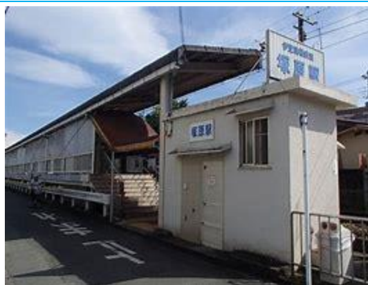
No43. 塚原駅 20060909 (土) ネットより