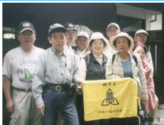
修善寺温泉”指月荘”前