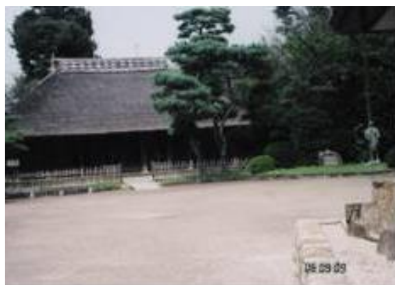
二宮 尊徳生家 20060909 (土) 12:00