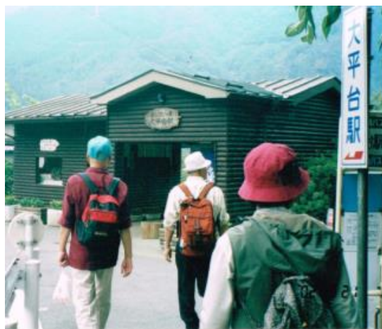
No53. 大平台駅 20020921 (土) 到着時刻記載なし