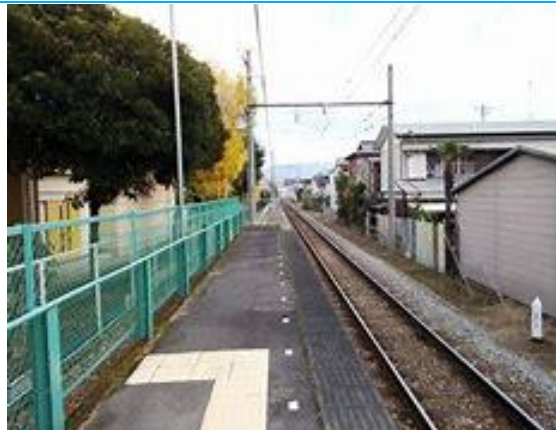
No37. 井細田駅 20060909 (土) ネットより