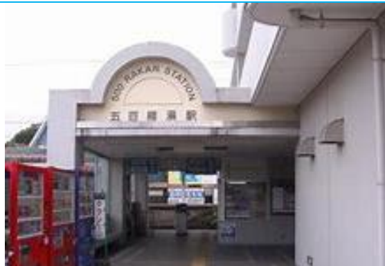
No38. 五百羅漢駅 20060909 (土) 15:15