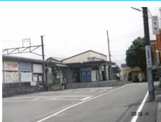
No29. 菰山駅 20061007 (土) 未踏破 20080614 (土) 12:00