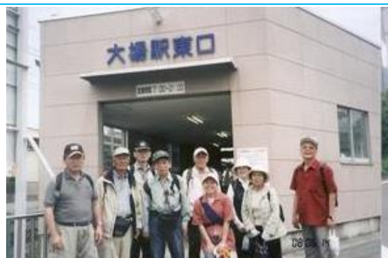
第30回わいわい会 20080614 (土) 10:40