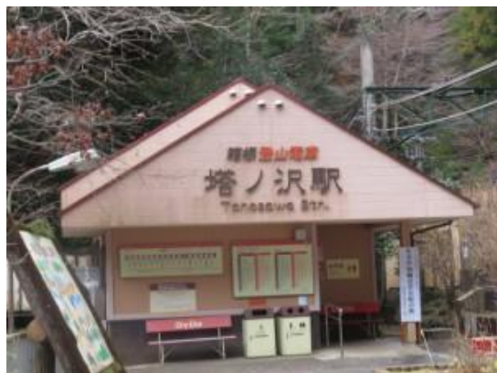
No52. 塔ノ沢駅 20020921 (土) / 20220110 (月) 12:10