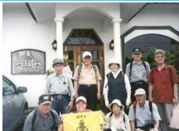
第30回わいわい会 ひよしや (ランチ後) 20080614 (土) 13:00