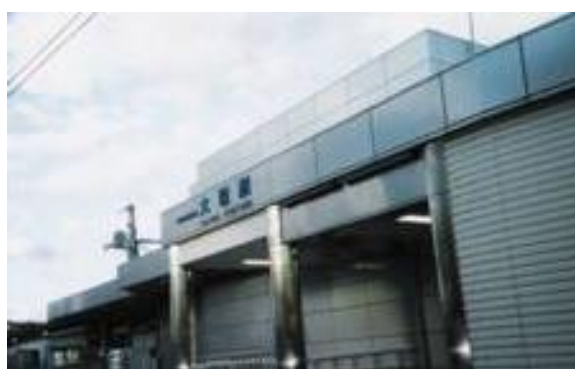
No26. 大場駅 20061007 (土) 16:25