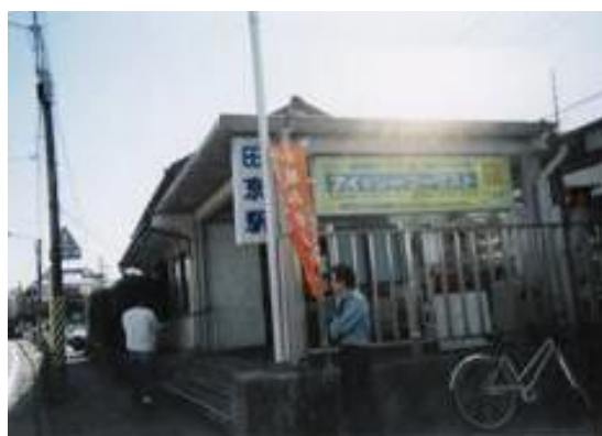
No31. 田京駅 20061007 (土) 13:50