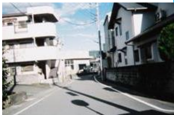
No28. 原木駅 20061007 (土) 15:30