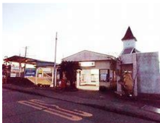
No45. 富士フィルム前駅 20060909 (土) ネットより