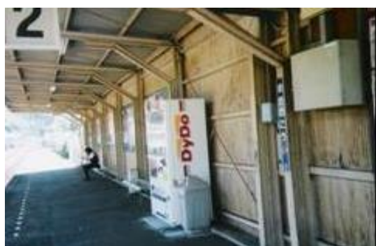
No33. 牧之郷駅 20061007 (土) 12:20