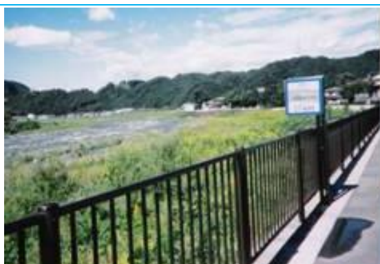
狩野川 (牧之郷駅への路)