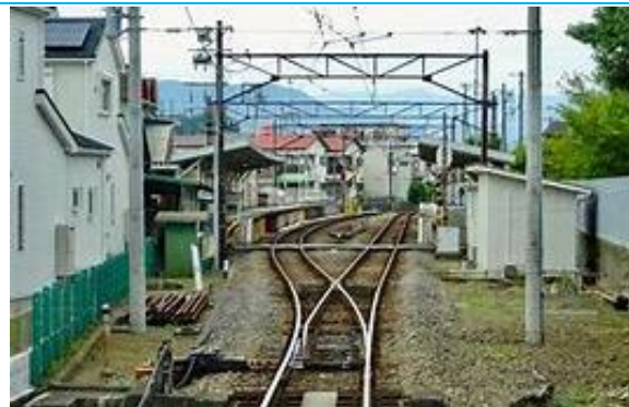
No41. 相模沼田駅 20060909 (土) ネットより