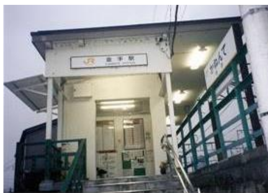
No38. 金手駅 (かねんて) 20070217 (土) 17:09