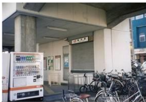
No2. 柚木駅 20070203 (土) 15:25