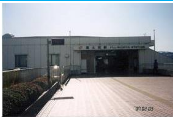
No7. 富士宮駅 20070203 (土) 12:29