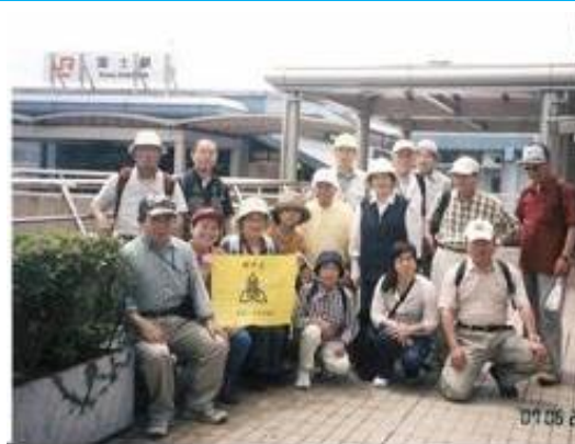
20070623 (土) 第26回わいわい会 (高松一高同窓の歩き会)