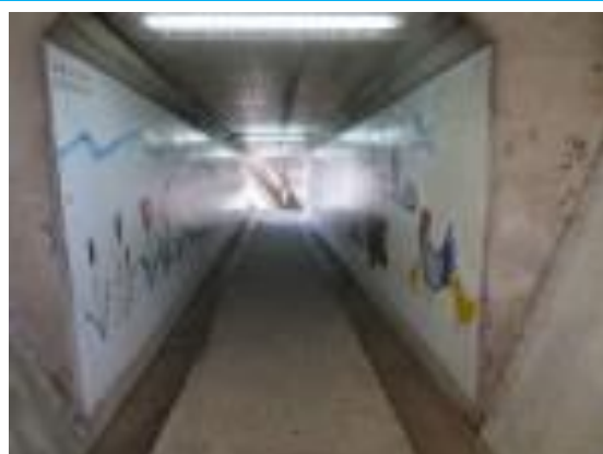
No41. 東小諸駅 20211011 (月) 13:20