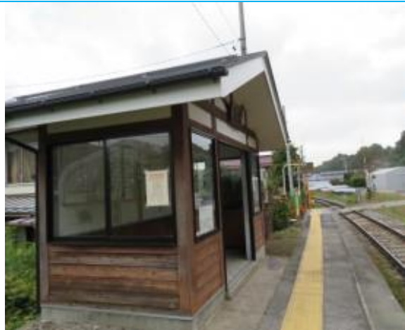
No58. 高岩駅 20211012 (火) 10:47