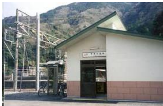
No16. 甲斐大島駅 20070113 (土) 11:25