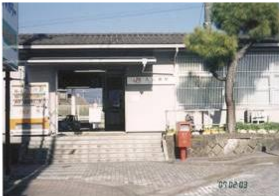
No4. 入山瀬駅 20070203 (土) 14:00