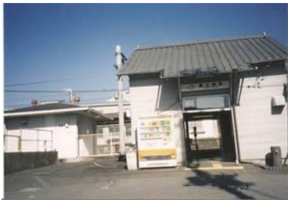
No5. 富士根駅 20070203 (土) 13:13