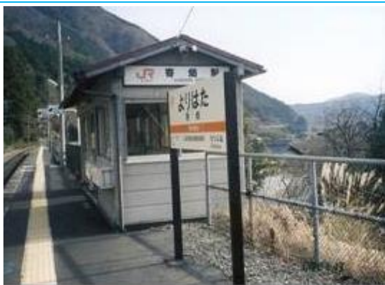
No14. 寄畑駅 20070113 (土) 13:50