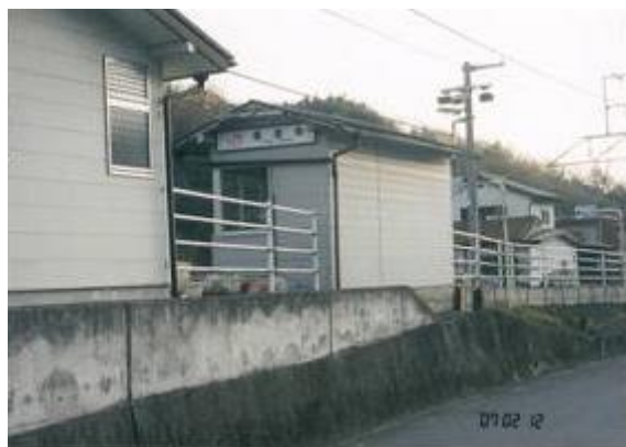
No25. 落居駅 20070212 (月) 16:36