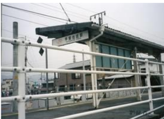
No35. 甲斐住吉駅 20070217（土）15:33