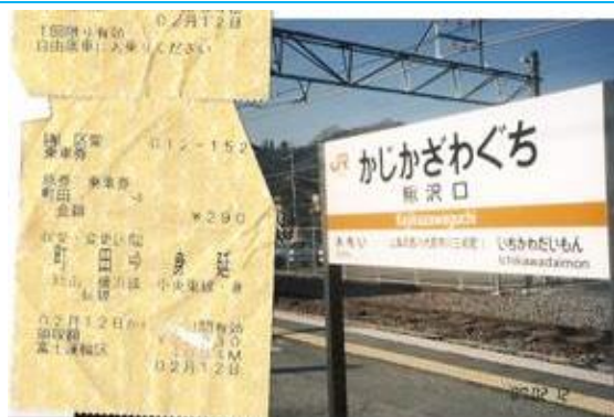
No26. 鰯沢口駅 (かじかざわぐち) 20070212 (月) 18:00 20070217 (土) 8:47