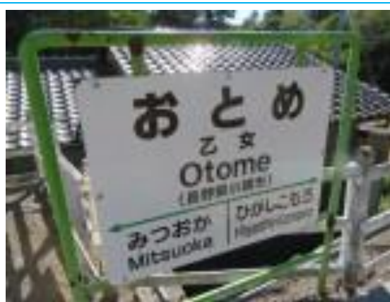
No42. 乙女駅 20211011 (月) 13:48