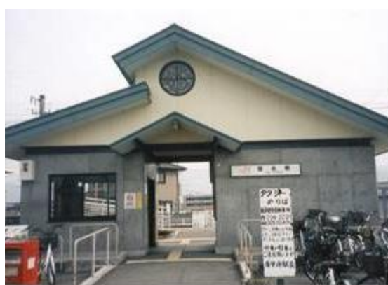
No33. 常永駅 20070217 (土) 13:58