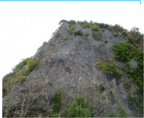
今にも落ちそうな岩 10:31