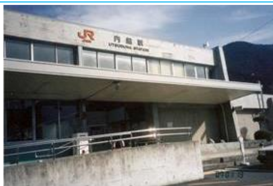
No15. 内船駅 20070113 (土) 12:50