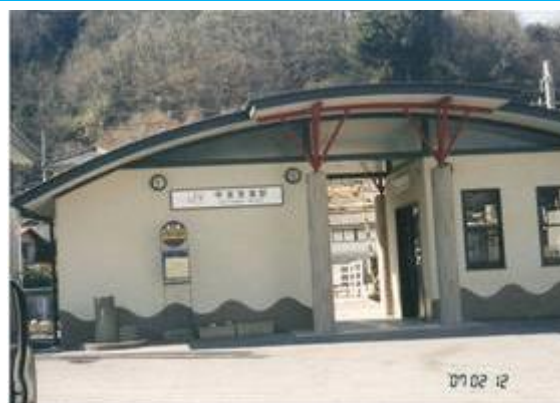
No21. 甲斐常葉駅 20070212 (月) 13:05