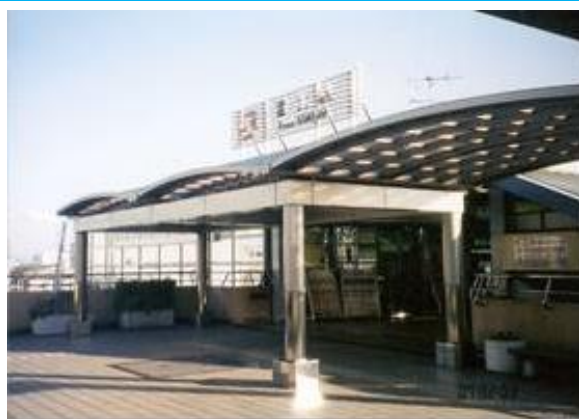
No 1. 富士駅 20070203 (土) 15:52