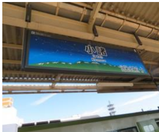
No40. 小諸駅 20211011 (月) 12:26