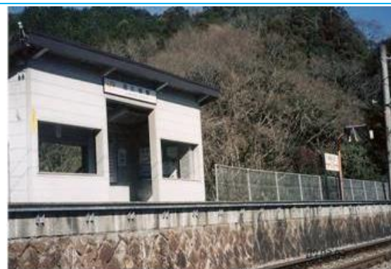
Np9. 沼久保駅 20070203 (土) 10:08