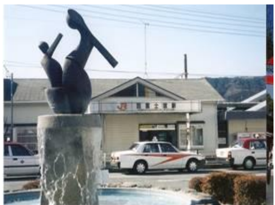
No8. 西富士宮駅 20070203 (土) 11:25