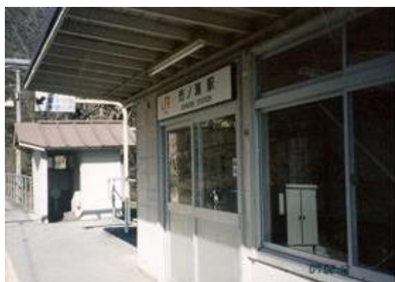
No22. 市ノ瀬駅 20070212 (月) 13:54