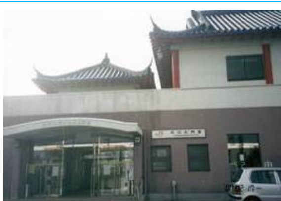
No27. 市川大門駅 20070217 (土) 9:55