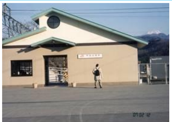
No24. 甲斐岩間駅 20070212 (月) 16:10