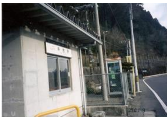
No13. 井出駅 20070113 (土) 14:30