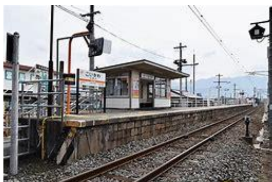
No32. 小井川駅 未踏破 (20070217)