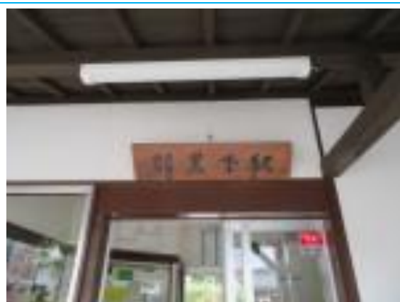
No55. 羽黒下駅 20211012 (火) 12:33