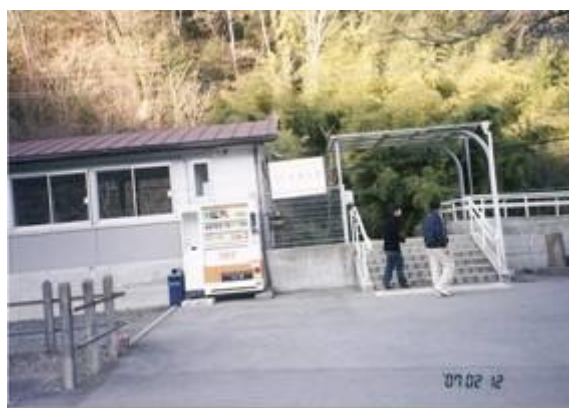
No23. 久那土駅 (くなど) 20070212 (月) 15:32