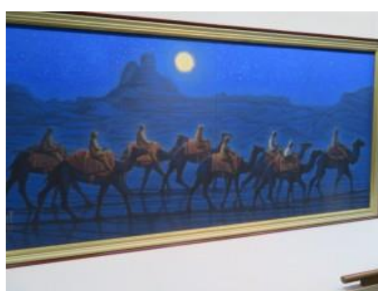
平山郁夫シルクロード美術館