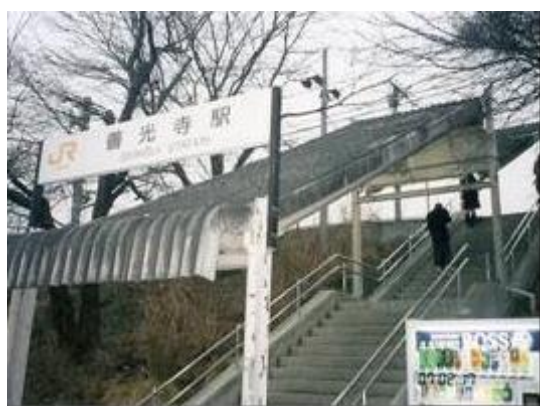
No37. 善光寺駅 20070217 (土) 16:53