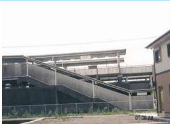
No3. 豎堀駅 (たてぼり) 20070203 (土) 未踏破