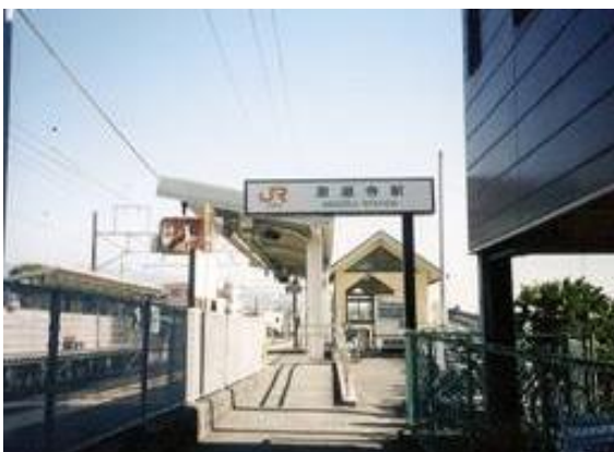
No6. 源道寺駅 20070203 (土) 12:50