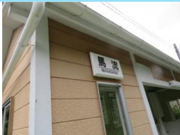
No59. 馬流駅 (まながし) 20211012 (火) 10:16