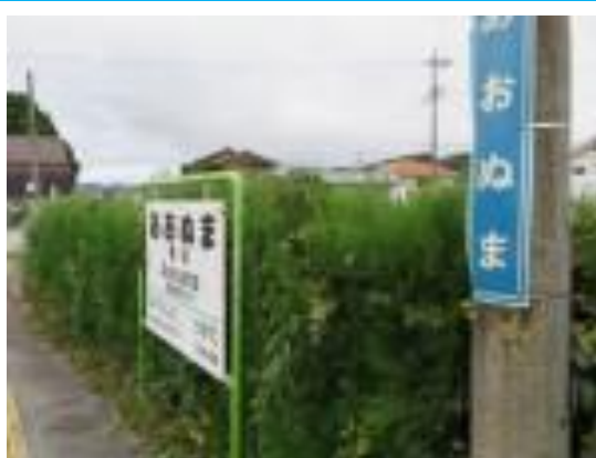
No54. 青沼駅 20211012 (火) 13:08