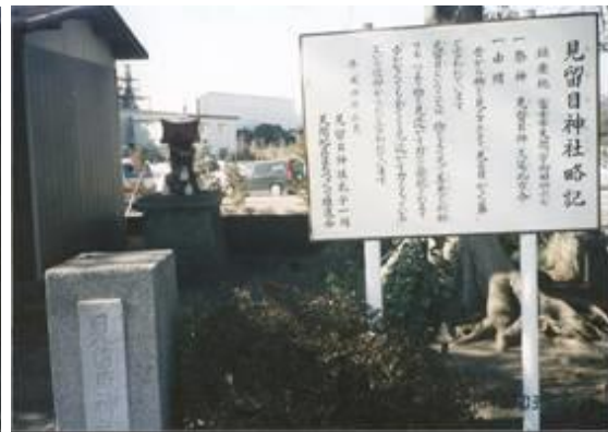
見留目神社 (入山瀬駅への路)