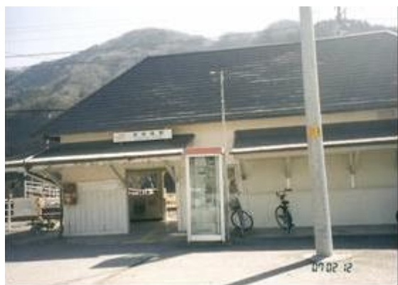
No19. 波高島駅 20070212 (月) 11:20