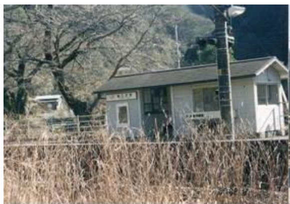
No18. 塩之沢駅 20070212 (月) 10:10