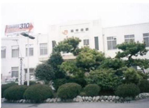
No36. 南甲府駅 20070217（土）15:55