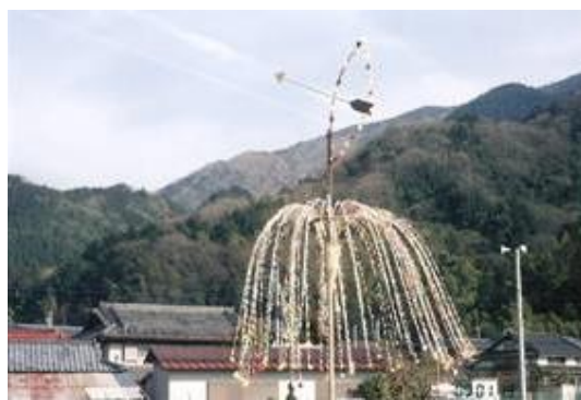
甲斐大島駅への路