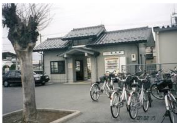
No34. 国母駅（こくぼ） 20070217（土）14:40