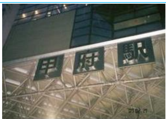
No39. 甲府駅 20070217 (土) 17:45