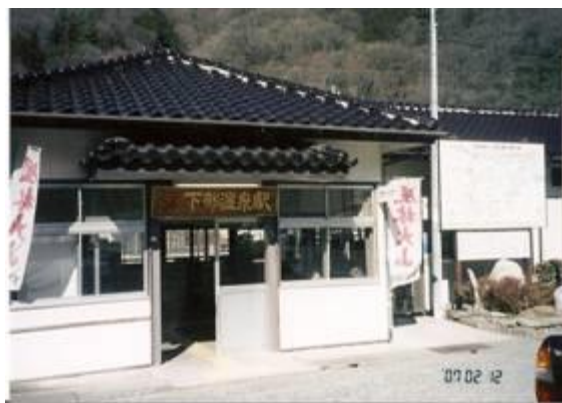
No20. 下部温泉駅 20070212 (月) 11:53