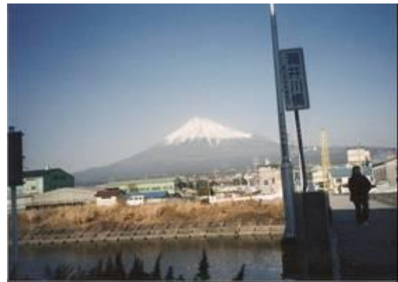
潤井川橋からの富士山 14:45