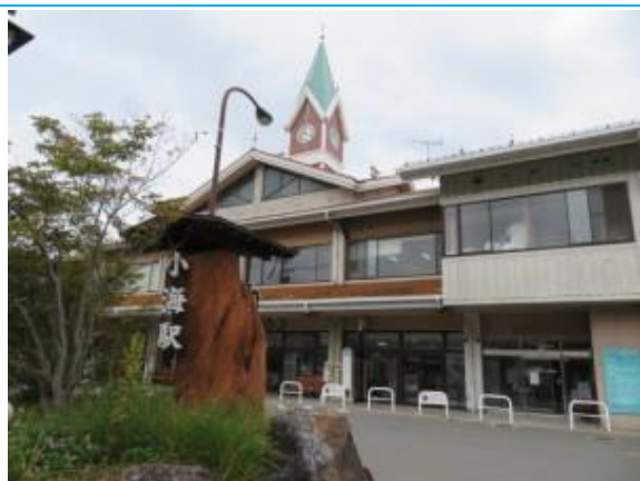
No60. 小海駅 20211012 (火) 9:53