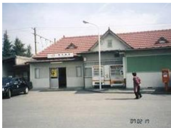
No31. 東花輪駅 20070217 (土) 12:25