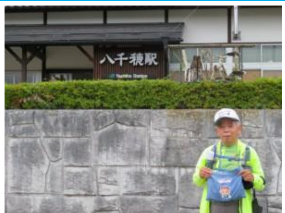
No57. 八千穂駅 20211012 (火) 11:20