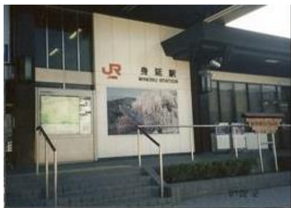
No17, 身延駅 20070113 (土) 10:00 20070212 (月) 9:30