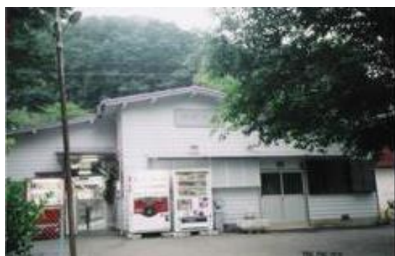
No3. 田野倉駅 20060603 (土) 16:40