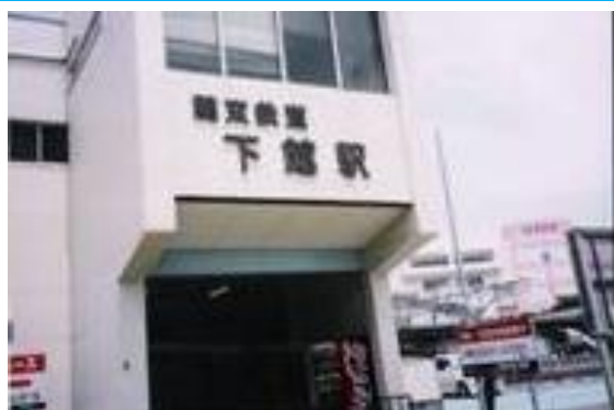
No43. 下館駅 20040529 (土) 11:25