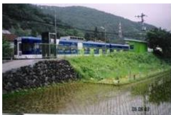
No13. 葭池温泉前駅(よしいけ) 20060603 (土) 11:28