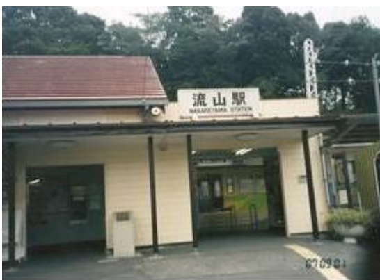
No80. 流山駅 20070901 (土) 14:42