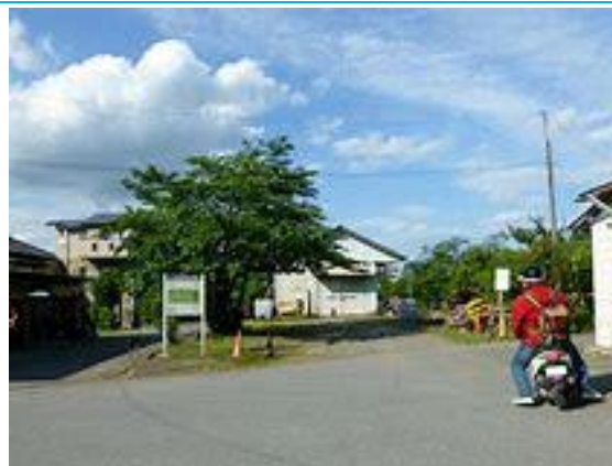
No58. 高滝駅 20040703 (土)