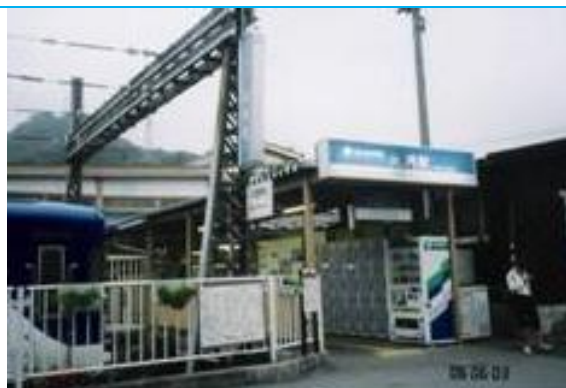
No1. 大月駅 20060603 (土) 17:55