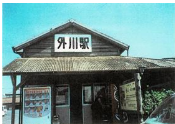
No74. 外川駅 20020406 (土) 10:34