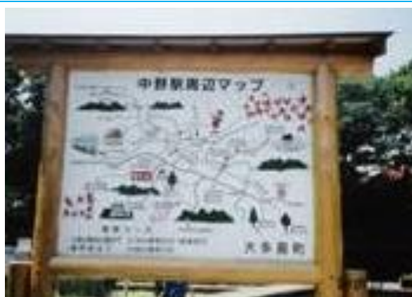
No64. 上総中野駅 20040703 (土) 10:30