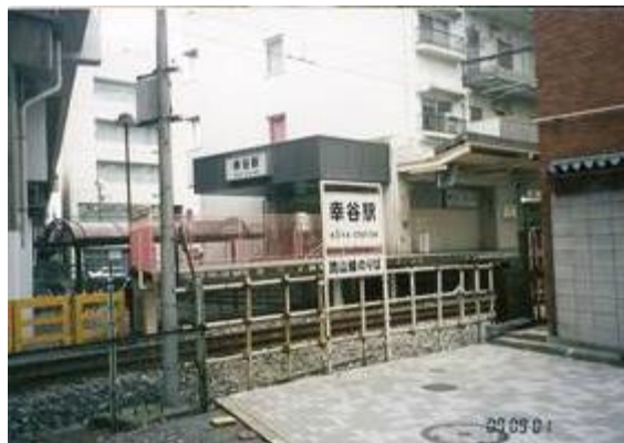
No76. 幸谷駅 20070901 (土) 16:10