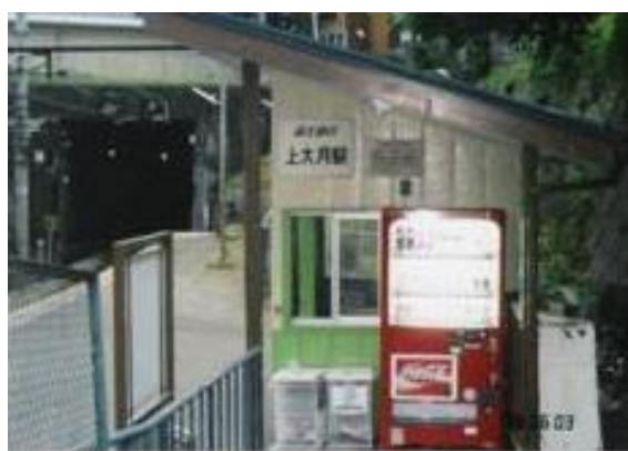
No2. 上大月駅 20060603 (土) 17:40