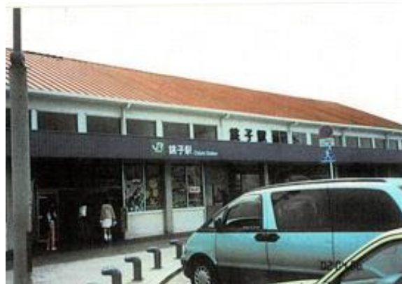
No65. 銚子駅 20020406 (土) 10:13