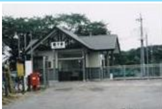
No41. 黒子駅 20040529 (土) 14:30