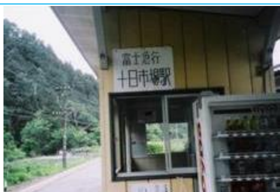
No9. 十日市場駅 20060603 (土) 13:55