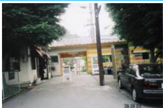
No5. 赤坂駅 20060603 (土) 15:25