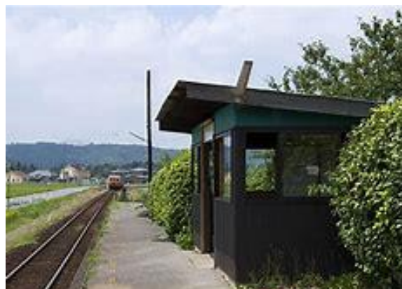
No55. 上総川間駅 20040703 (土) ネットより