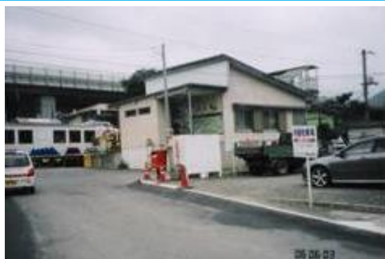
No4. 禾生駅(かせい) 20060603 (土) 15:50