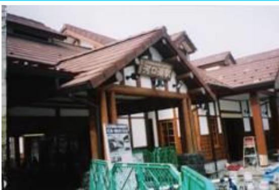
No18. 河口湖駅 20060603（土）8:12