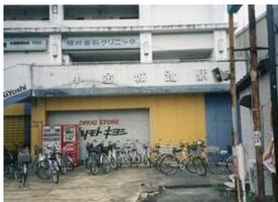
No77. 小金城跡駅 20070901 (土) 15:48