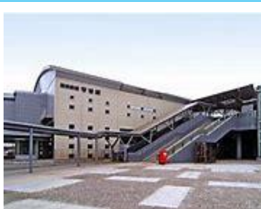
No27. 守谷駅 20040619 (土) 16:30