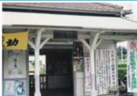
No49. 海士有木駅 20040716 (月) 14:10