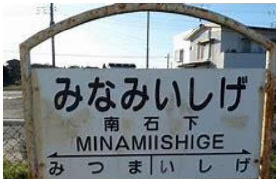
No34. 南石下駅 20040619 (土)