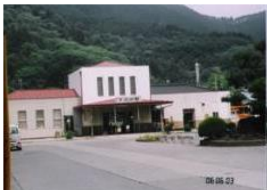
No14. 下吉田駅 20060603 (土) 11:10