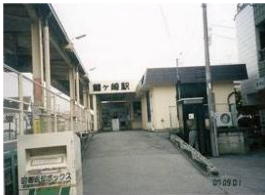
No78. 鰭ヶ崎駅 20070901 (土) 15:30