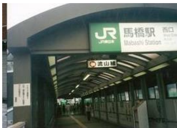
No75. 馬橋駅 20070901 (土) 16:50