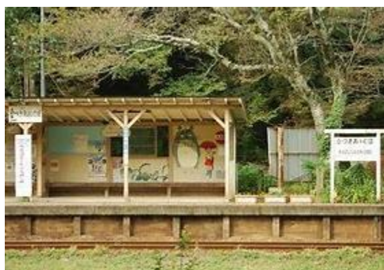
No62. 上総大久保駅 20040703 (土) ネットより