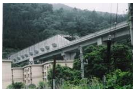
リニアモーターカー 16:15