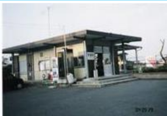
No37. 宗道駅 20040529 (土) 18:00