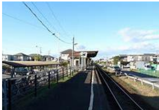
No31. 北水海道駅 20040619 (土) ネットより