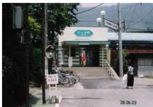
No15. 月江寺駅 20060603 (土) 10:40