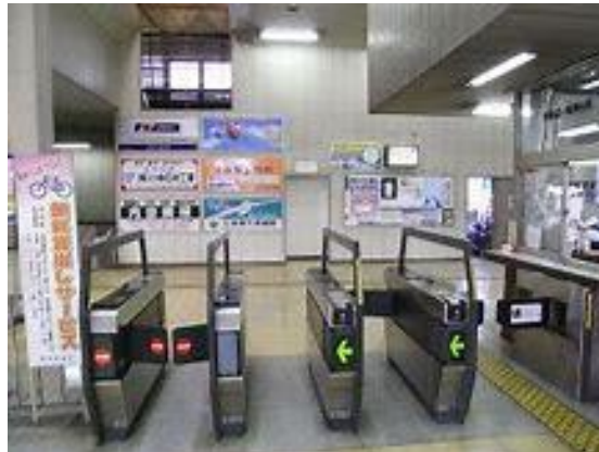
No28. 新守谷駅 20040619 (土) ネットより