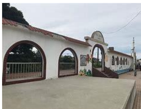
No73. 犬吠駅 20020406 (土) ネットより