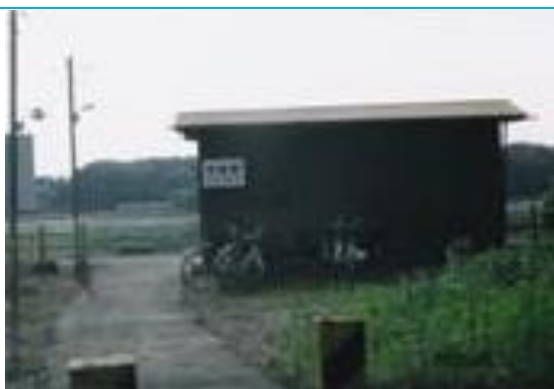
No39. 大宝駅 20040529 (土) 16:10