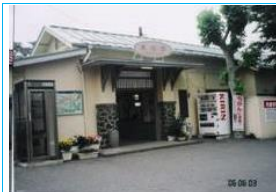
No10. 東桂駅 20060603 (土) 13:20