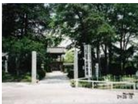
No33. 三妻駅 20040619 (土) 12:05