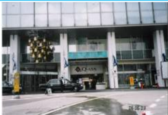
No16. 富士山駅（富士吉田駅） 20060603（土）10:05