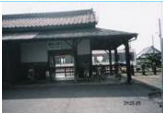
No40. 鵜波ノ江駅 20040529 (土) 15:15