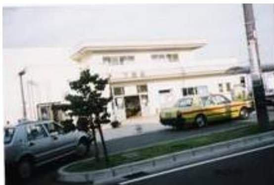
No38. 下妻駅 20040529 (土)