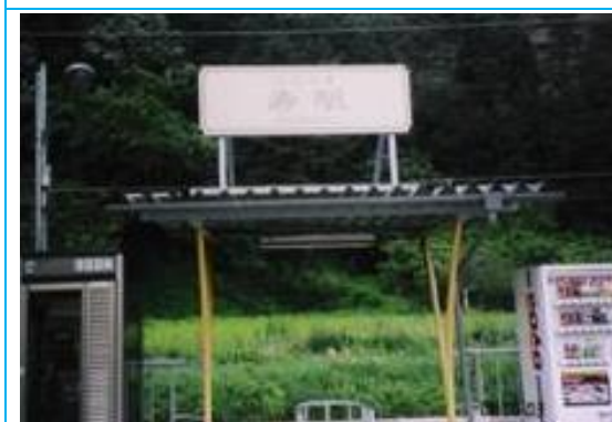
No12. 寿駅 20060603 (土) 11:50