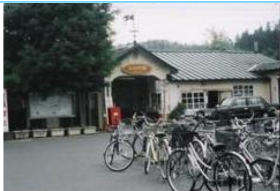
No7. 谷村町駅 20060603 (土) 14:37