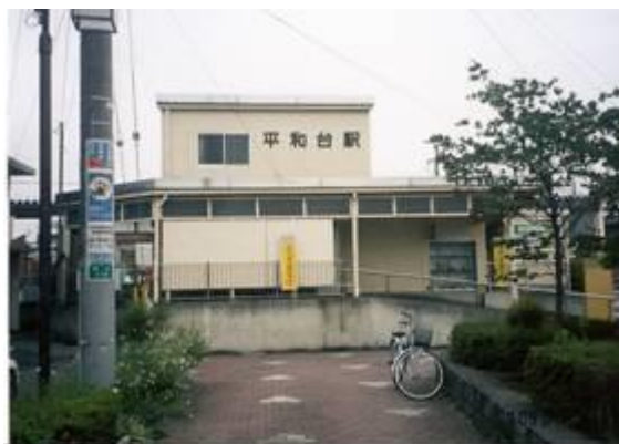
No79. 平和台駅 20070901 (土) 14:54