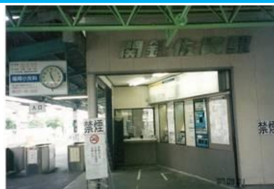
No44. 佐貫駅 20070901 (土) 13:01