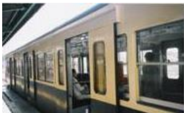
No30. 水海道駅 20040619 (土) 14:15