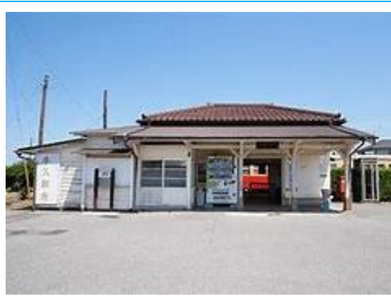
No59. 里見駅 20040703 (土) 15:25