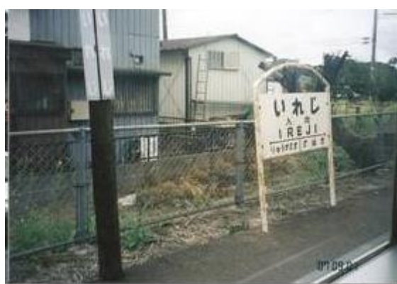
No45. 入地駅 20070901 (土)