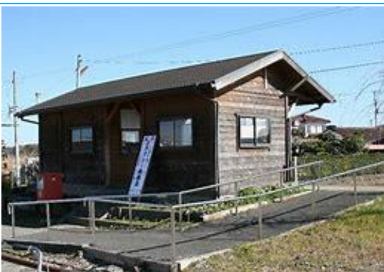
No50. 上総三又駅 20040716 (月) ネットより