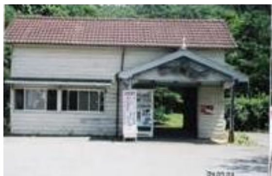
No61. 月崎駅 20040703 (土) 13:10