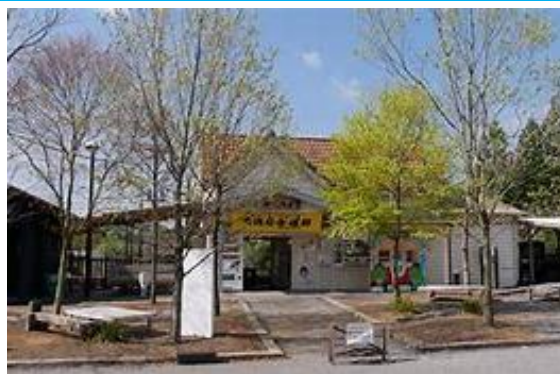
No63. 養老溪谷駅 20040703 (土) ネットより