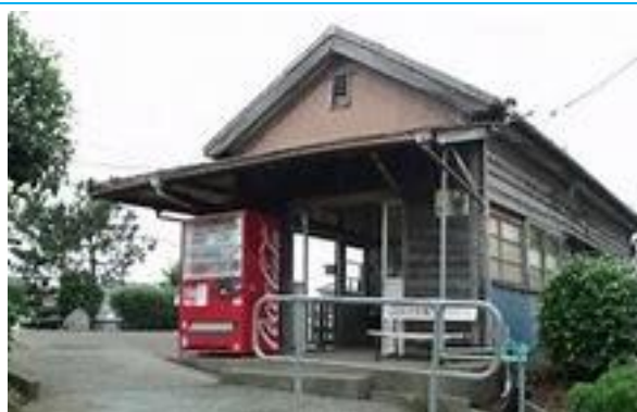
No69. 笠上黒生駅 20020406 (土) ネットより