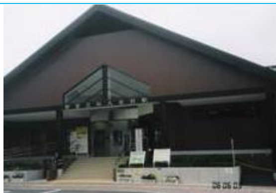
No8. 都留文科大学前駅 20060603 (土) 14:10