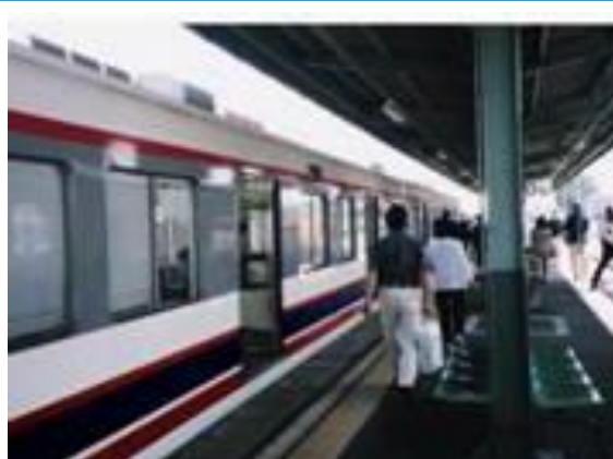
No19. 取手駅 20040619 (土) 19:10