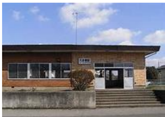
No42. 大田郷駅 20040529 (土) ネットより