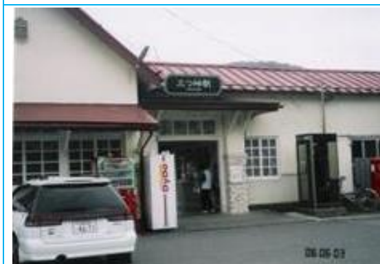
No11. 三つ峠駅 20060603 (土) 12:25