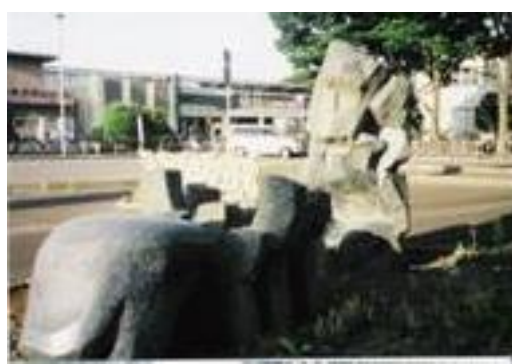
No25. 戸頭駅 20040619 (土) 17:30