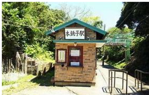
No68. 本銚子駅 20020406 (土)