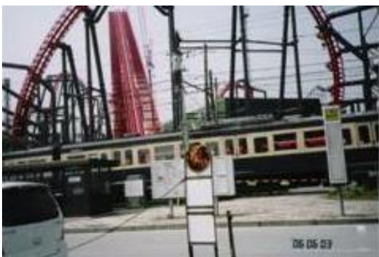
No17. 富士急ハイランド駅 20060603（土）9:40