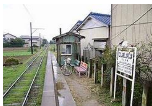
No70. 西海鹿島駅 20020406 (土) ネットより