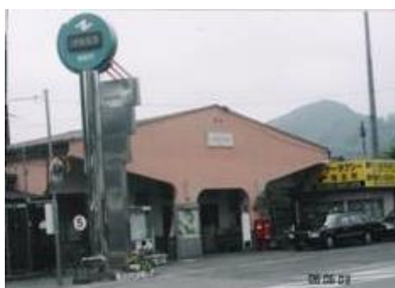
No6. 都留市駅 20060603 (土) 14:55