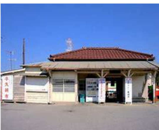
No51. 上総山田駅 20040716 (月) 12:55 ネットより