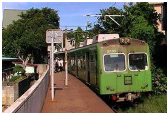
No67. 観音駅 20020406 (土)