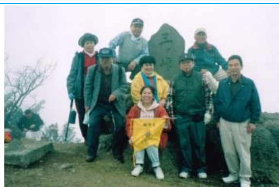
三つ峠高松一高ハイキング会 20001028 (土)