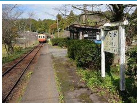
No60. 飯給駅 (いたぶ) 20040703 (土) 14:50