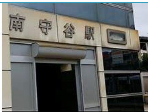
No26. 南守谷駅 20040619 (土) 17:10