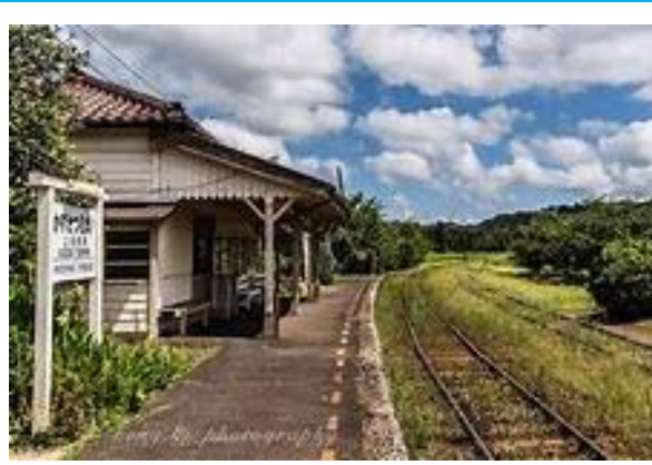
No56. 上総鶴舞駅 20040703 (土) 17:25