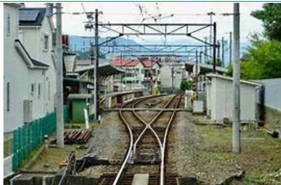
No41. 相模沼田駅 20060909 (土) ネットより