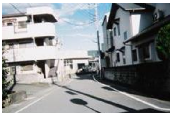
No28. 原木駅 20061007 (土) 15:30