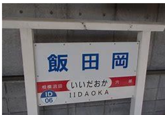
No40. 飯田岡駅 20060909 (土) ネットより