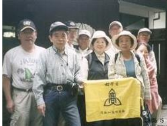
修善寺温泉”指月荘”前