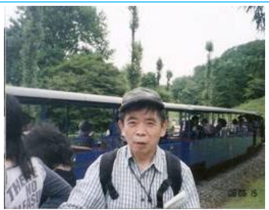
虹の郷 ロムニー鉄道前