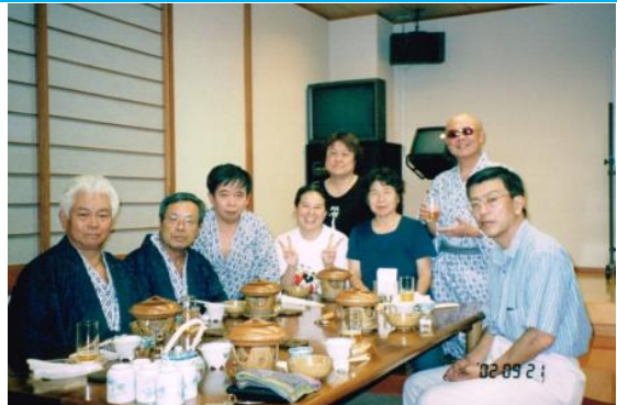
湯河原エスパにて (希望者宿泊) 20020921 (土)