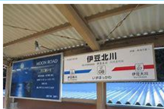
No13. 伊豆北川駅 20060211 (土) ネットより