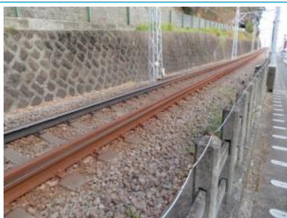
風祭駅界隈のレール