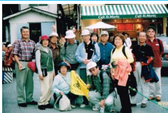
No51. 箱根湯本駅 20020921 (土) 16:20