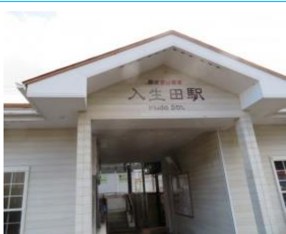
No50. 入生田駅 20010707 (土) / 20220110 (月) 13:50