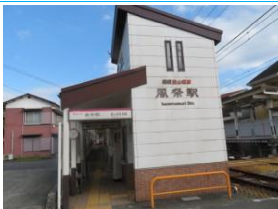
No49. 風祭駅 20010707 (土) 20220110 (月) 14:12