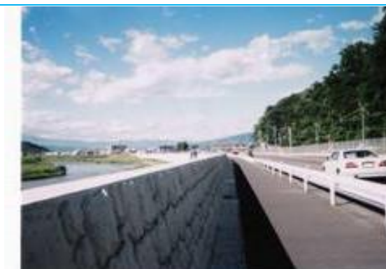
遠くに雲がかかった富士山 (伊豆長岡駅への路)