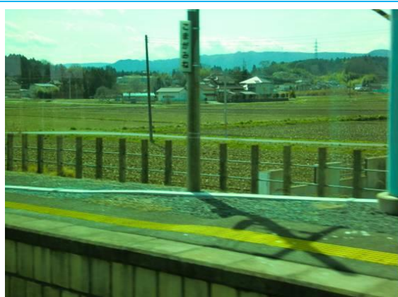
No8. 駒ヶ嶺駅 (車窓より) 20100321 (日) ?