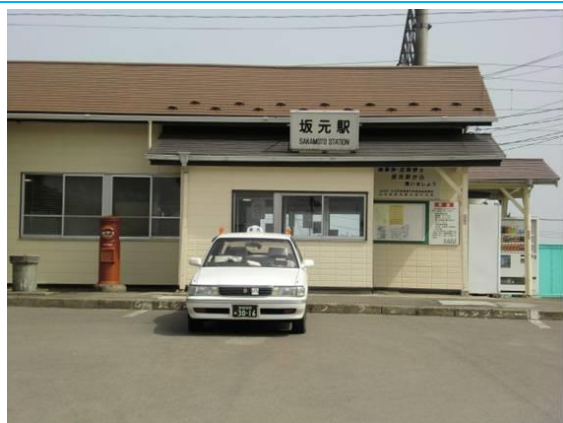
No6. 坂元駅 20100321 (日) 12:00