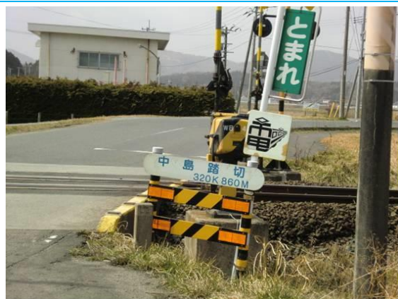
中島踏切 (坂元駅への路)