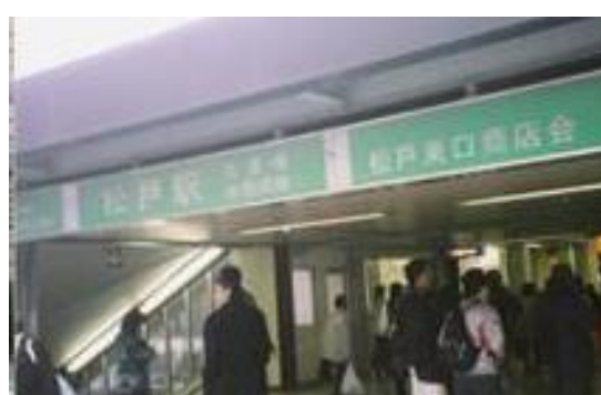
20050212(土) 第17回わいわい会 (高松一高同窓の歩き会) より