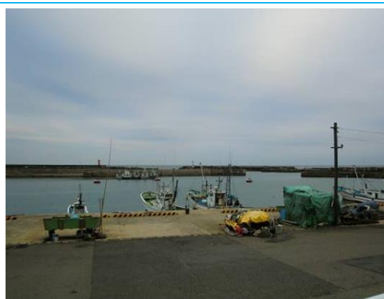
四ツ倉駅近郊の海岸線