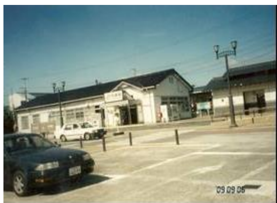
No30. 内郷駅 20090906 (日) 9:32