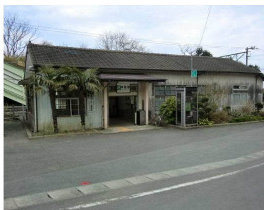
No25. 末続駅 20100404(日)14:43