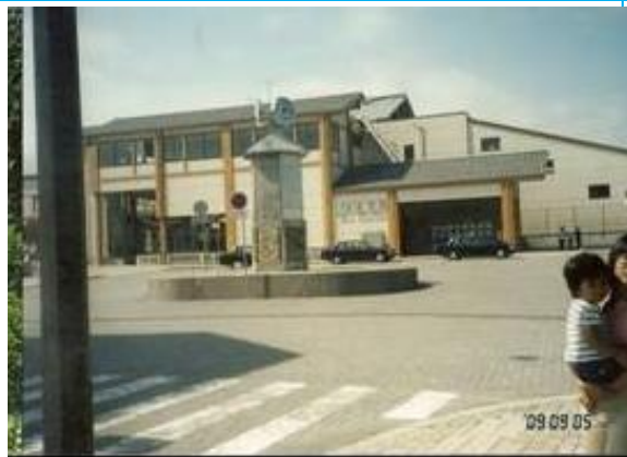
No36. 磯原駅 20090905 (土) 13:17