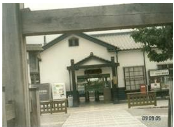
No34. 勿来駅 (なこそ) 20090905 (土) 16:41