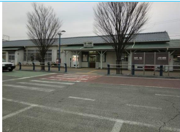
No27. 四ツ倉駅 20100404(日)17:17