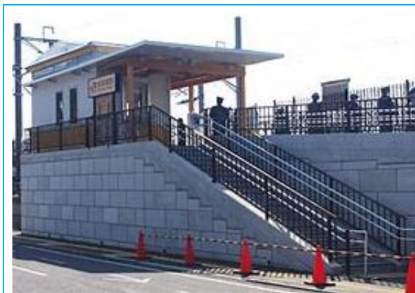
No48. 借楽園駅 20030111 (土)