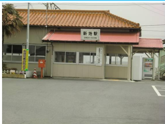
No7. 新地駅 20100321 (日) 10:12