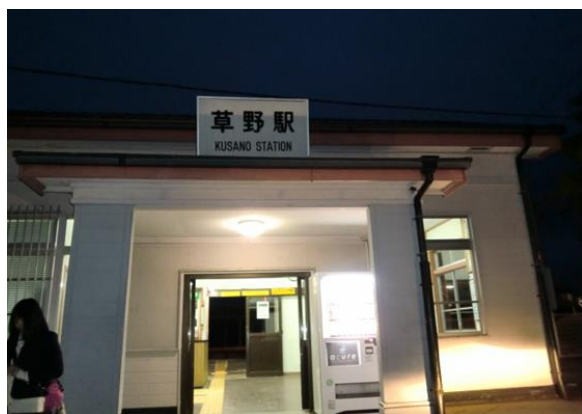
No28. 草野駅 20100404(日)18:25