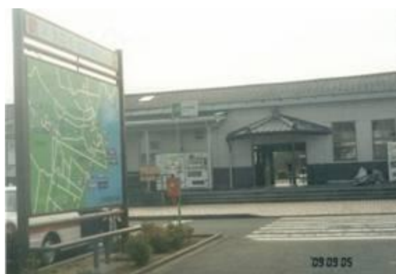
No35. 大津湊駅 20090905 (土) 15:11