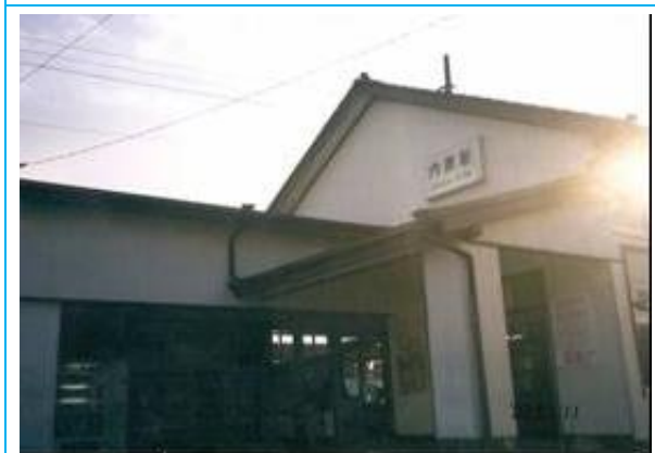
No50. 内原駅 20030111 (土) 15:15