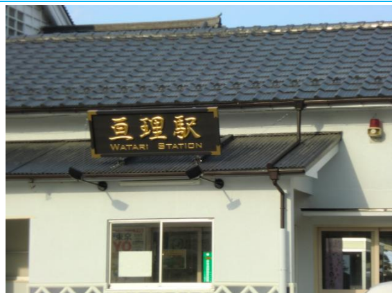
No3. 亙理駅 (わたり) 20100321 (日) 16:11