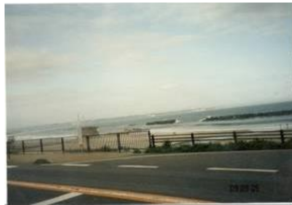
勿来海岸 (勿来駅への路)