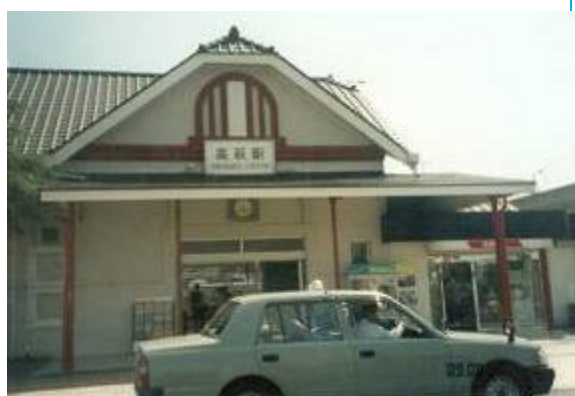
No38. 高萩駅 20040731 (土) 9:59 20090905 (土) 10:00