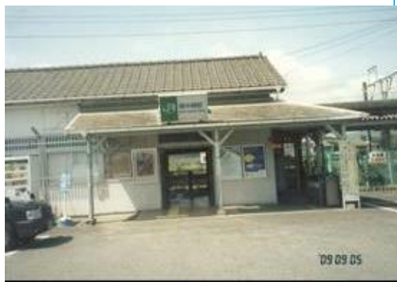
No37. 南中郷駅 20090905 (土) 11:30