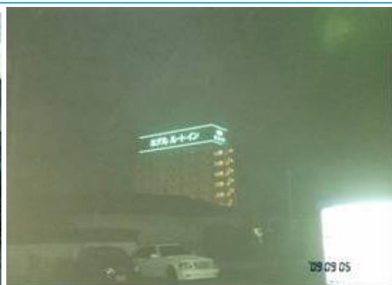
ホテルルートインの看板 (泉駅への路)