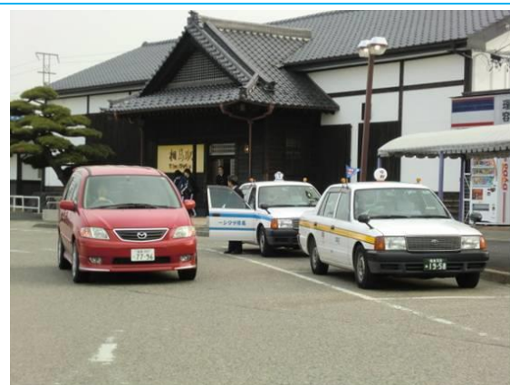
No9. 相馬駅 20100320 (土) 18:50 20100321 (日) 7:38