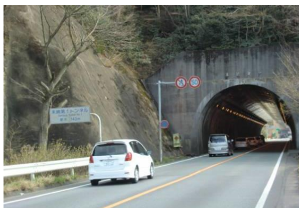
末続第1トンネル (久ノ浜駅への路)