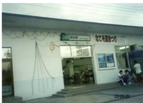
No33. 植田駅 20090905 (土) 17:51