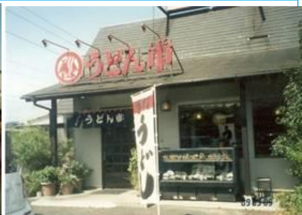
うどん屋でランチ (. 磯原駅への路)