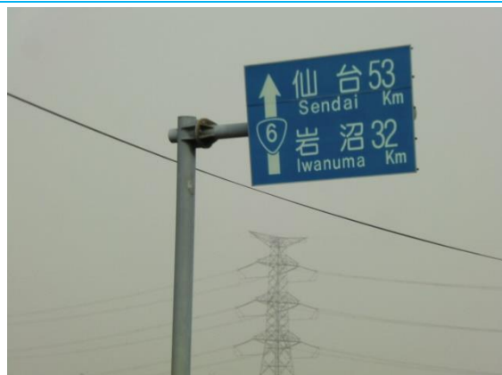
8:40 仙台 53 km、岩沼 32 km地点