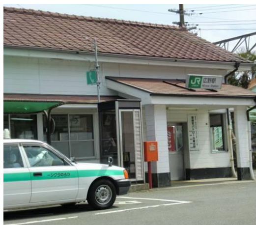
No24. 広野駅 20100404(日)13:11