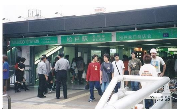
No67. 松戸駅 20011006 (土) 16:10 20011222 (土) 10:40