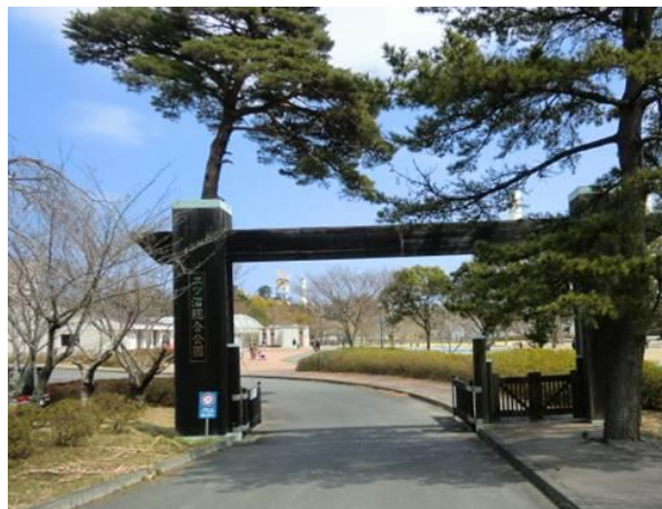
広野町二ツ沼総合公園 (広野駅への路)