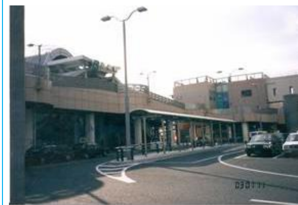
No49. 赤塚駅 20030111 (土) 13:35