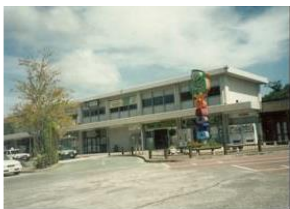
No31. 湯本駅 20090906 (日) 11:00