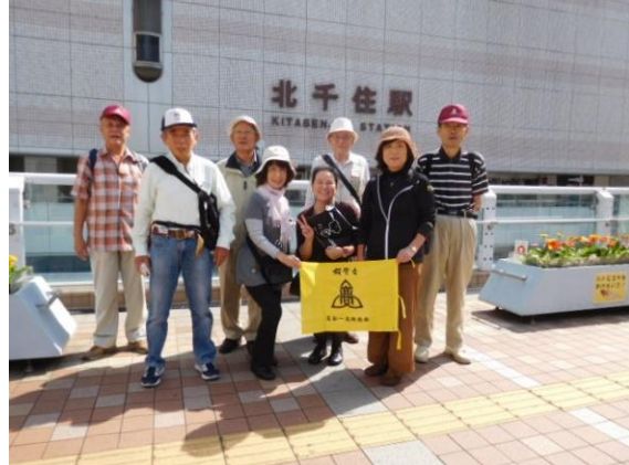
20151003 (土) 第59回わいわい会 (高松一高同窓の歩き会) より