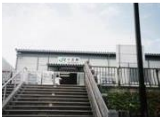
No39. 十王駅 20040731 (土) 12:10