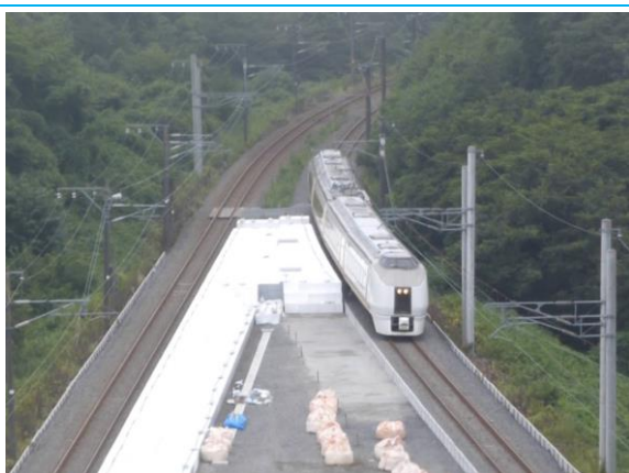
No23. J ヴィレッジ駅 新設駅 20100404(日)8:29