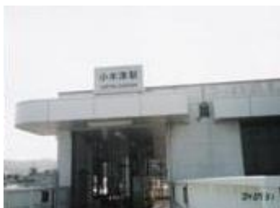
No40. 小津津駅 (おぎつ) 20040731 (土) 14:10