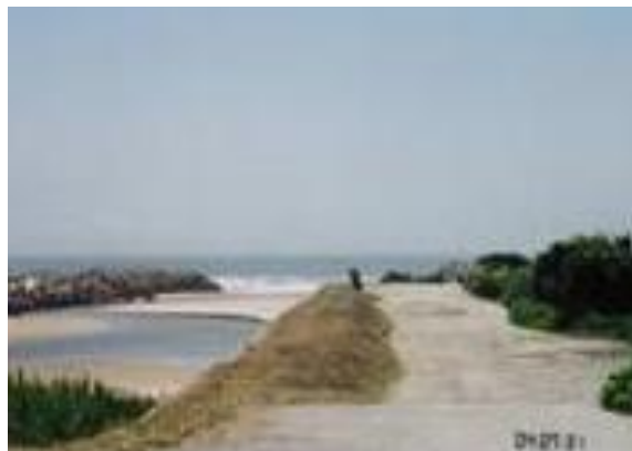
高萩近郊の海 (十王駅への路)