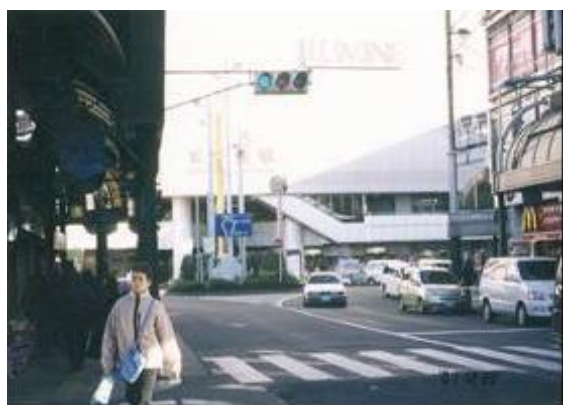
No68. 北千住駅 20011222 (土) ?