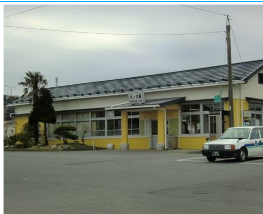
No26. 久ノ浜駅 20100404(日)15:41