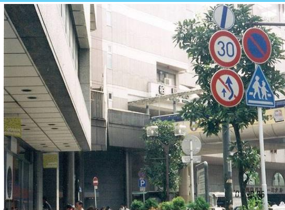
No66. 柏駅 20011006 (土) 12:50