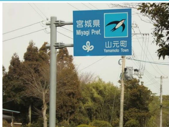
福島県から宮城県へ (坂元駅への路)