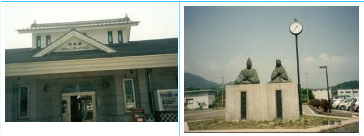
No6. 河毛駅 20090619 (金) 13:38