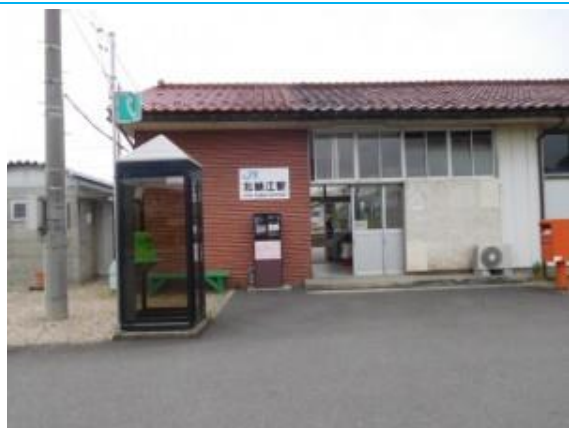
No20. 北鯖江駅 20190606 (木) 16:37