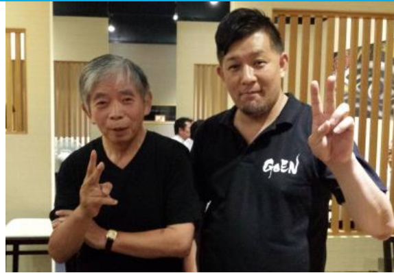
20180801 (水) 漁師飯居酒屋”GOENにて (金沢)