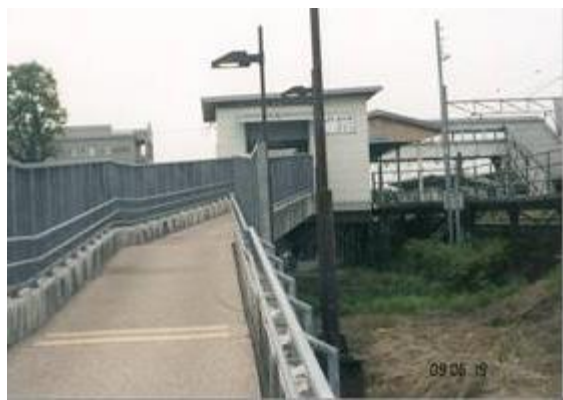
No3. 田村駅 20090619 (金) 17:50