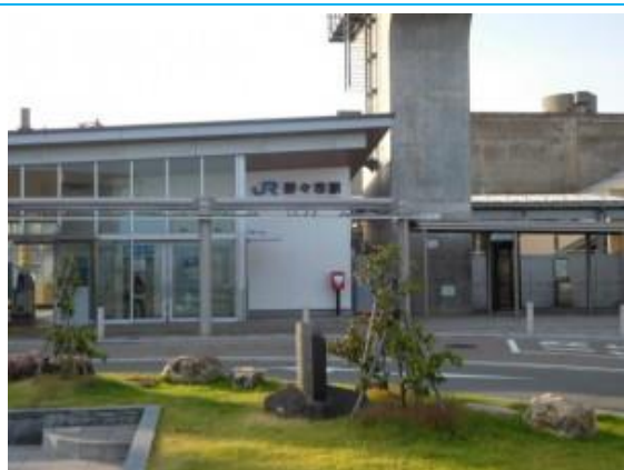
No41. 野々市駅 20180802 (木) 17:38