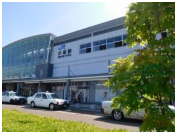
No34. 小松駅 20180802 (木) 9:46