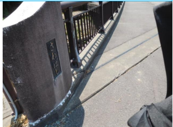
沢橋 (細呂木駅への路)