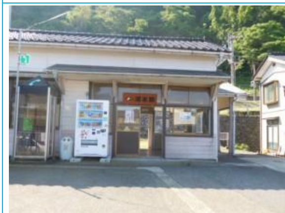
No73. 浦本駅 20180603 (日) 8:28