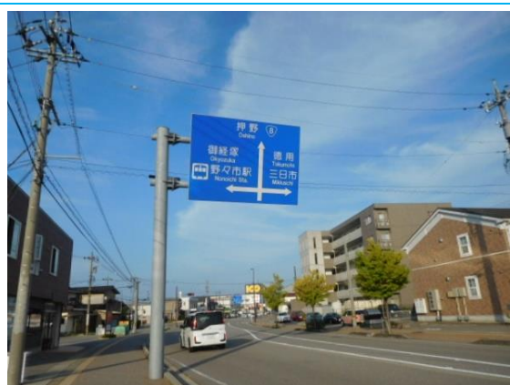
野々市駅を記した道路標識