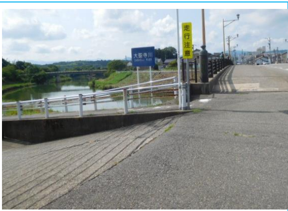
大聖寺川 (大聖寺駅への路)