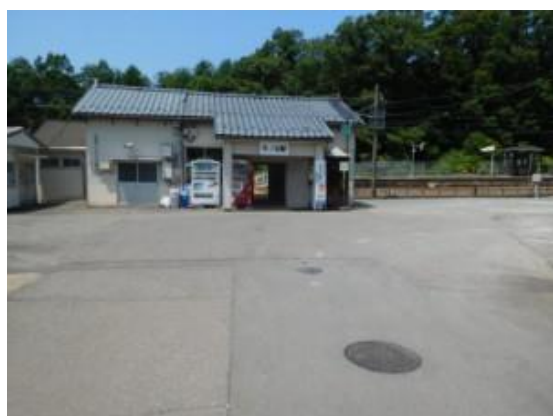
No29. 牛ノ谷駅 20180803 (金) 11:57