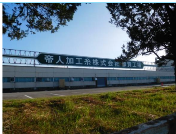
帝人加工系 (株) 加賀工場 (動橋駅への路)