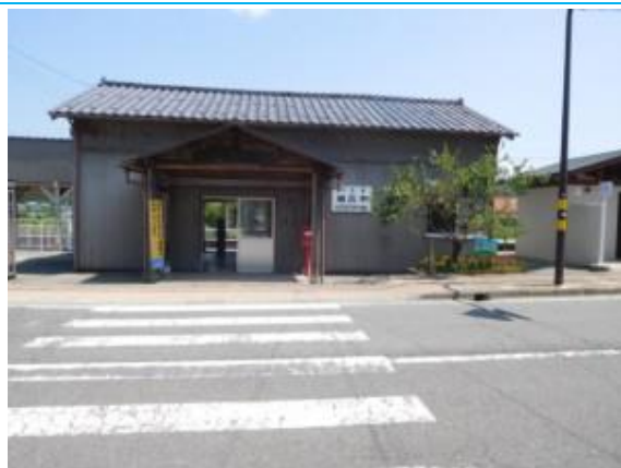
No28. 細呂木駅 20180803 (金) 13:00