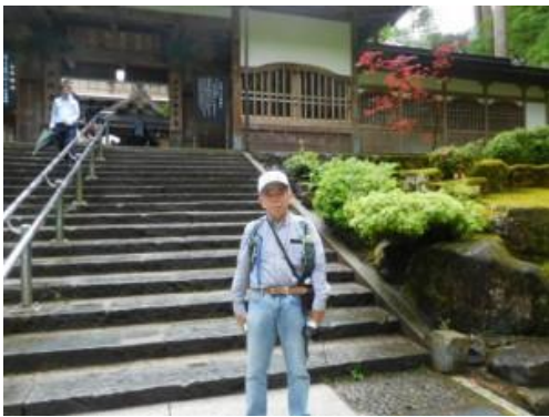
20200908 (火) 永平寺