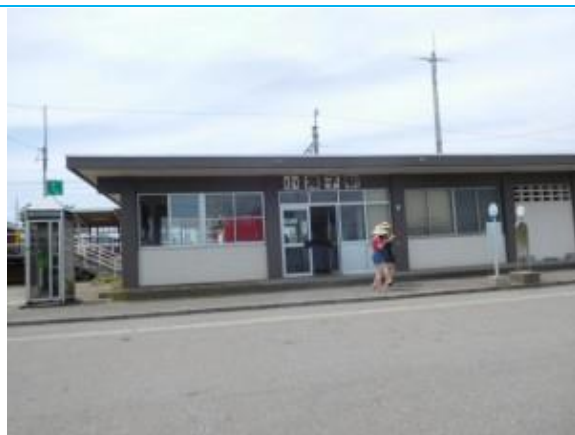
No37. 小舞子駅 20180802 (木) 13:11