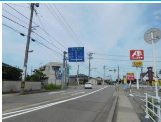
笠間を記した道路標識