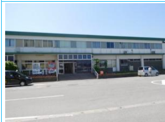
No74. 能生駅 (のう) 20180603 (日) 10:07