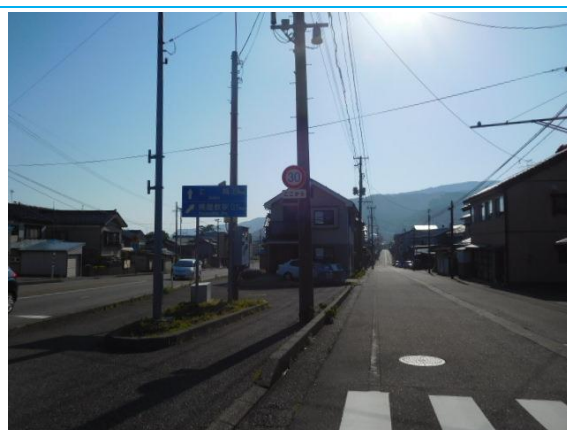
梶屋敷駅への標識