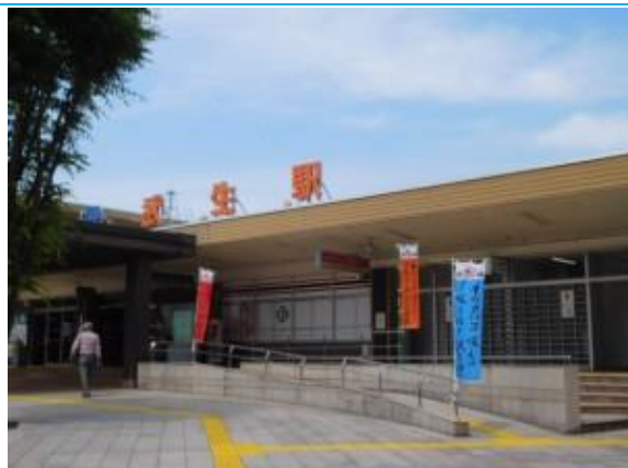
No18. 武生駅 (たけぶ) 20190606 (木) 13:55