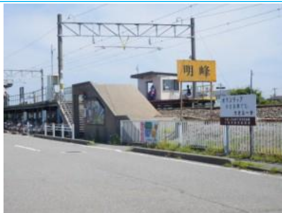
No35. 明峰駅 (めいほう) 20180802 (木) 11:01