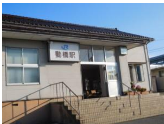
No32. 動橋駅 20180802 (木) 6:41