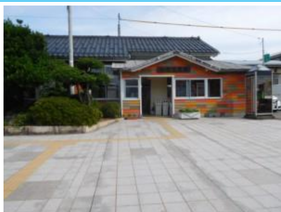
No39. 加賀笠間駅 20180802 (木) 15:02