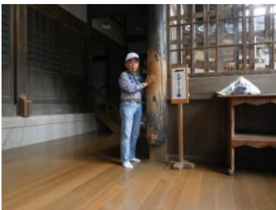
20200908 (火) 永平寺