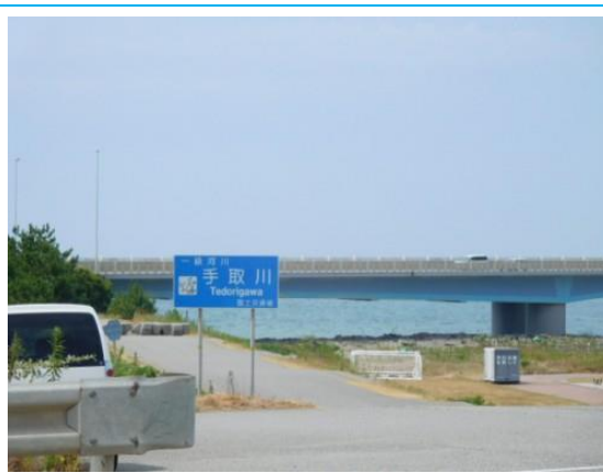
手取川 (美川駅への路)