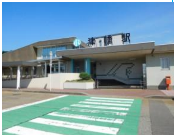
No46. 津幡駅 20180801 (水) 14:58