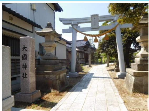
大國神社 (明峰駅への路)