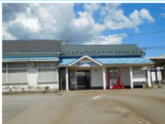
No53. 越中大門駅 20200908 (火) 12:57