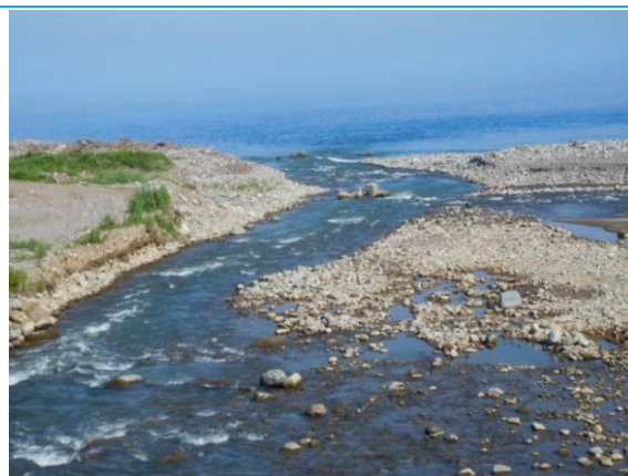
早川橋と日本海 (浦本駅への路)