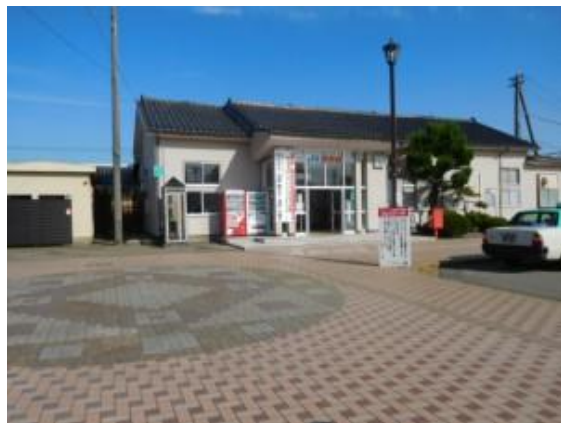
No33. 栗津駅 20180802 (木) 8:02