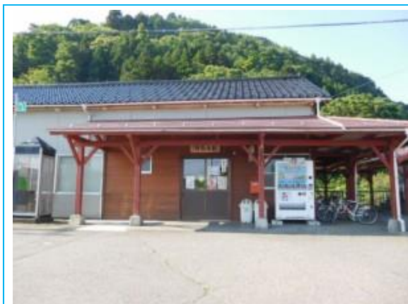
No72. 梶屋敷駅 20180603 (日) 7:27