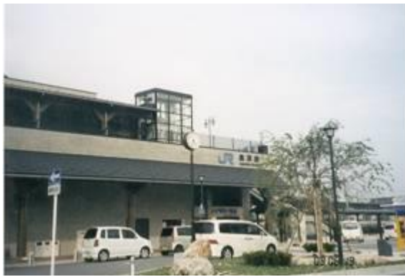
No4. 長浜駅 20090619 (金) 16:35