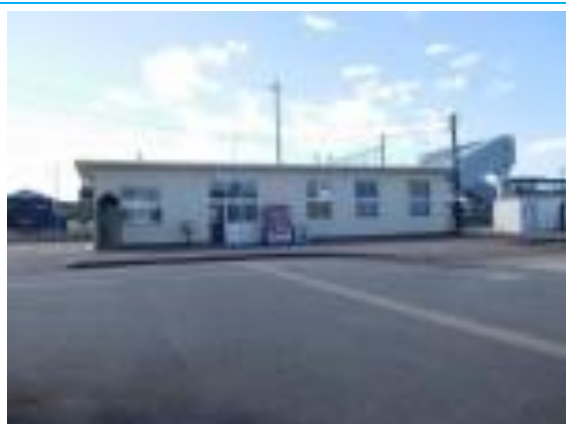
No50. 西高岡駅 20200908 (火) 9:20