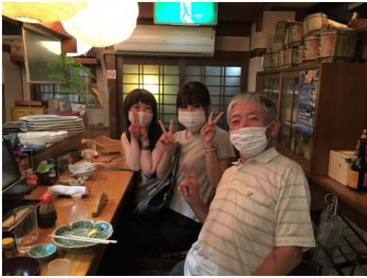
20200908 (火) 富山の味泥湖“漁火”にて