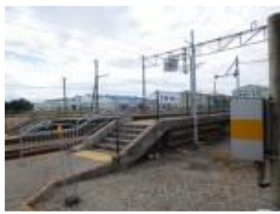
No60. 東滑川駅 20200909 (水) 10:05