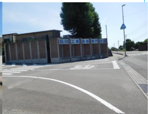
石川工業高等専門学校 (津幡駅への路)