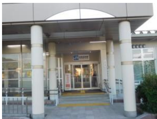
No31. 加賀温泉駅 20180802 (木) 5:35 20180803 (金) 8:28