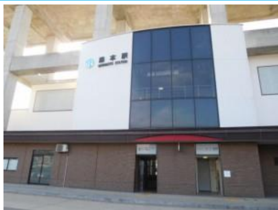
No45. 森本駅 20180801 (水) 16:36