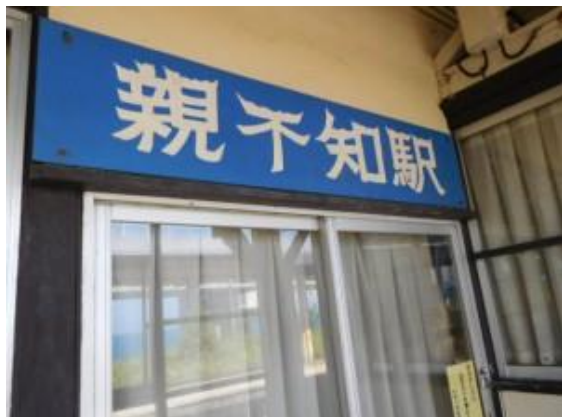
No69. 親不知駅 (おやしらず)