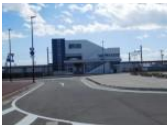
No51. 高岡やぶなみ駅 20200908 (火) 10:33