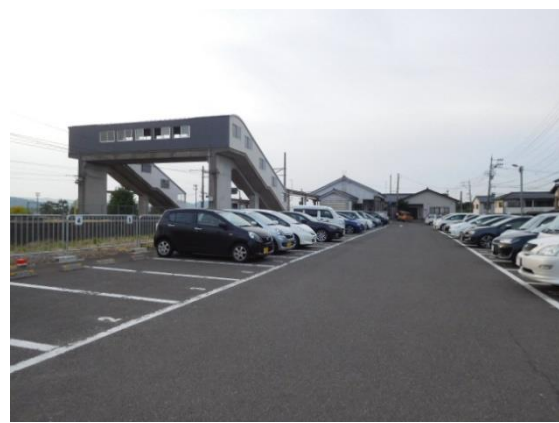
No21. 大土呂駅 (おおどろ) 20190606 (木) 18:14