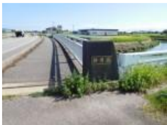
明神橋 (高岡やぶなみ駅への路)