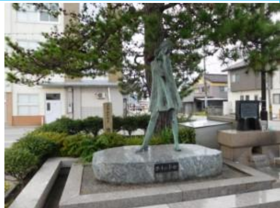
No63. 生地駅 (いくじ) 20200907 (月) 13:20