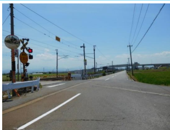
能美根上駅への路