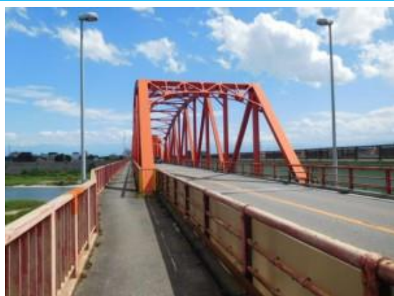
越中大門橋 (越中大門駅への路)