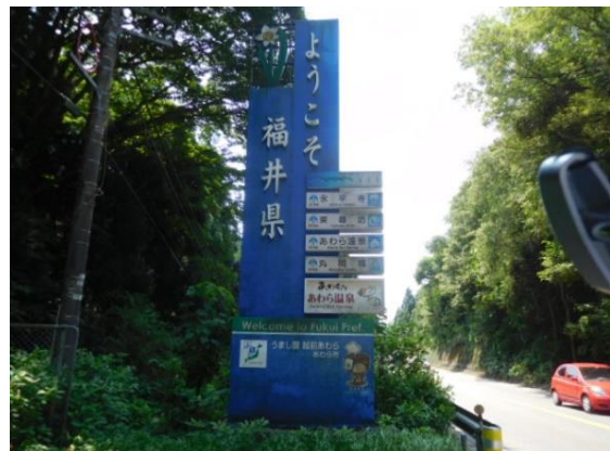
石川県と福井県の県境 (牛ノ谷駅への路)