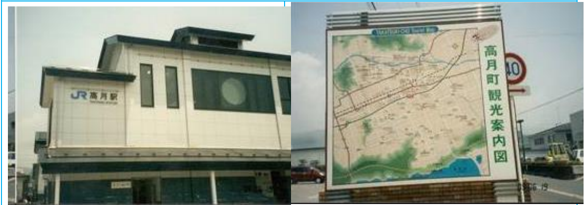
No7. 高月駅 20090619 (金) 12:35