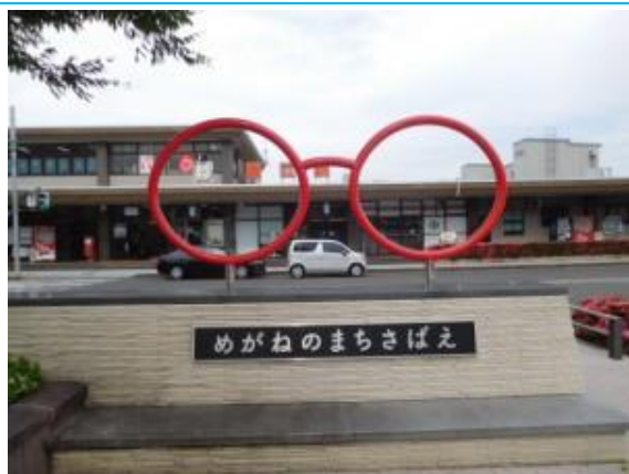
No19, 鯖江駅 20190606 (木) 15:32