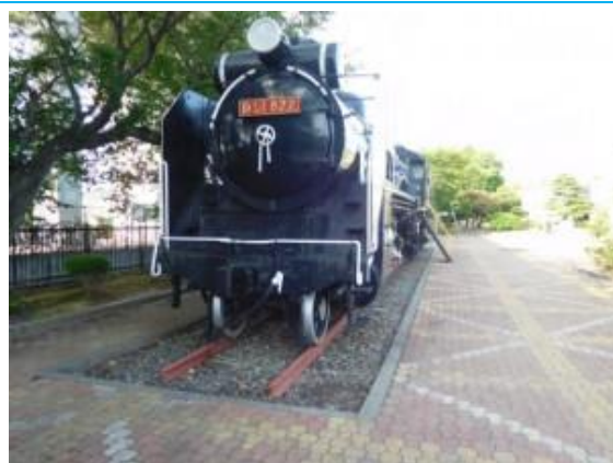
D51 形 822 号蒸気機関車 (松任駅前)