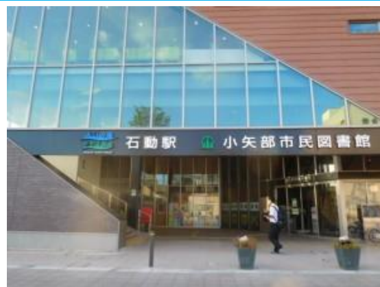
新しく変わった石動駅