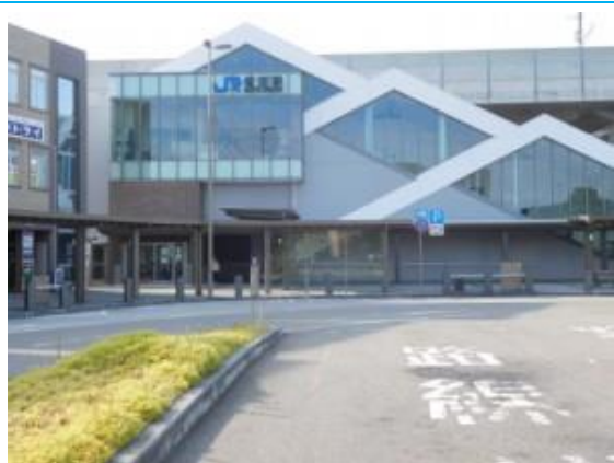
No40. 松任駅 (まつとう) 20180802 (木) 16:35