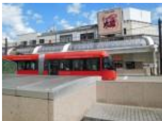
No52. 高岡駅 20200908 (火) 11:46