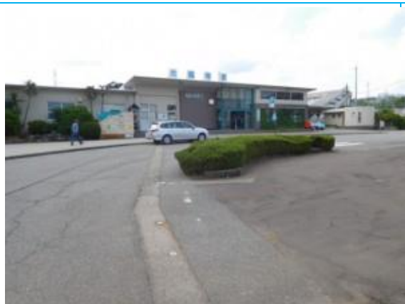
No30. 大聖寺駅 20180803 (金) 8:28