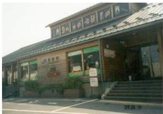
No5. 虎姫駅 20090619 (金) 14:31