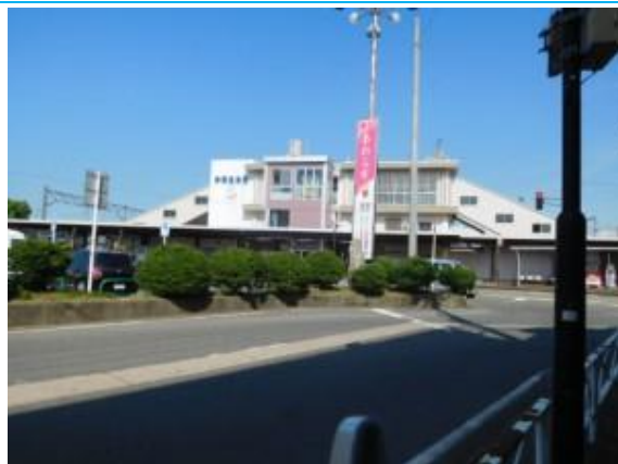
No27. 芦原温泉駅 (あわらおんせん) 20180803 (金) 14:40