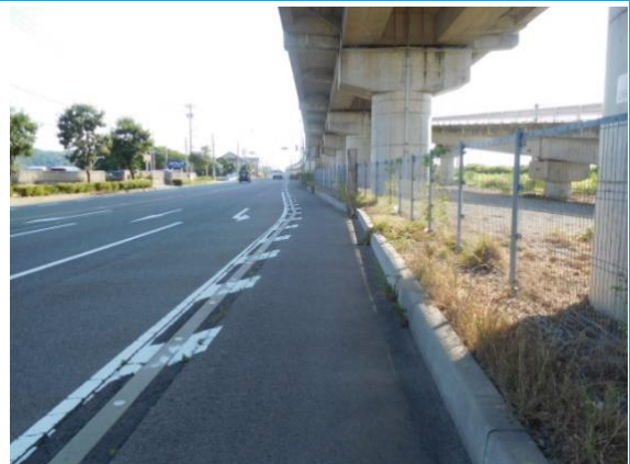
新幹線下を歩く (森本駅への路)