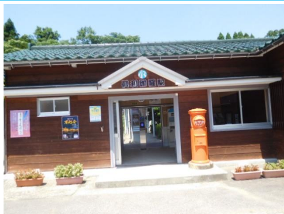
No47. 倶利伽羅駅 20180801 (水) 12:37