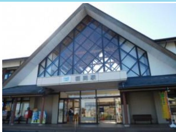
No49. 福岡駅 20200908 (火) 8:12