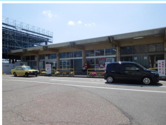
No48. 石動駅 (いするぎ) 20180801 (水) 10:33 20200908 (火) 6:17