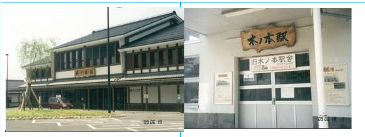
No8. 木ノ本駅 20090619 (金) 11:15 20130909 (月) 16:58