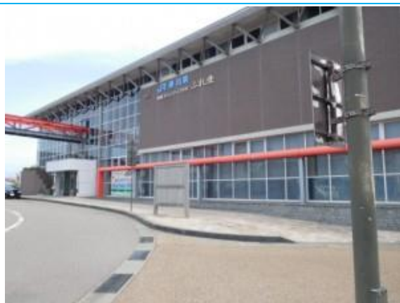
No38. 美川駅 20180802 (木) 13:50