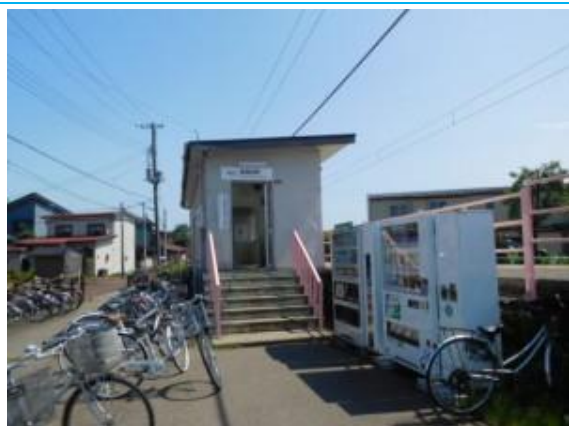
No44. 南高田駅 20180602 (土) 14:03