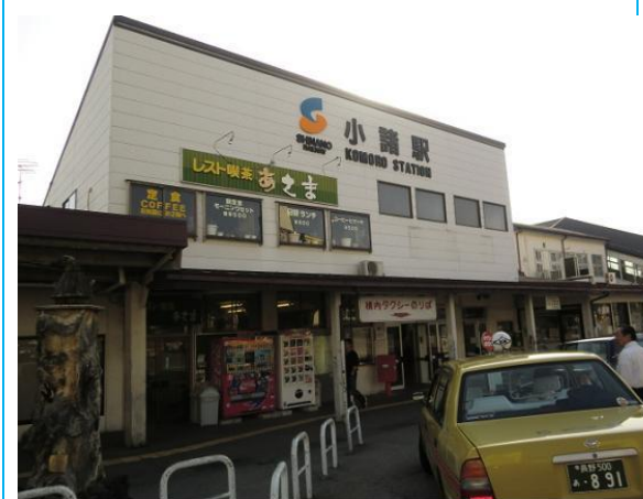
No14. 小諸駅 20120428 (土) 16:32