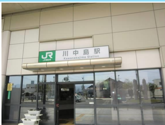
No29. 川中島駅 20120429 (日) 10:58