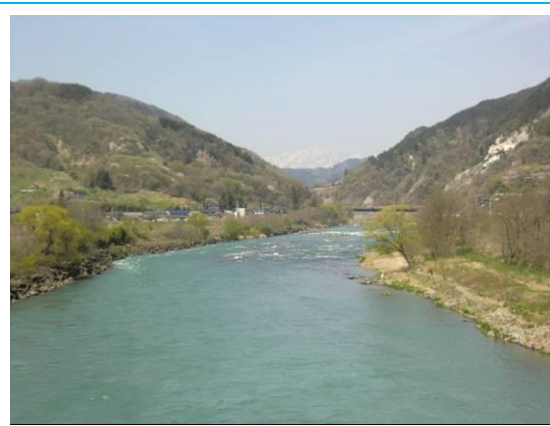
犀川 (川中島駅への路)