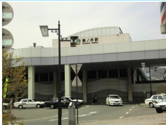
No27. 篠ノ井駅 20120429 (日) 12:05