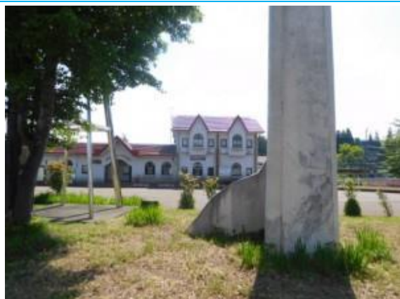
No39. 関山駅 20180604 (月) 9:08