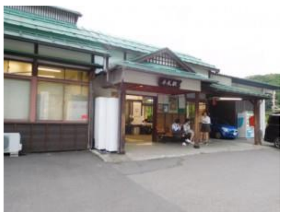
No35. 牟礼駅 20180604 (月) 18:17 20180605 (火) 8:09