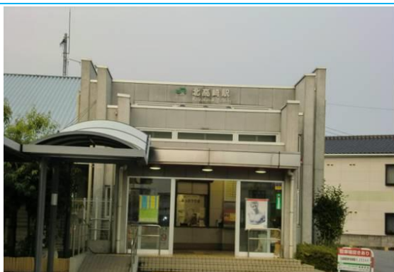
No2. 北高崎駅 20120728（土）18:23