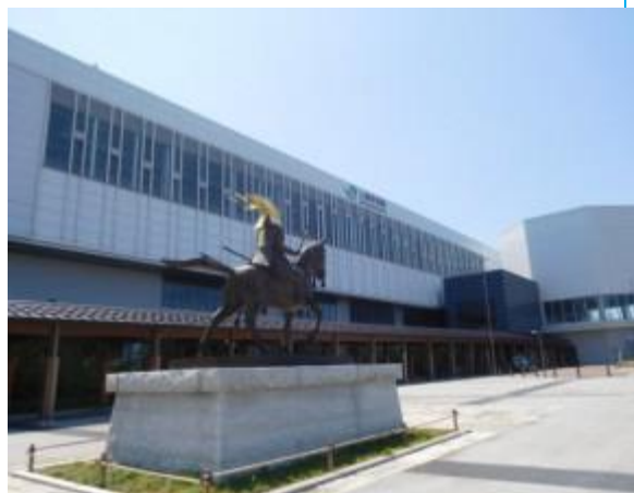
No43. 上越妙高駅 20180602 (土) 13:15