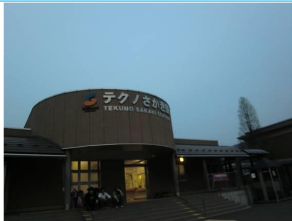
No21. テクノさかき駅 20120429 (日) 18:30