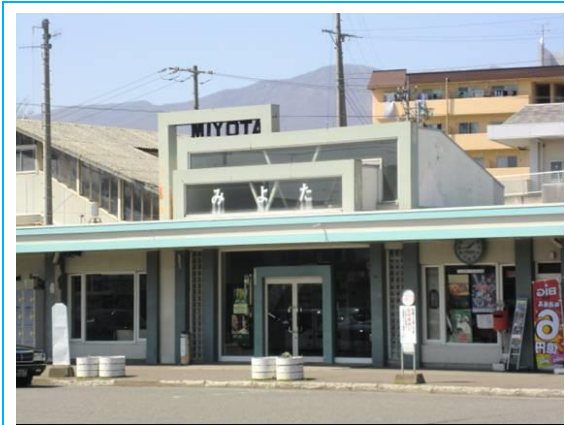
No12. 御代田駅 20120428 (土) 13:47