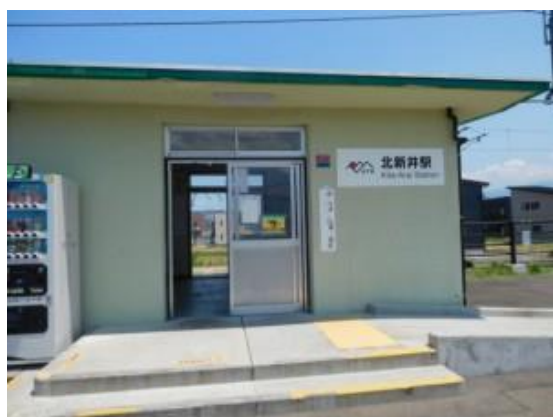
No42. 北新井駅 20180602 (土) 12:17