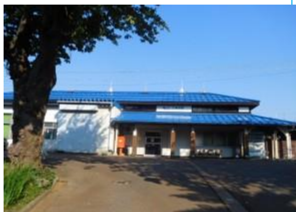
No40. 二本木駅 20180604 (月) 7:11