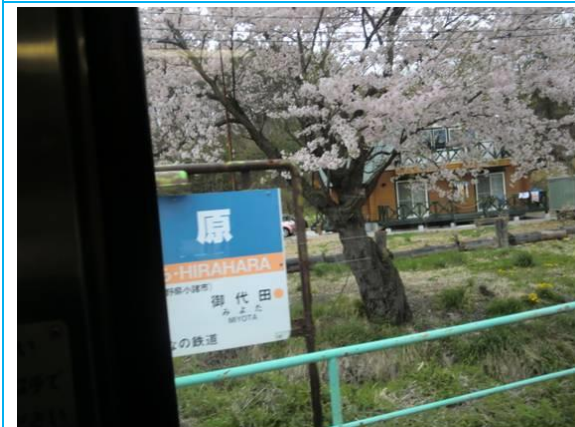
No13. 平原駅 20120428 (土) 未踏破 20120430 (月) 11:50 車内より