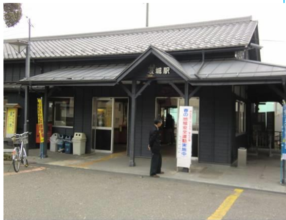
No22. 坂城駅 20120429 (日) 17:32