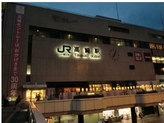
No1. 高崎駅 20120728（土）19:05