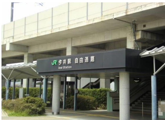
No28. 今井駅 20120429 (日) 11:33