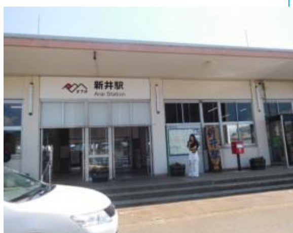
No41. 新井駅 20180602 (土) 10:47 20180604 (月) 5:31