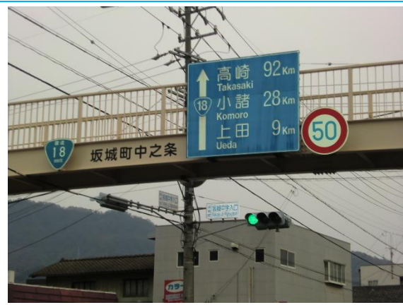
テクノさかき駅への路