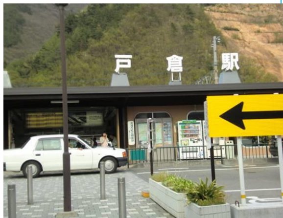
No23. 戸倉駅 20120429 (日) 16:11