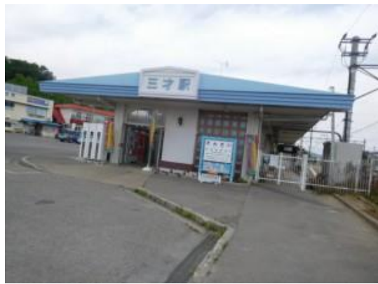
No33. 三才駅 20180605 (火) 12:00