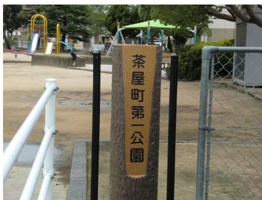
茶屋町第一公園 (茶屋町への路)