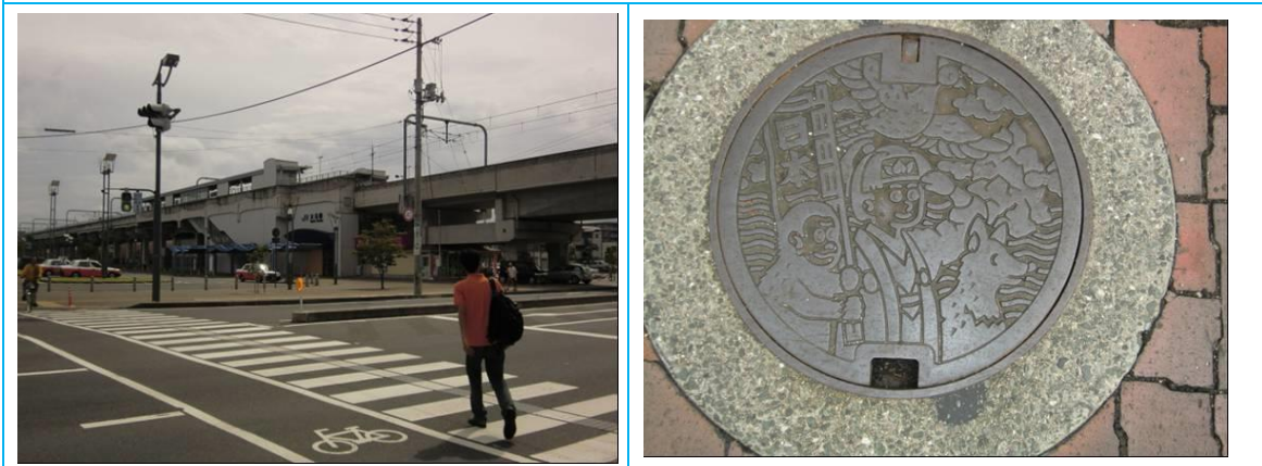
No91. 大元駅 20120814 (火) 14:17