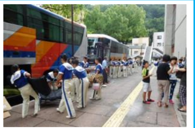
大洗高校マーチングバンド部による吹奏楽団コンサート（39名による）