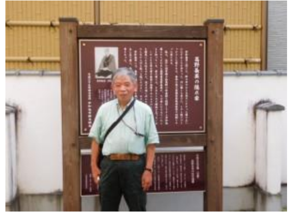
高野長英隠れ家邸前