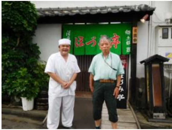
食事処”ほづみ亭”のマスター