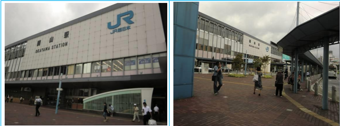
No90. 岡山駅 20120814 (火) 13:35