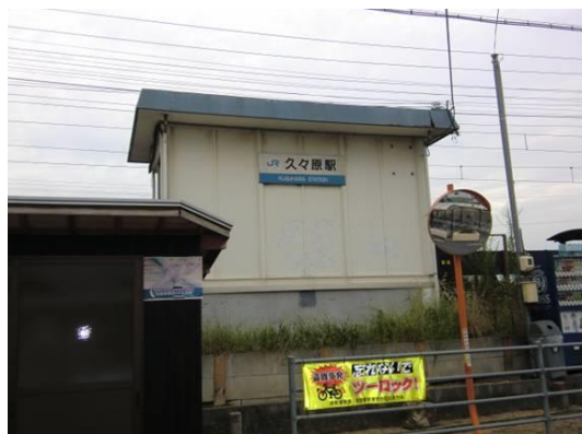
No96 久々原駅. 20120814 (火) 17:47