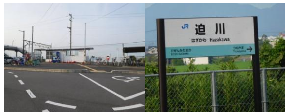
No100. 迫川駅 (はざがわ)