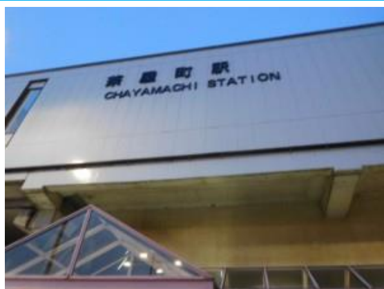
No97. 茶屋町駅 20120814 (火) 18:21 20200806 (木) 19:17