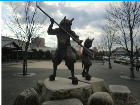
No97. 茶屋町駅 (再掲) 20131228 (月) 10:49