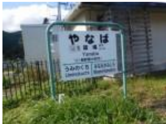
No39. 築場駅（やなば） 20201005（月）13:38