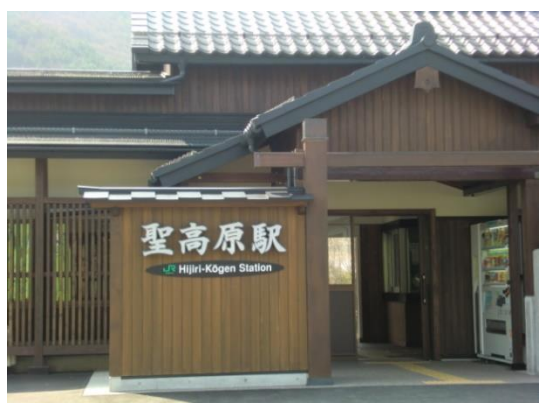
Np11. 聖高原駅 20140427(日)9:28