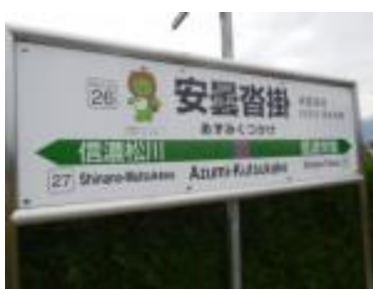
No31. 安曇沓掛駅 20201003 (土) 15:04