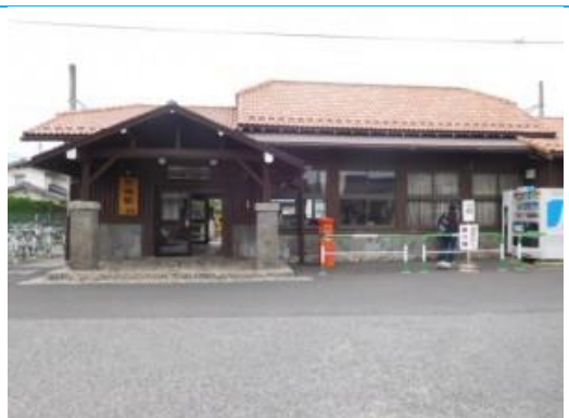
No26. 有明駅 20201003 (土) 11:49