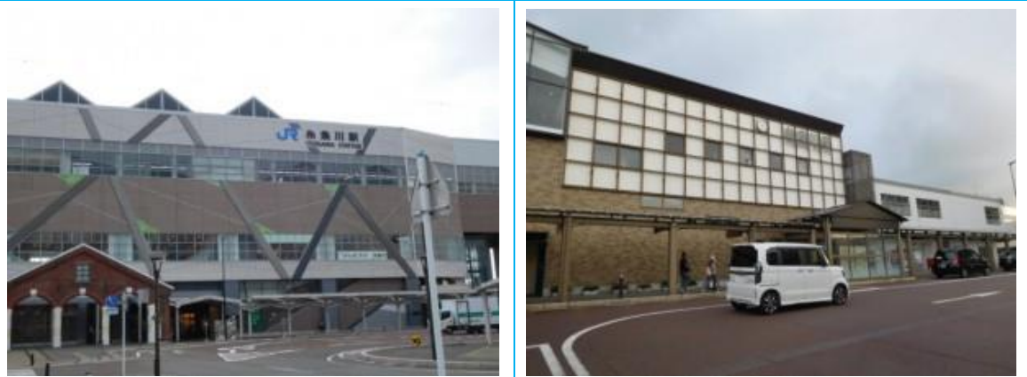
No55. 糸魚川駅 (新幹線側)