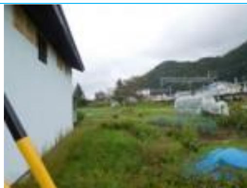
No41. 神城駅 20201005（月）10:31