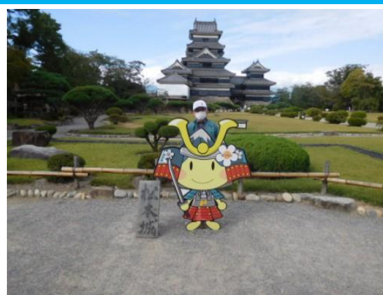
国宝松本城 20201007 (水) 9:00