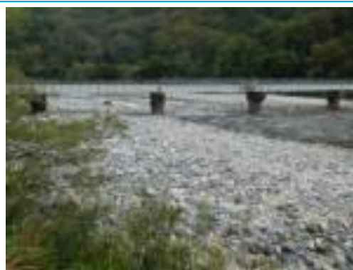
中土駅への路 (引き返し経路)