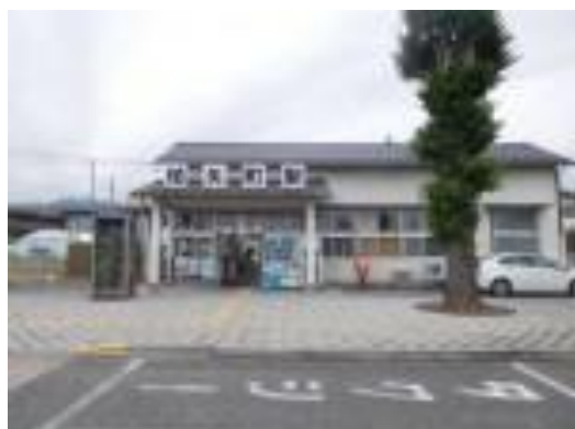
No24. 柏矢町駅 20201006 (火) 9:59