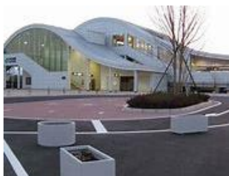
No4. 平田駅 (新設)