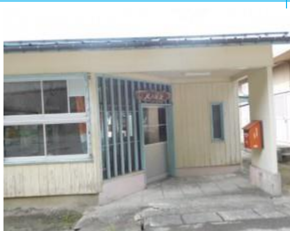
No49. 北小谷駅 20201004 (日) 13:15