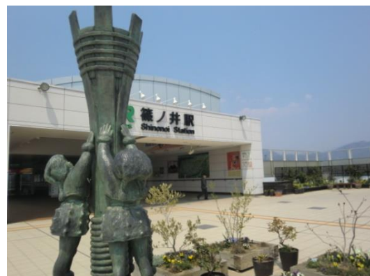
No15. 篠ノ井駅 20140426 (土) 10:56