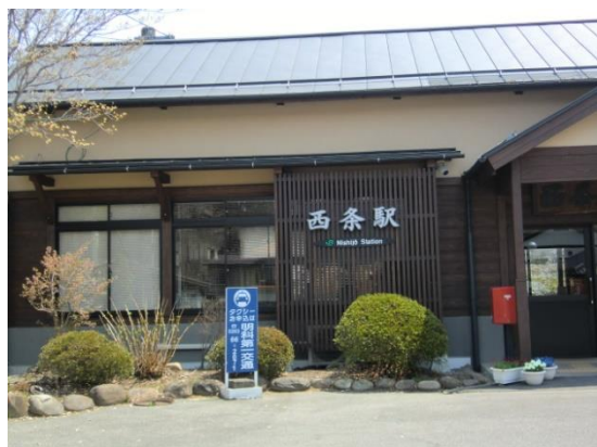
No9. 西条駅 20140427(日)12:08