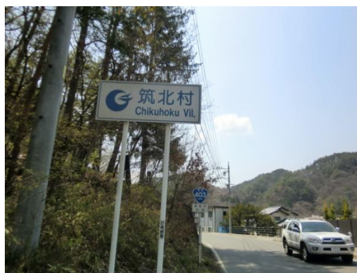
麻績村から筑北村へ 10:36