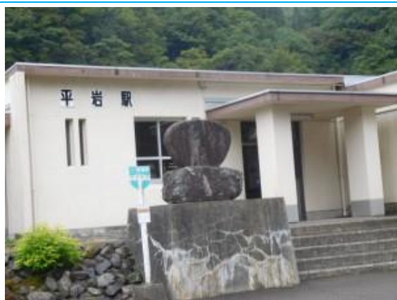
No50. 平岩駅 20201004 (日) 10:33