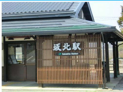
No10. 坂北駅 20140427(日)11:01