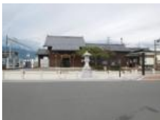
No25. 穂高駅 20201003 (土) 10:54 20201006 (火) 9:05