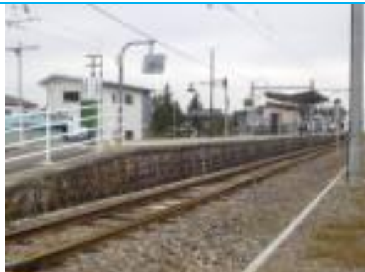
No30. 信濃松川駅 20201003 (土) 14:13