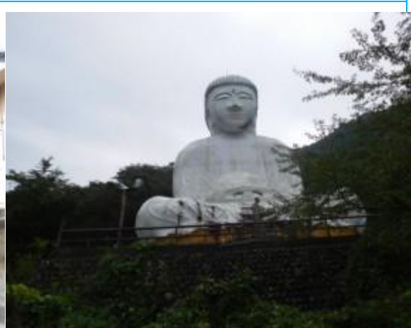
北小谷駅への路 (白い大仏)