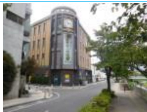
松本市時計博物館 20201007 (水) 10:30