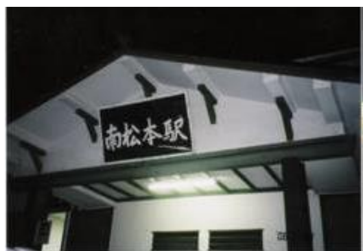
No5. 南松本駅 20061103 (土) 17:55