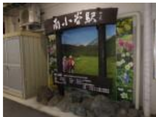
No47. 南小谷駅 (おたり)