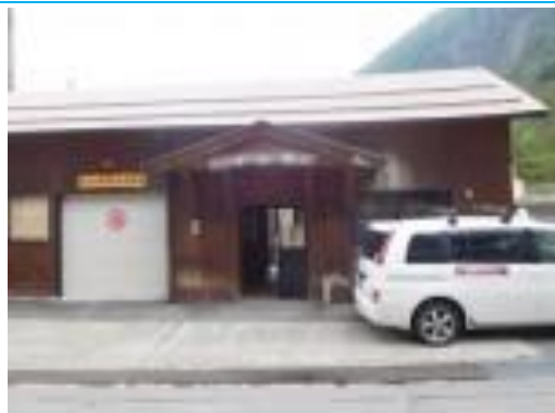
No48. 中土駅 20201004 (日) 15:07