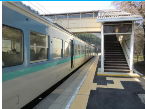
No12. 冠着駅 (かむりき)