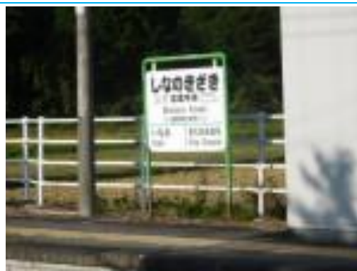
No36. 信濃木崎駅 20201005 (月) 16:02