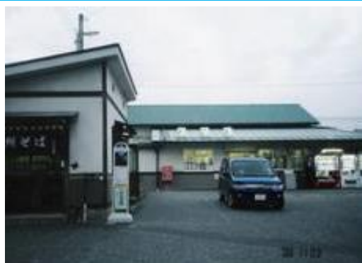
No3. 村井駅 20061103 (土) 16:35