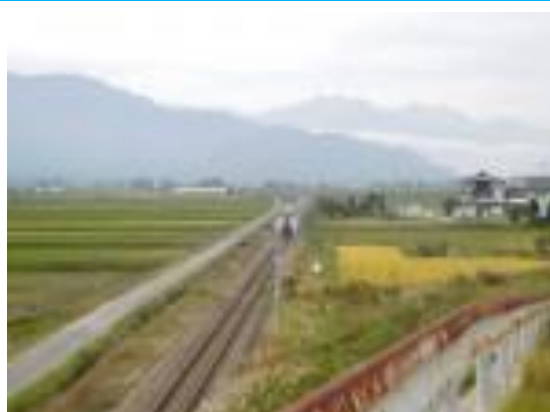
No32. 信濃常盤駅 20201003 (土) 15:47