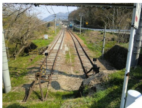
No13. 姨捨駅 (おばすて) 稲荷山駅から姨捨駅の間でスイッチバックあり